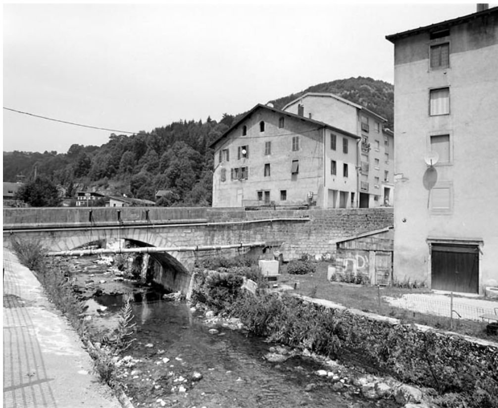
Vue d'ensemble, depuis la rive gauche en amont.