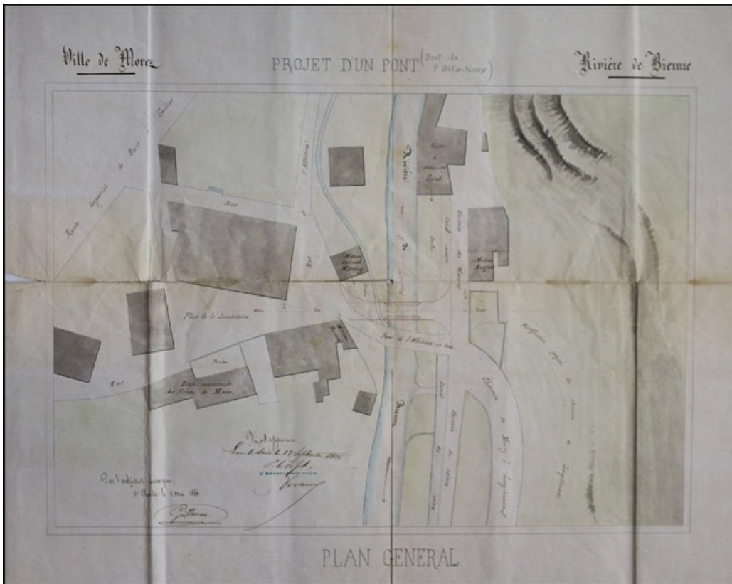
Projet d'un pont sur la Bienne. Pont de l'Affaitieux, 1866.