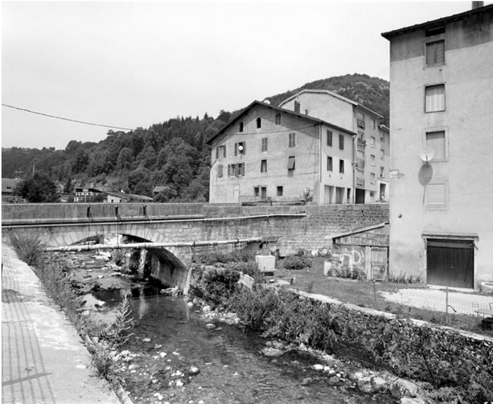
Vue d'ensemble, depuis la rive gauche en amont.