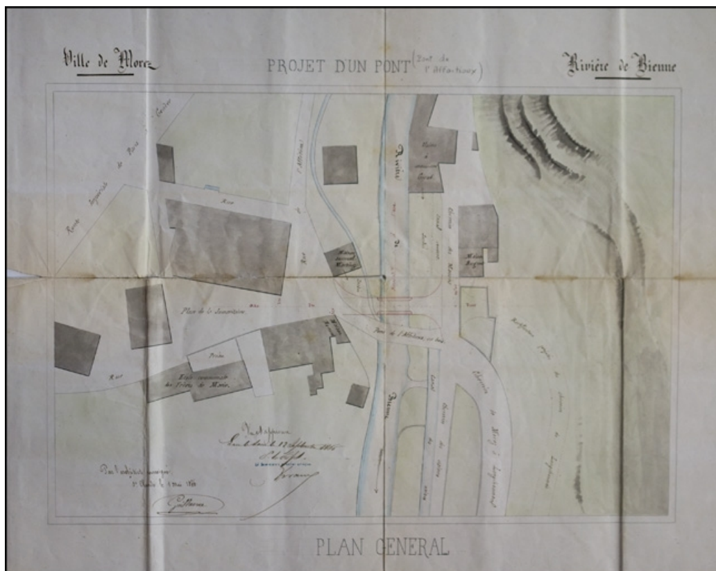
Projet d'un pont sur la Bienne. Pont de l'Affaitieux, 1866.