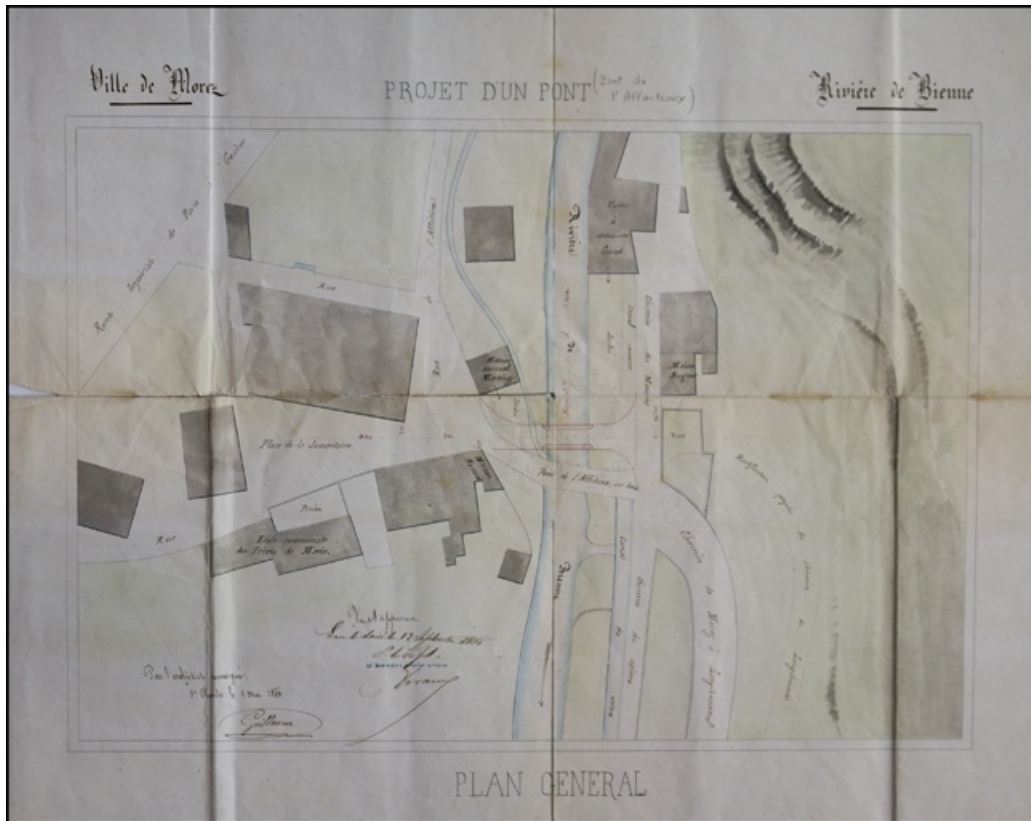
Projet d'un pont sur la Bienne. Pont de l'Affaitieux, 1866.