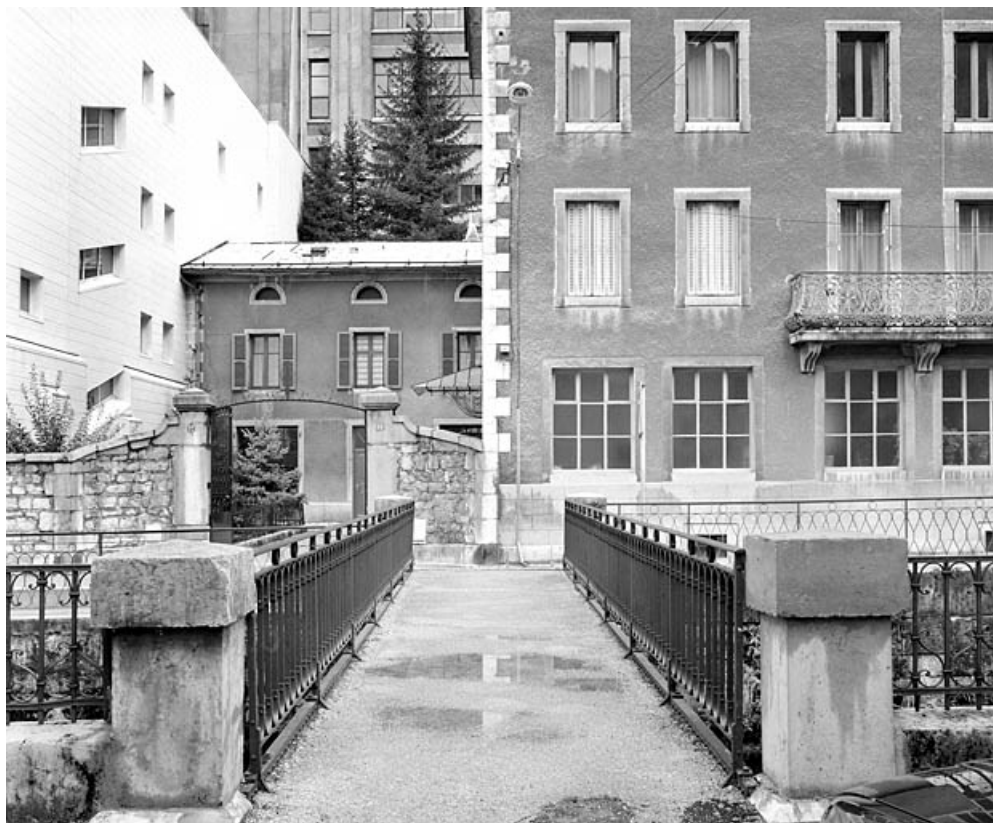
Le tablier, depuis la rue du Docteur Regad. 39, Morez quai Aimé Lamy