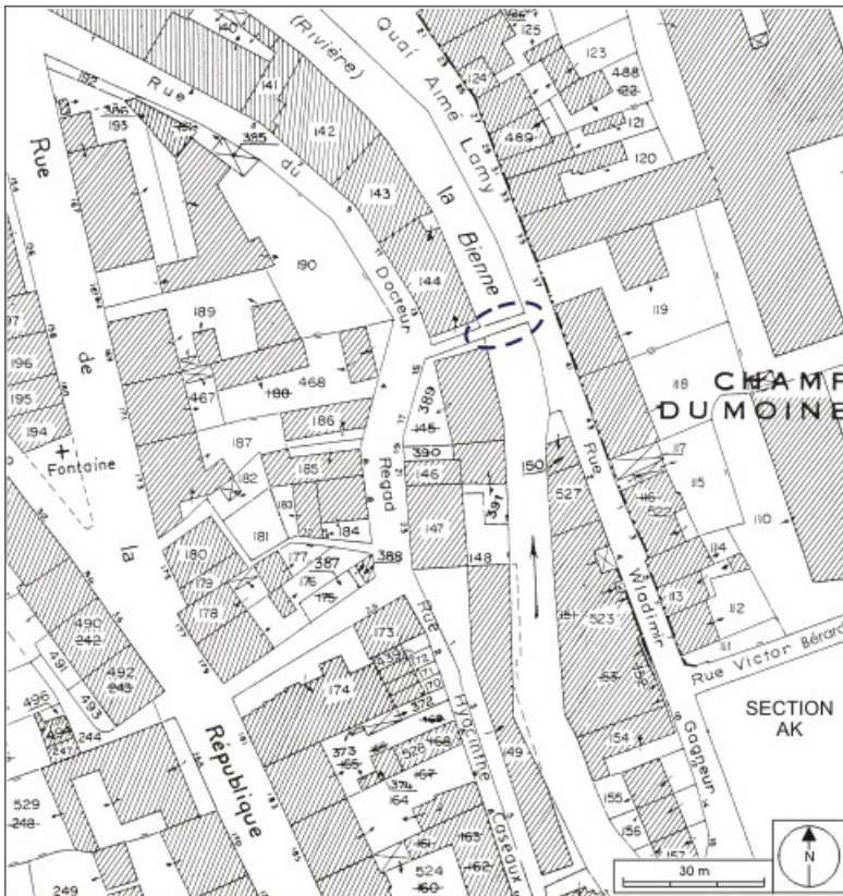
Plan de situation. Extrait du plan cadastral, 1980, section AI, échelle 1:1000. 39, Morez quai Aimé Lamy