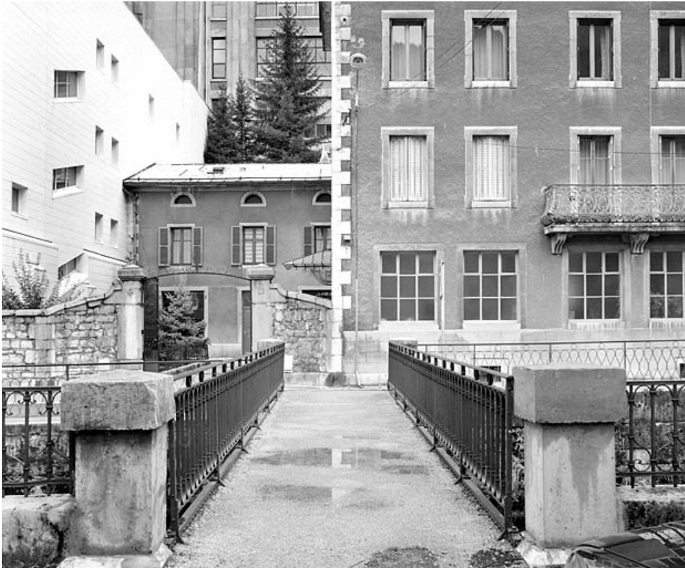
Le tablier, depuis la rue du Docteur Regad. 39, Morez quai Aimé Lamy