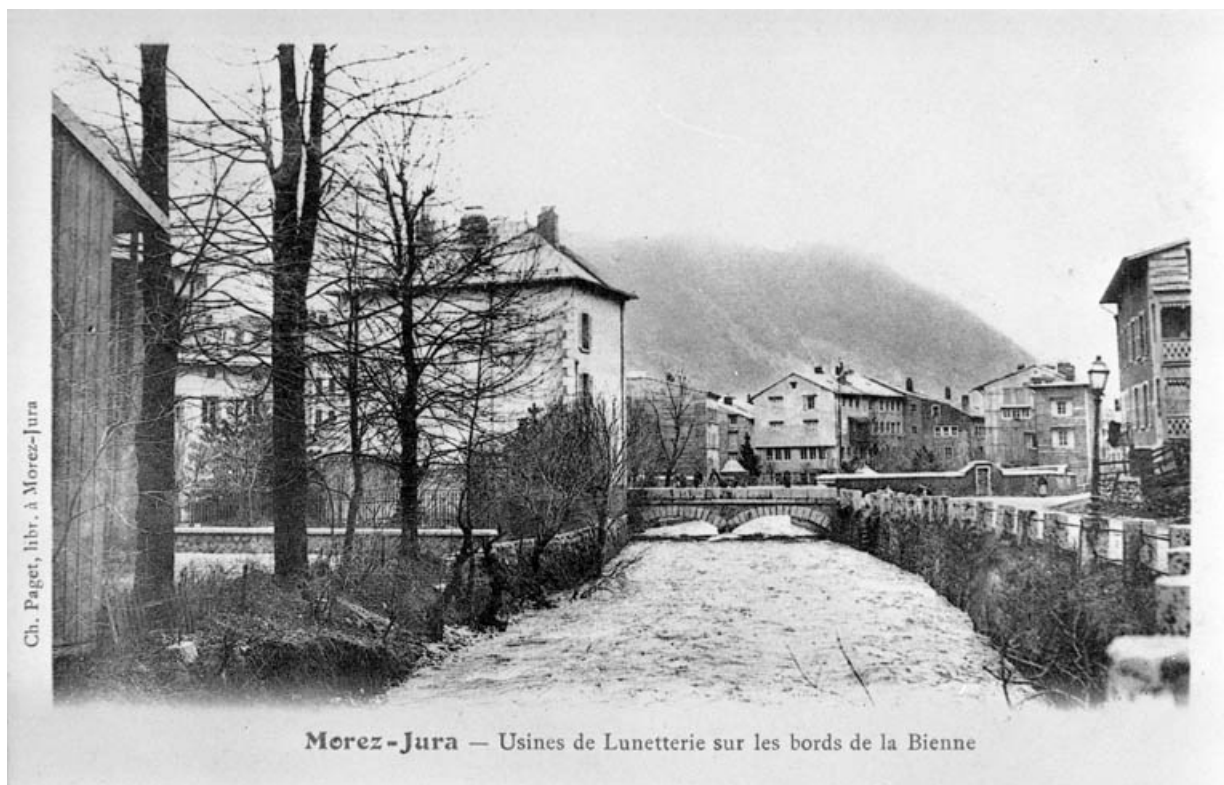
Morez-Jura - Usines de Lunetterie sur les bords de la Bienne, 1er quart 20e siècle.