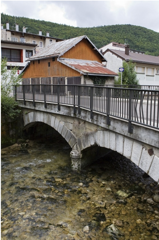
Vue d'ensemble, depuis la rive droite en amont.