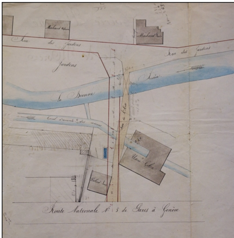
Rectification de la rue de l'Arse et établissement d'un pont et d'un ponceau pour son passage, 1878.