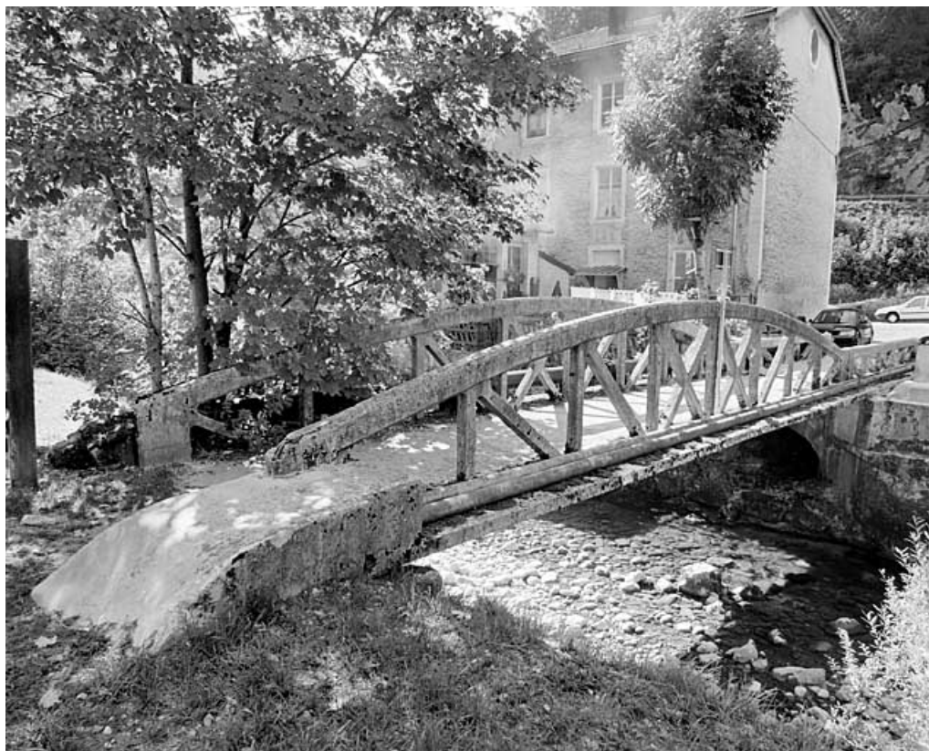
Vue d'ensemble, depuis la rive droite en aval.