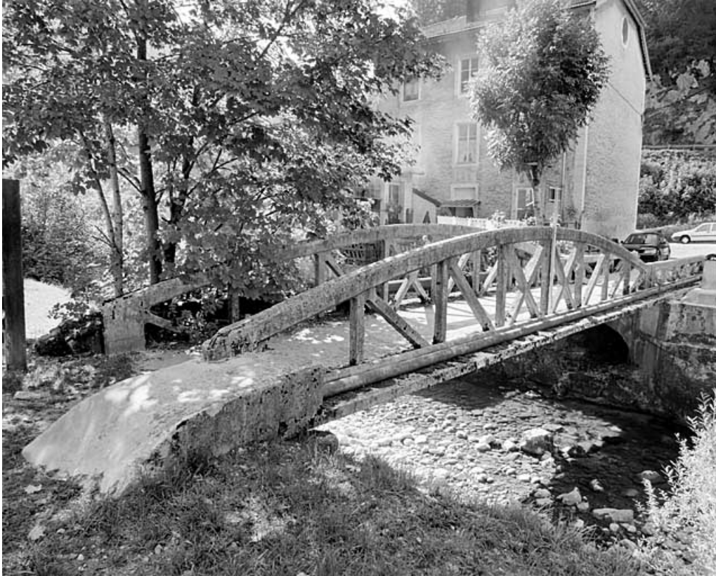
Vue d'ensemble, depuis la rive droite en aval.