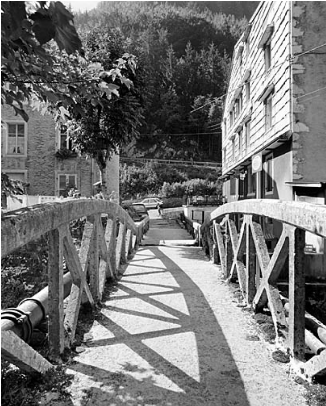
Tablier et garde-corps, depuis la rive droite. 39, Morez rue Emile Zola