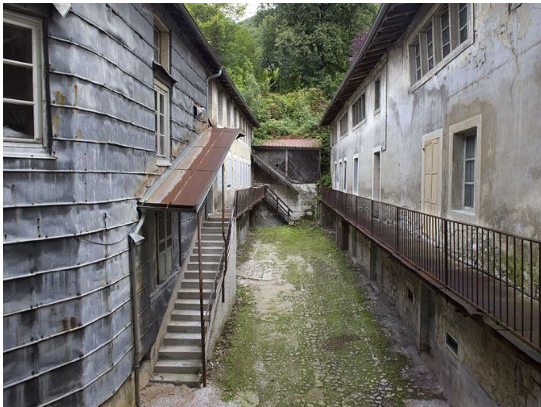
Vue d'ensemble de la cour et des deux ailes, depuis le premier étage.