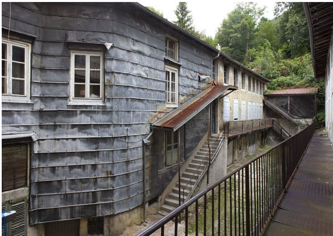
Aile nord, de trois quarts gauche. 39, Morez, 161 rue de la République