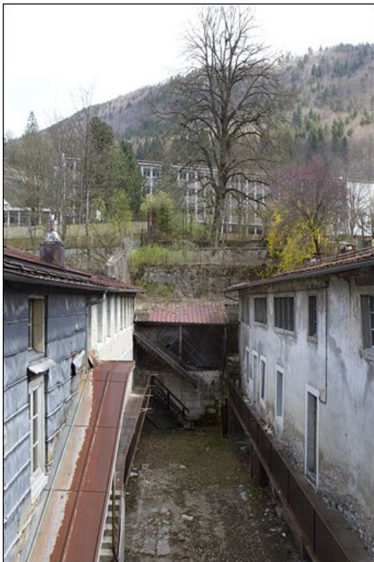
Immeuble avec atelier (18e siècle) au n° 161 rue de la République : murs de soutènement des jardins. 39, Morez, 161 rue de la République