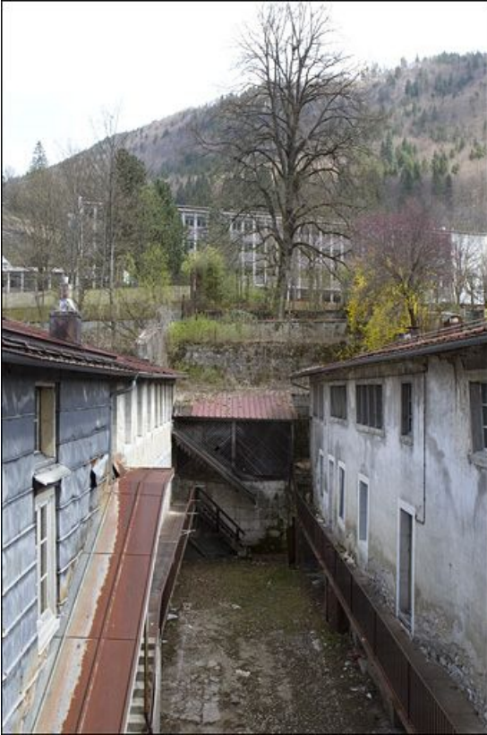
Immeuble avec atelier (18e siècle) au n° 161 rue de la République : murs de soutènement des jardins. 39, Morez, 161 rue de la République