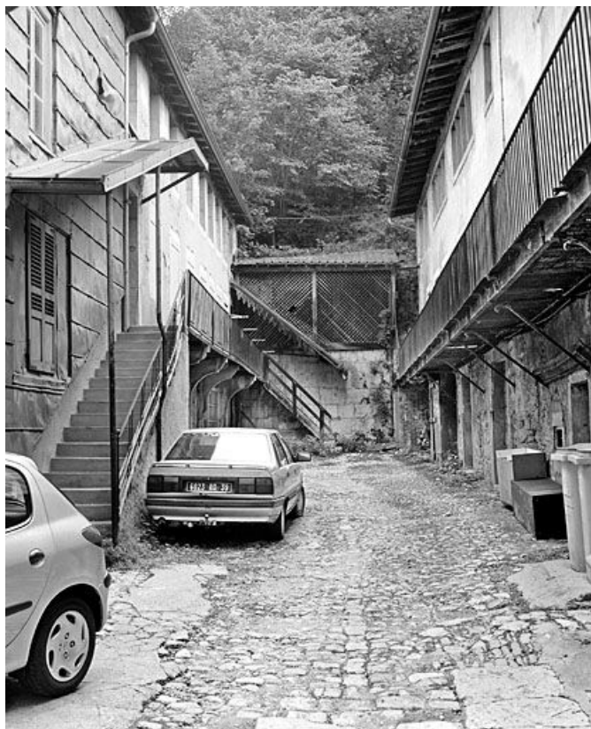
Vue d'ensemble de la cour et des deux ailes, depuis le rez-de-chaussée.