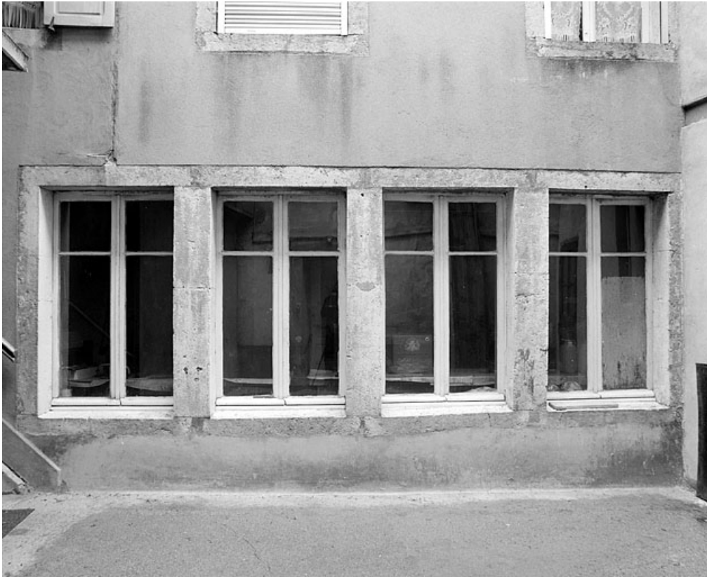
Aile sud : fenêtres jumelées.