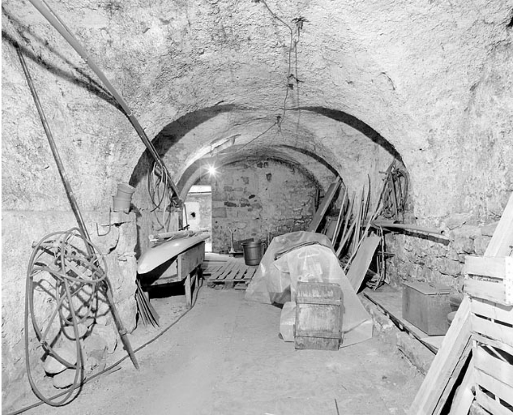
Aile est : rez-de-chaussée voûté.