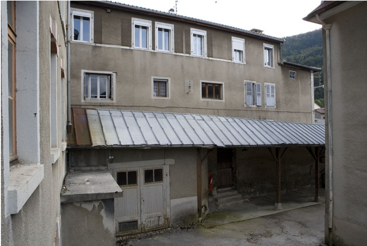
Aile nord, depuis la cour de l'usine voisine.