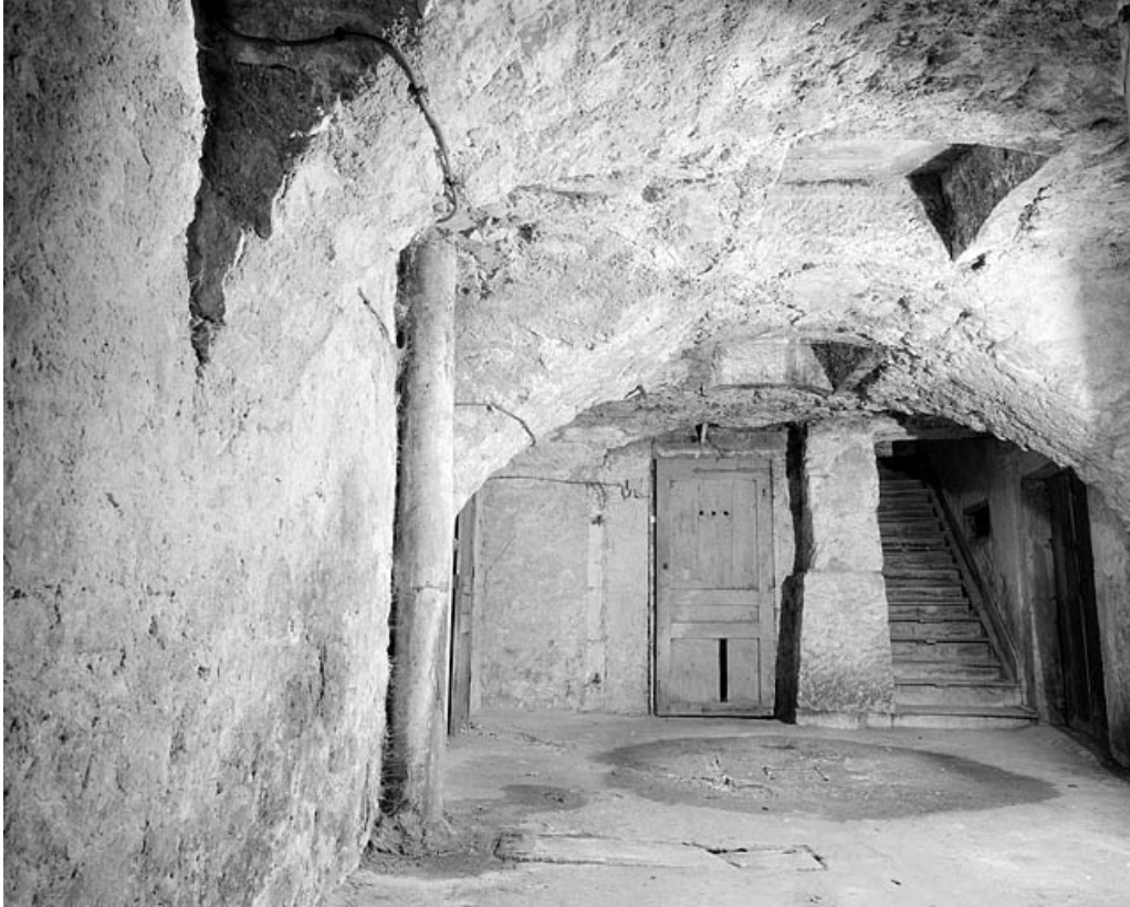
Cour : vue d'ensemble des voûtes.