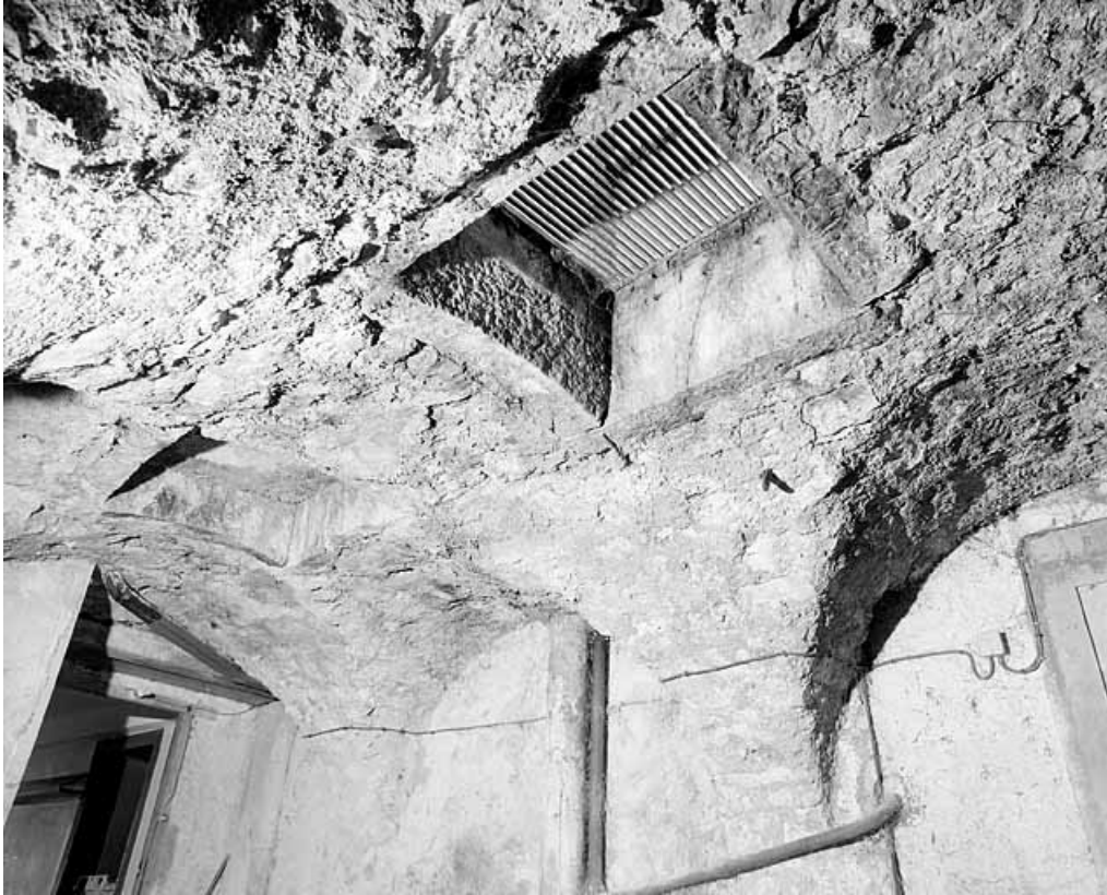
Cour : puits de lumière.