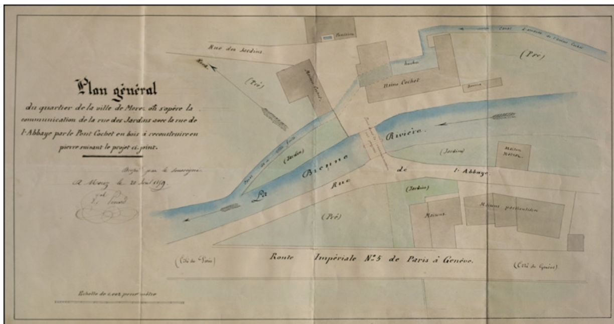
Plan général du quartier de la ville de Morez où s'opère la communication de la rue des Jardins avec la rue de l'Abbaye [...], 1859. 39, Morez, 39, 41 rue Wladimir Gagneur