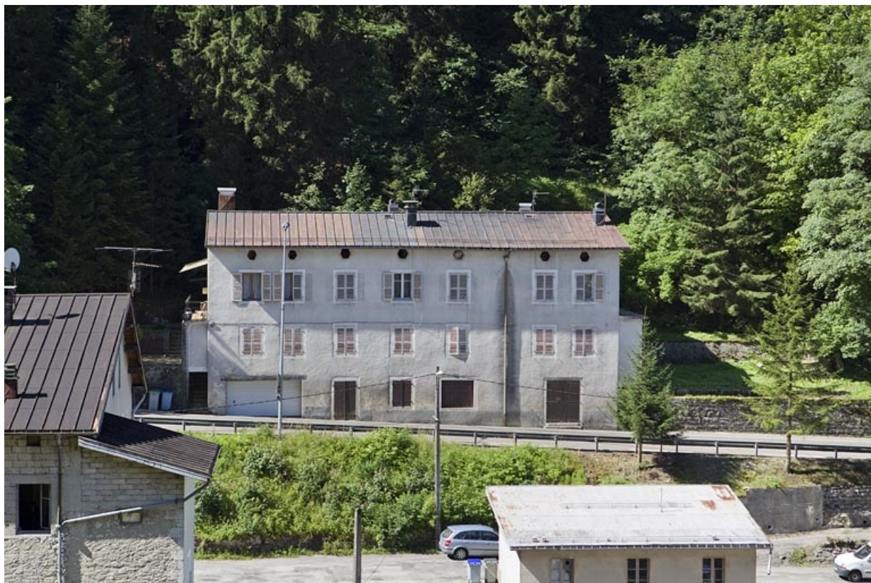
Vue d'ensemble plongeante, depuis le nord-est.