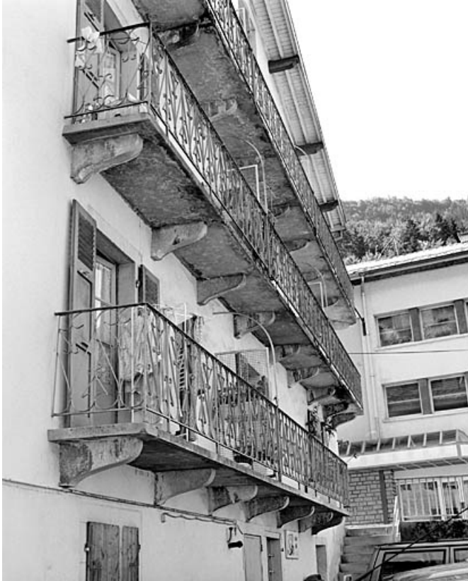
Balcon : détail.