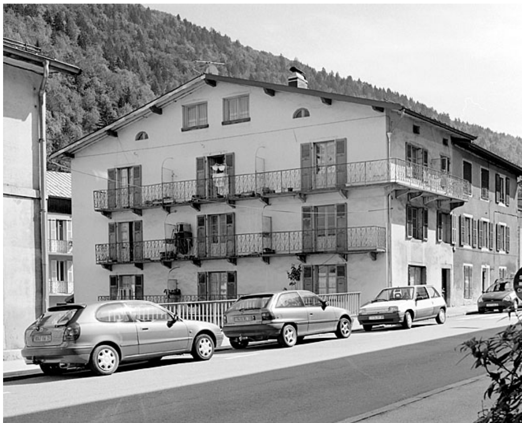
Vue d'ensemble, depuis le nord-ouest (rue de la République).