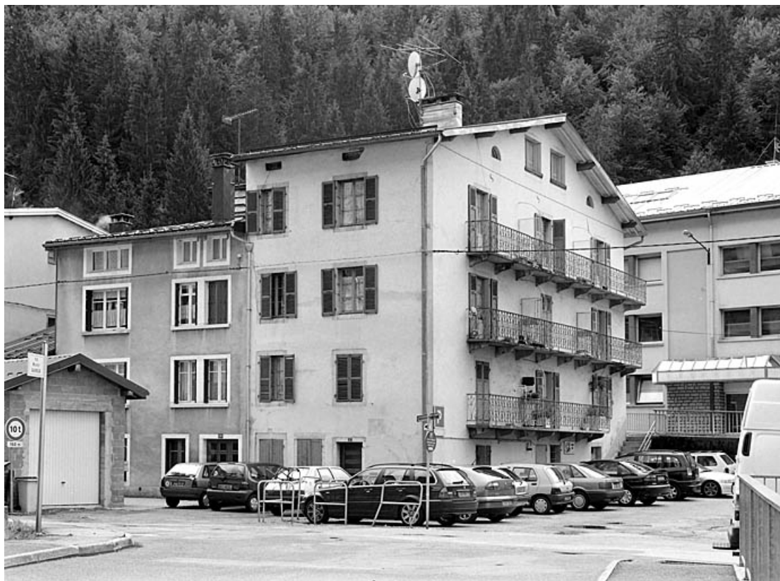
Vue d'ensemble, depuis le nord-est (rue Emile Zola).