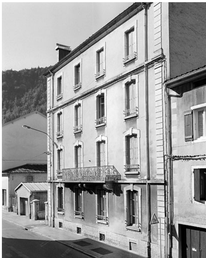
Vue d'ensemble depuis le nord-est : élévation antérieure.