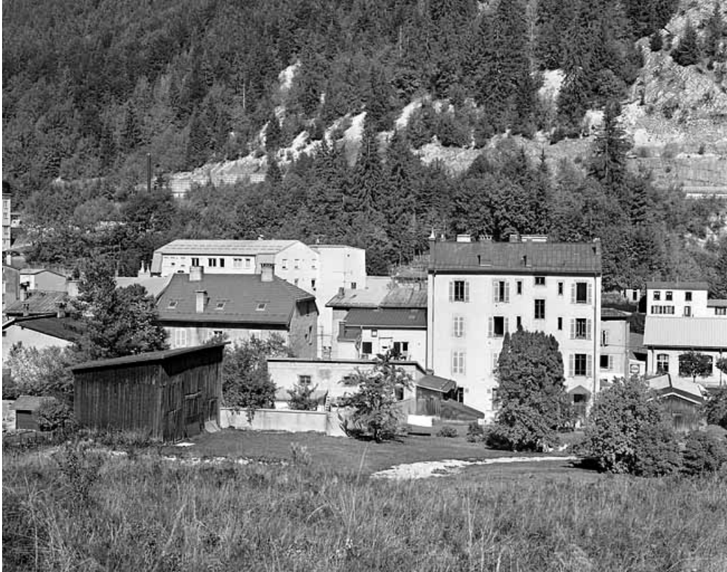
Vue d'ensemble depuis l'ouest : élévation postérieure.