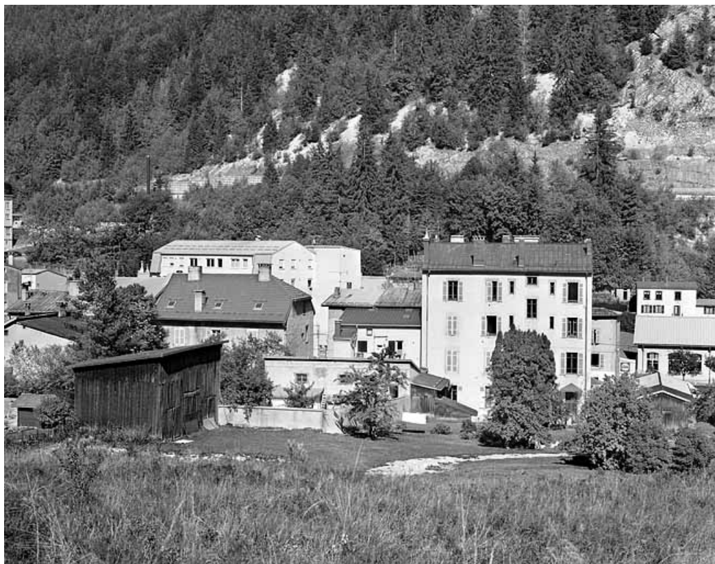
Vue d'ensemble depuis l'ouest : élévation postérieure.