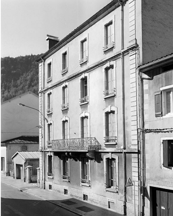
Vue d'ensemble depuis le nord-est : élévation antérieure.