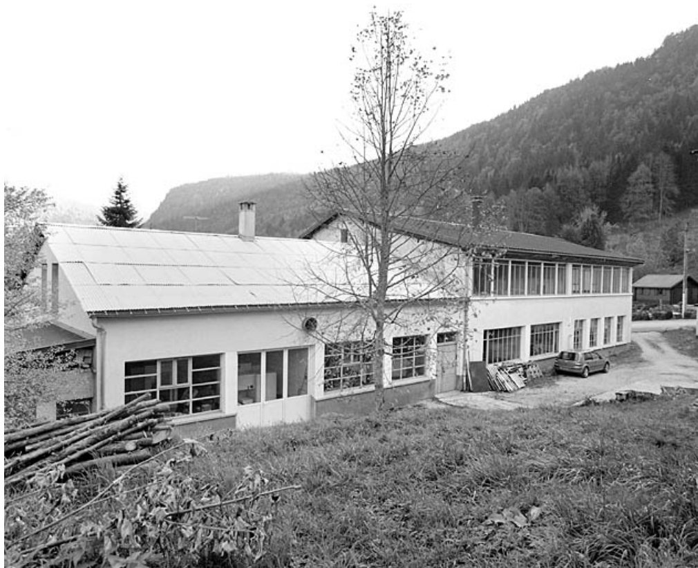
Vue d'ensemble depuis le nord : élévation postérieure.