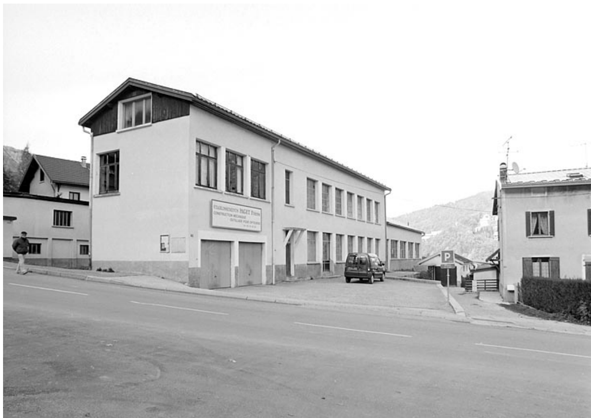
Vue d'ensemble depuis le sud : élévation antérieure.