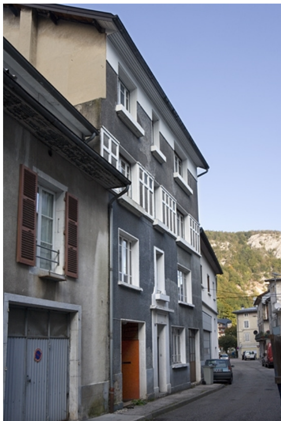
Vue d'ensemble, de trois quarts gauche.