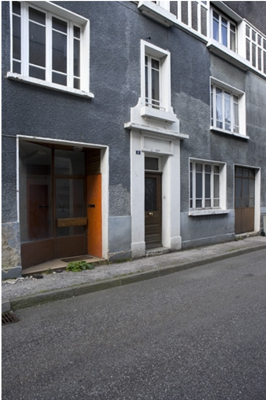
Baies du rez-de-chaussée et du premier étage.