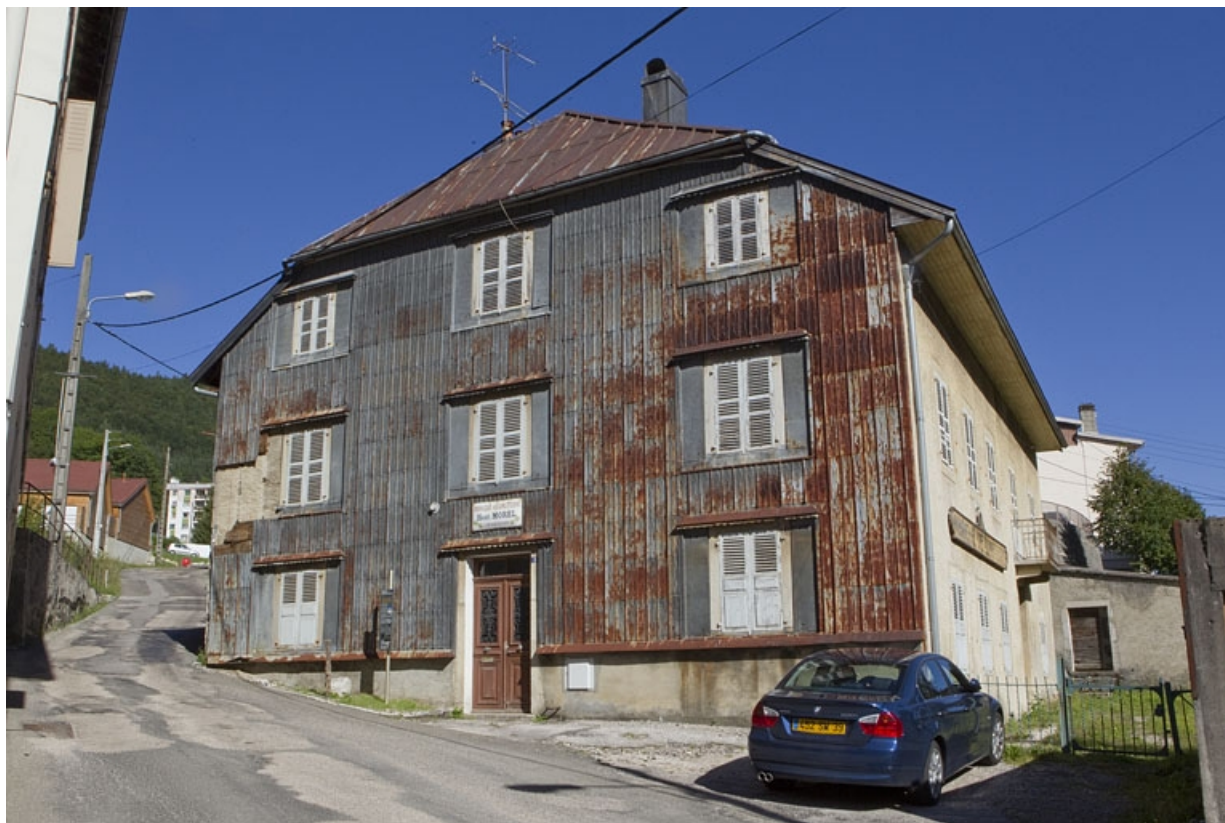
Maison : élévation antérieure, de trois quarts droite.