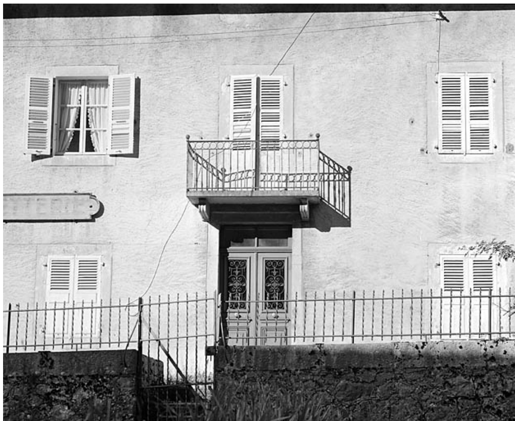
Maison : porte et porte-fenêtre de l'élévation latérale droite.