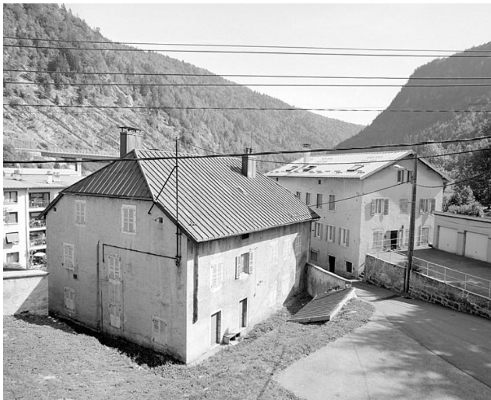
Vue d'ensemble, depuis le nord-ouest.