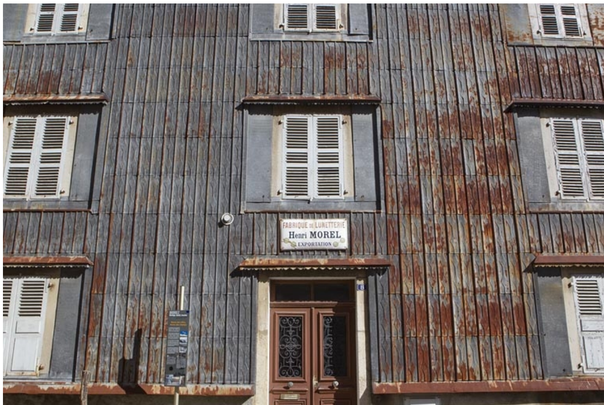
Maison : essentage de tôle sur l'élévation antérieure.