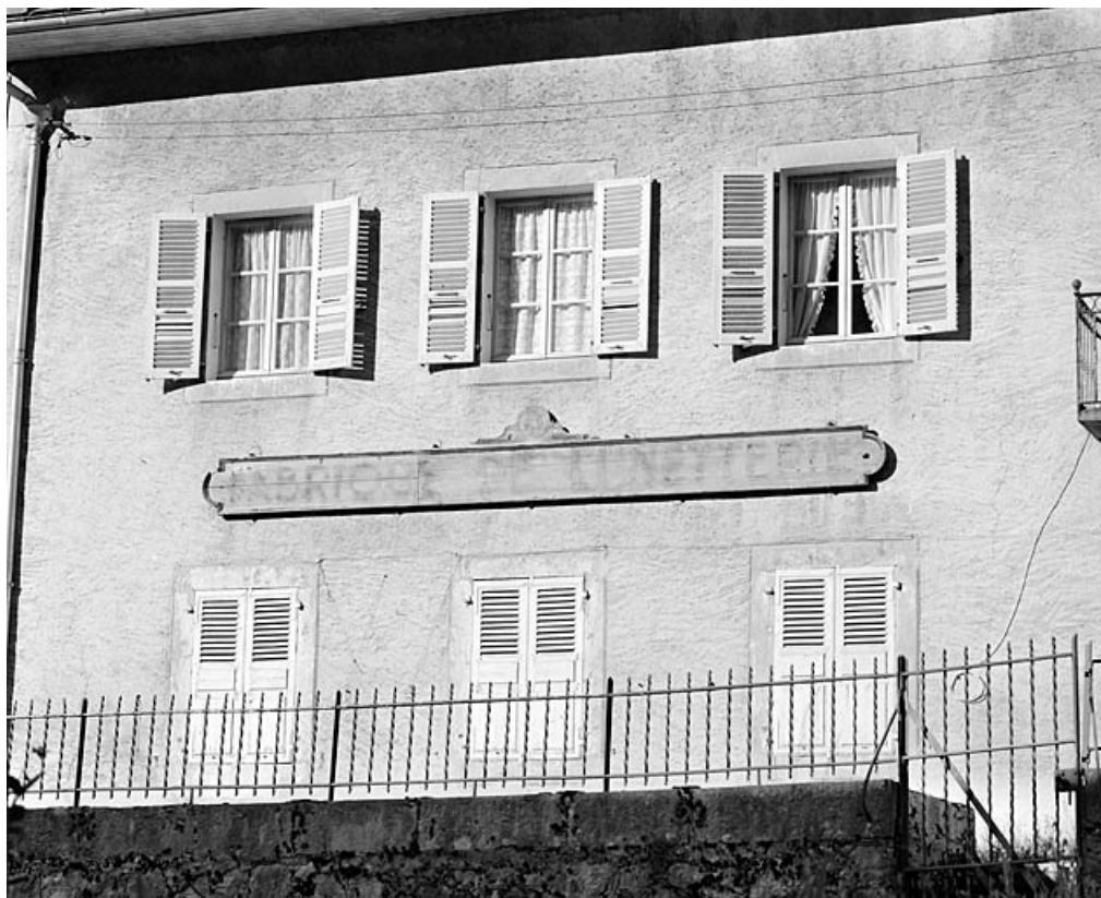
Maison : enseigne sur l'élévation latérale droite.