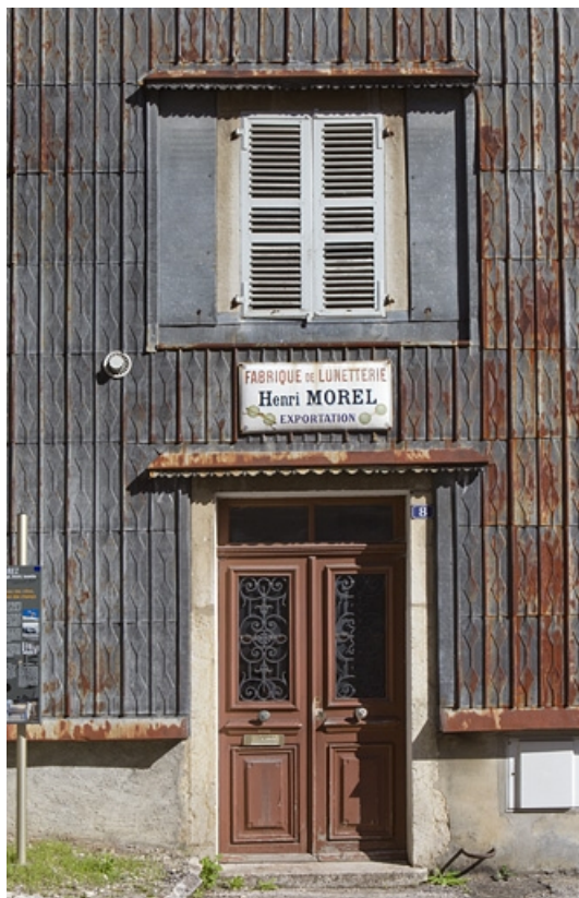
Maison : travée centrale de l'élévation antérieure. 39, Morez, 7, 8 rue de la Tannerie