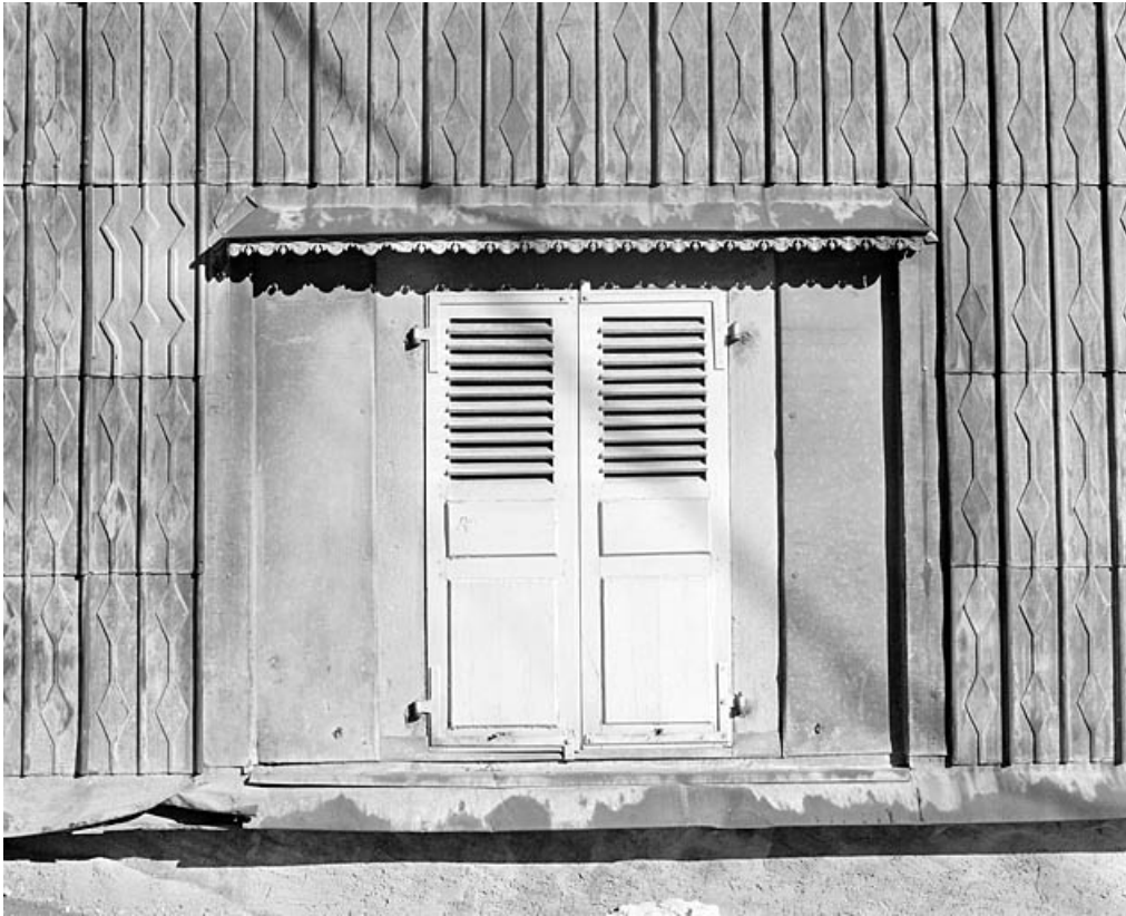
Maison : essentage de tôle et fenêtre du rez-de-chaussée.