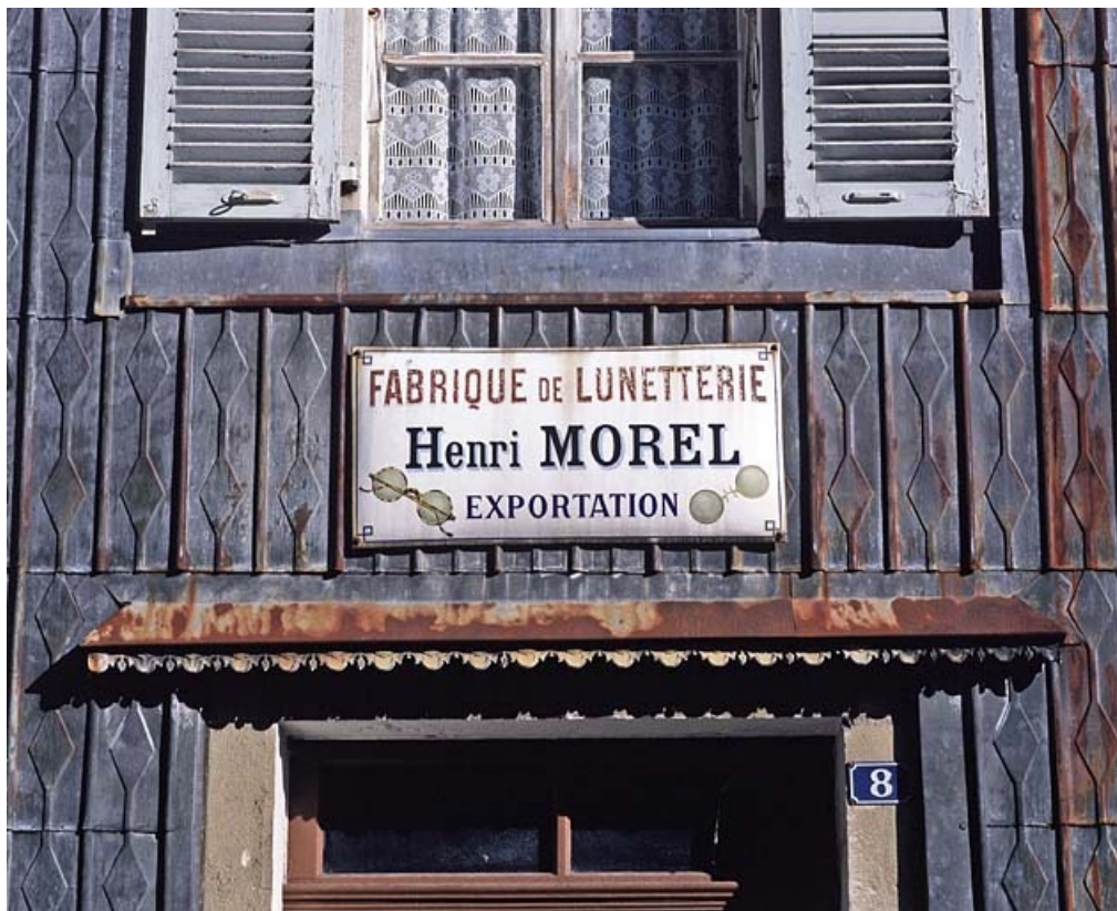
Maison : essentage de tôle et plaque émaillée.