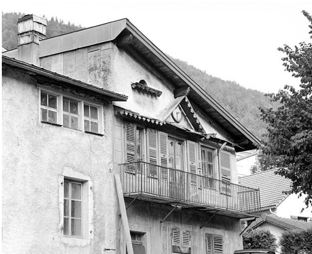
Etage du corps de bâtiment nord.