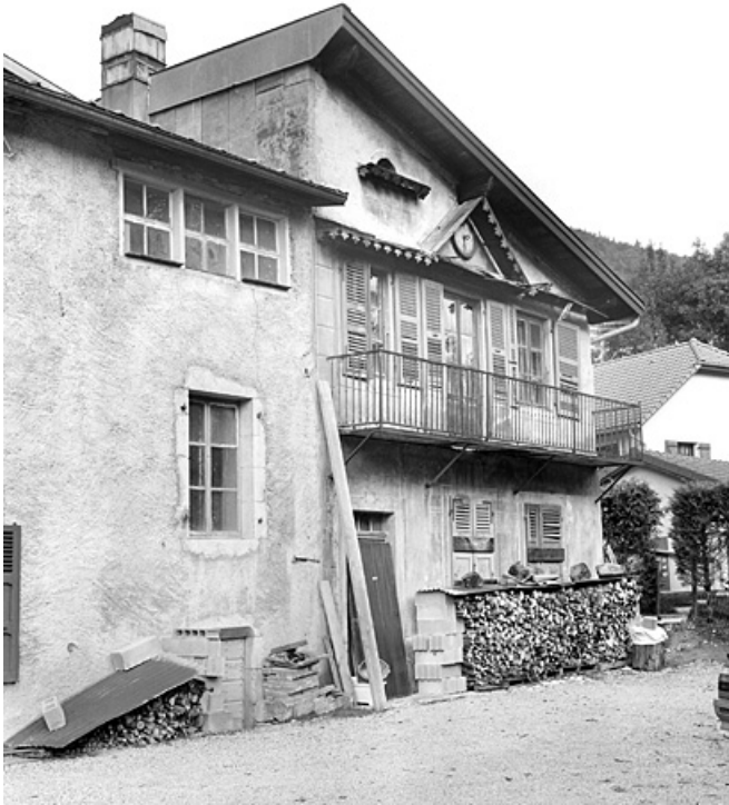
Elévation antérieure du corps de bâtiment nord.