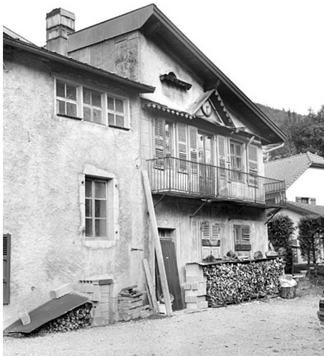
Élévation antérieure du corps de bâtiment nord.