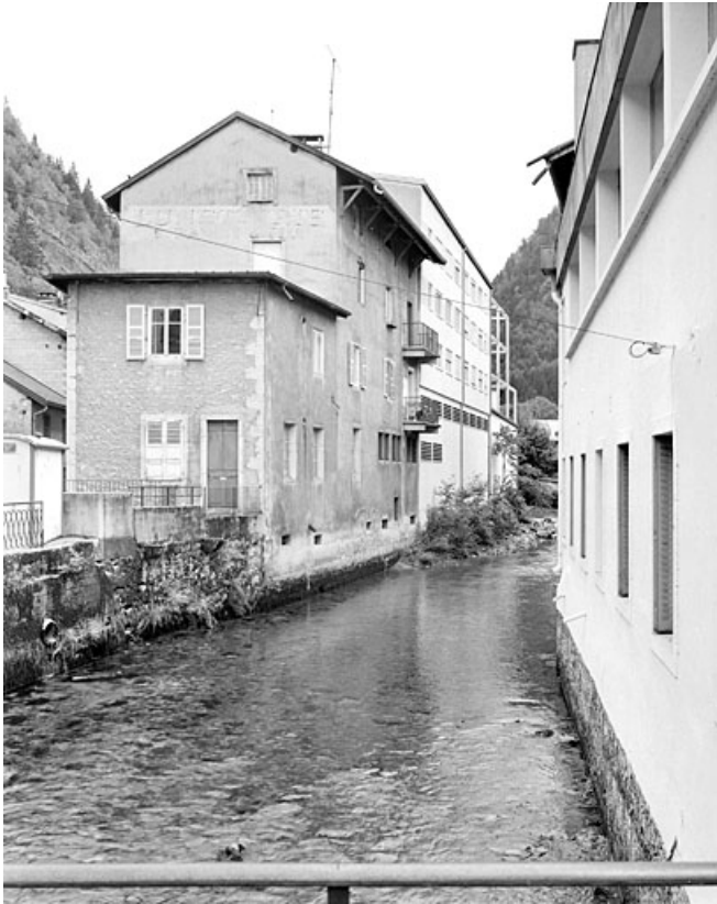
Vue d'ensemble depuis le nord-ouest : façades sur Bienne. 39, Morez, 2 rue Wladimir Gagneur