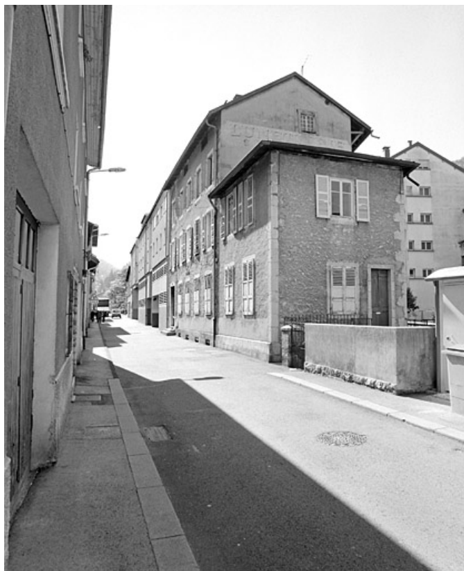
Vue d'ensemble depuis le nord-est : façades sur rue.