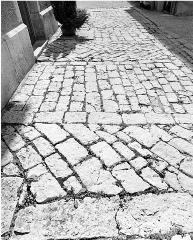
Sol pavé devant l'atelier.