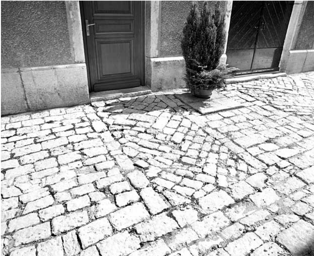
Sol pavé devant l'atelier.