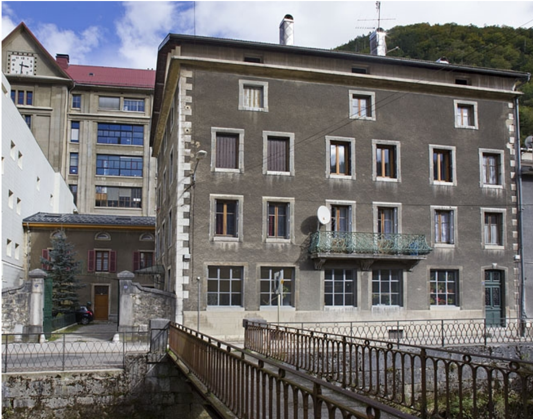
Vue d'ensemble, depuis l'ouest.