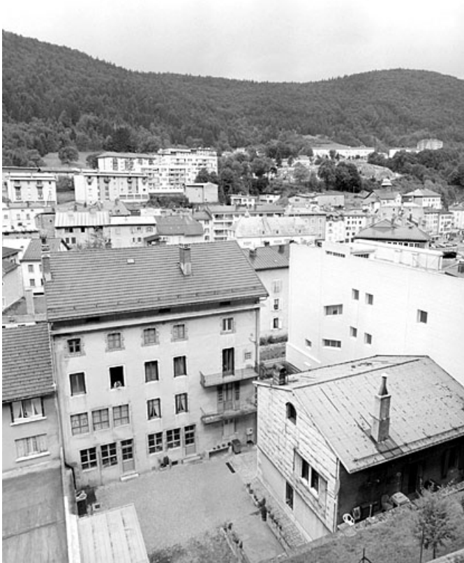
Vue d'ensemble, depuis l'est.