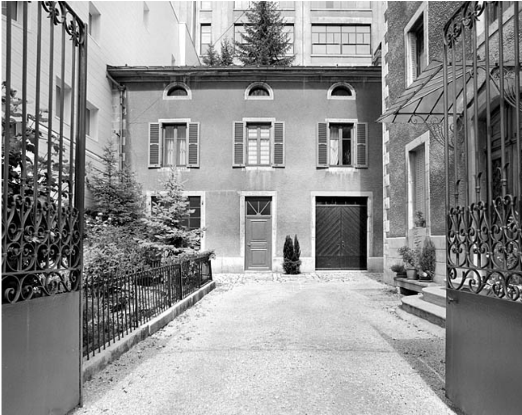
Façade antérieure de l'atelier.