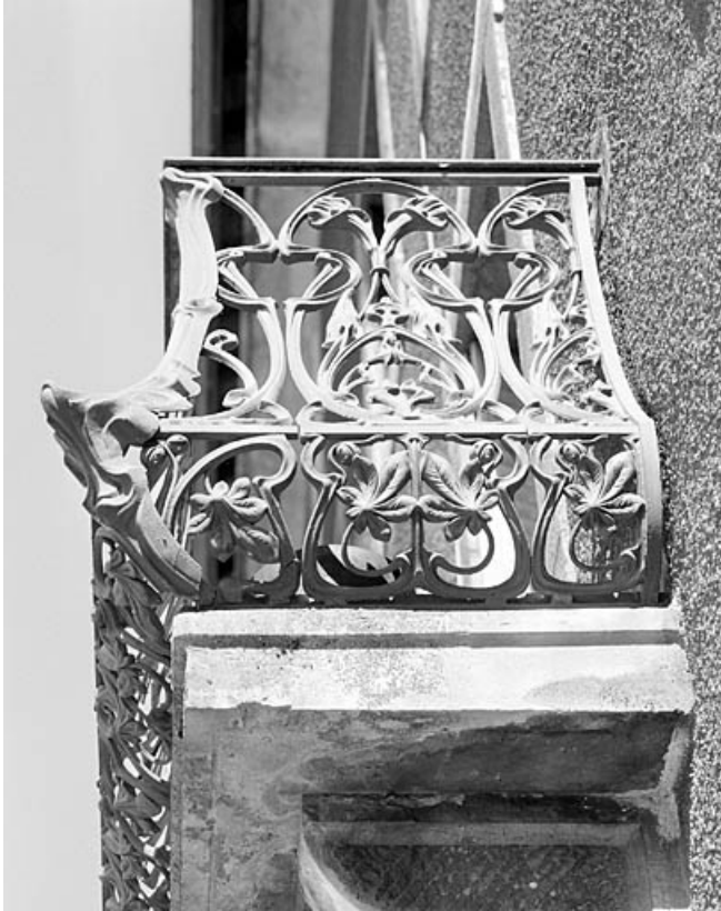
Balcon de l'immeuble : détail du garde-corps.