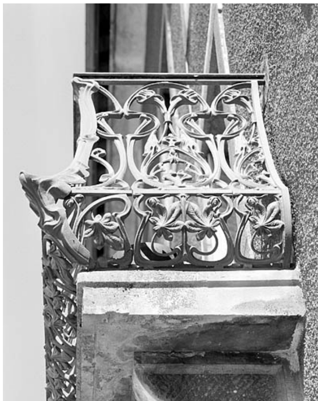
Balcon de l'immeuble : détail du garde-corps.