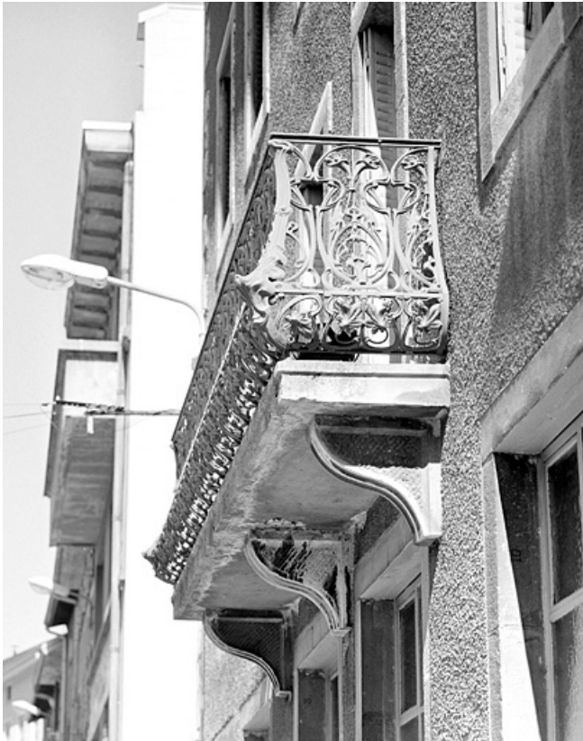
Balcon de l'immeuble, de profil.