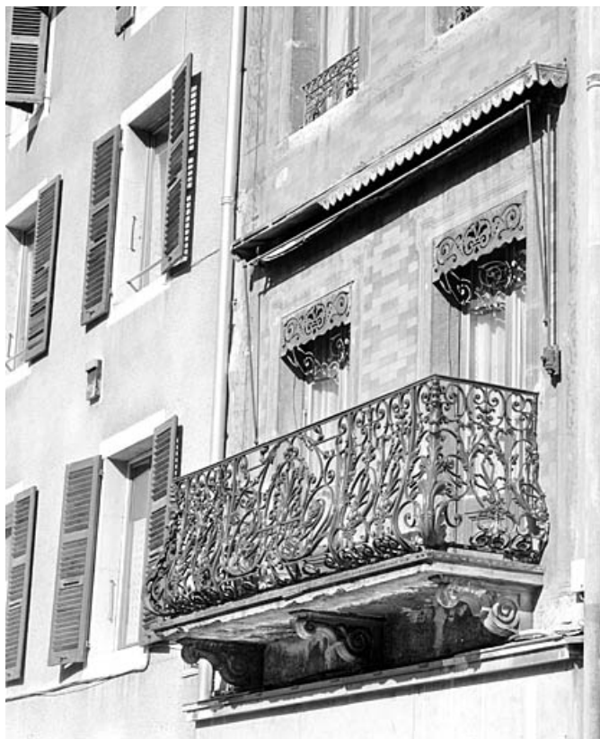
Balcon au premier étage.