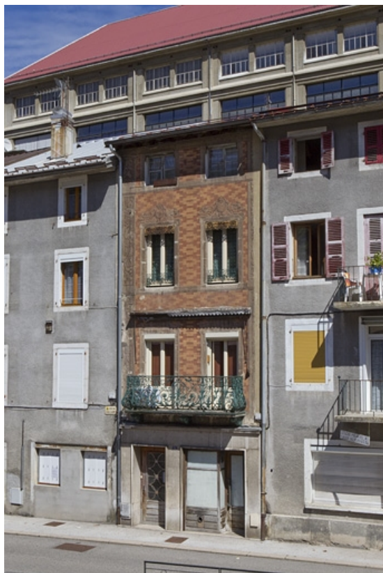
Elévation antérieure, de trois quarts droite.