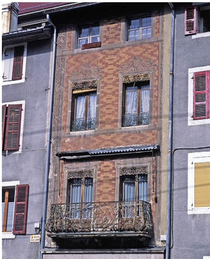
Elévation antérieure des étages.