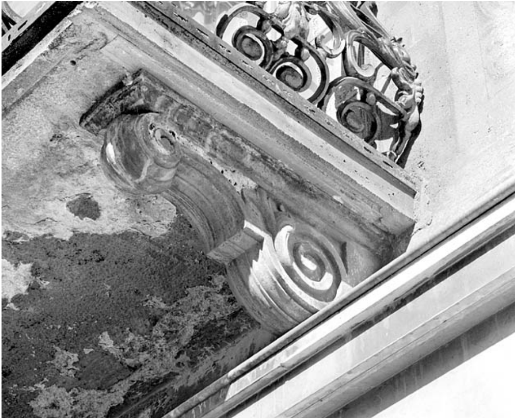
Balcon : détail d'une console.