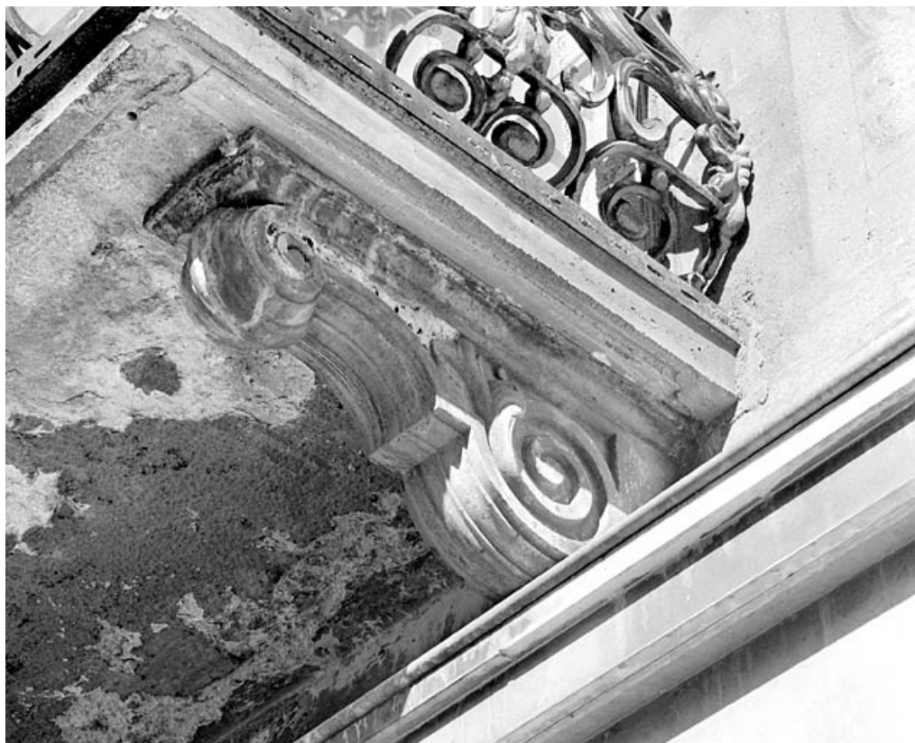
Balcon : détail d'une console.