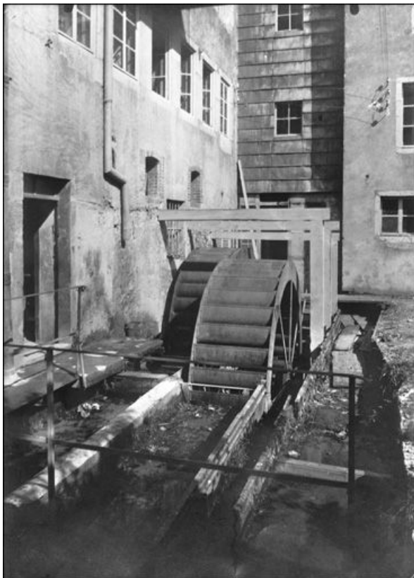
[Roues hydrauliques verticales côté cour], 2e moitié 20e siècle. 39, Morez, 19 à 23 rue du Docteur Regad