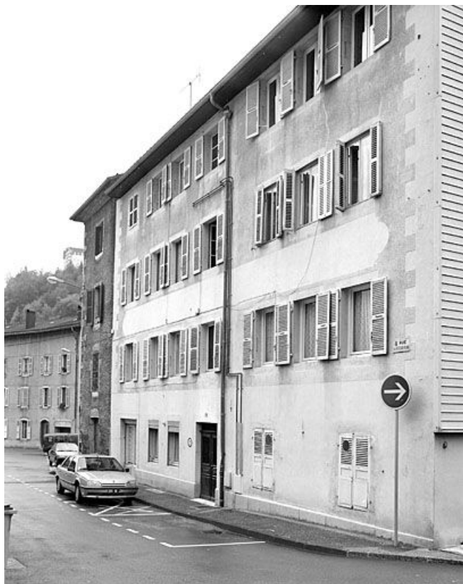
Bâtiment au n° 23 : élévation antérieure, de trois quarts droite. 39, Morez, 19 à 23 rue du Docteur Regad