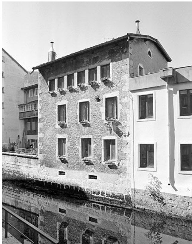
Bâtiment au n° 19, vu de l'est (façade sur la Bienne).