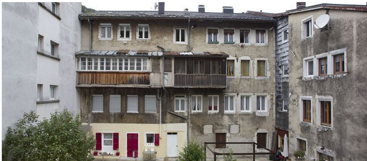
Bâtiments aux n° 19 et 23, vus de l'est (côté Bienne).