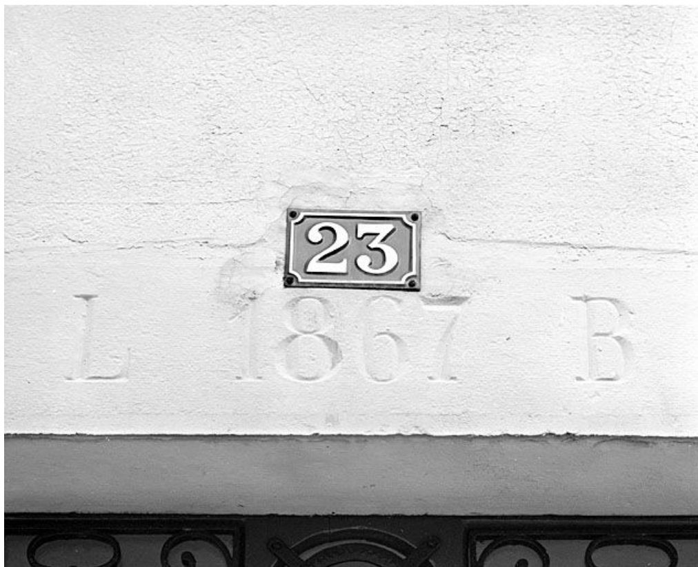
Bâtiment au n° 23 : date et initiales sur le linteau de l'entrée principale.