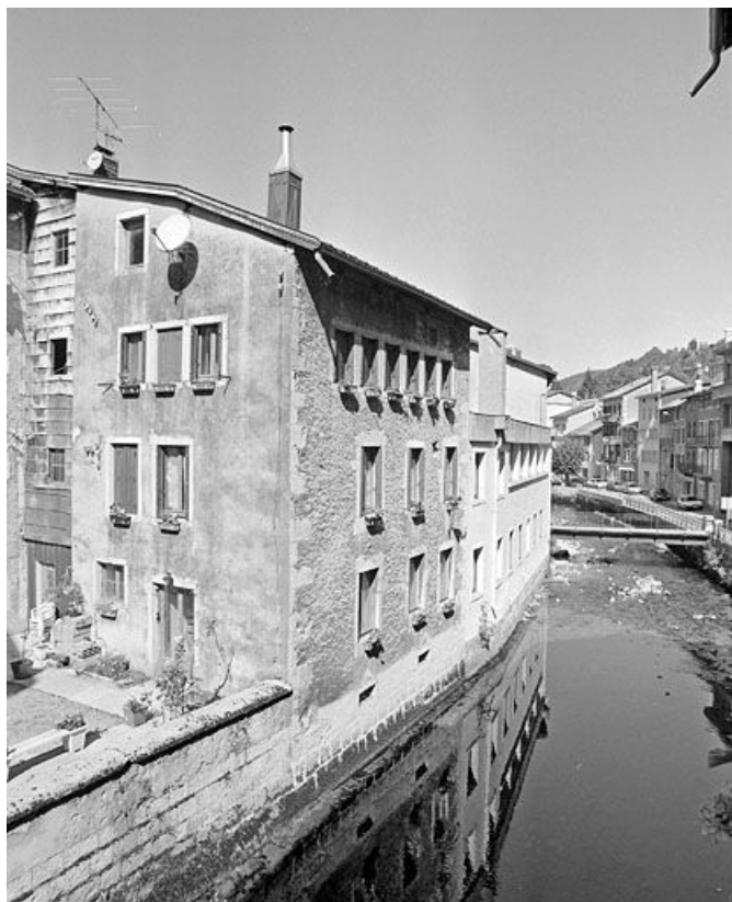
Bâtiment au n° 19, vu du sud-est (côté Bienne). 39, Morez, 19 à 23 rue du Docteur Regad