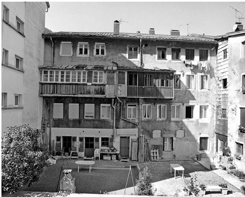
Ancien moulin à farine et martinet Clément (19 à 23 rue du Docteur Regad) : élévation côté Bienne. 39, Morez, 19 à 23 rue du Docteur Regad