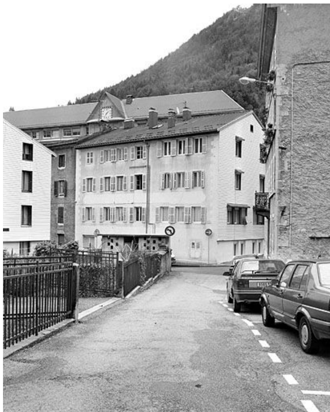
Vue d'ensemble, depuis le sud-ouest.