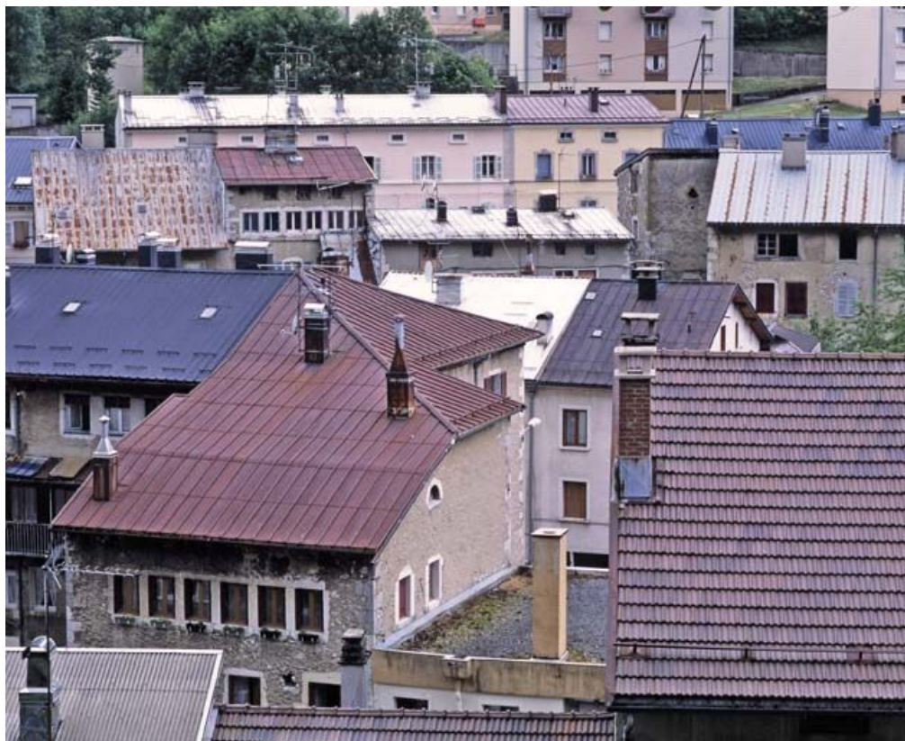
Bâtiment au n° 19 : vue plongeante sur le toit, depuis le nord-est.