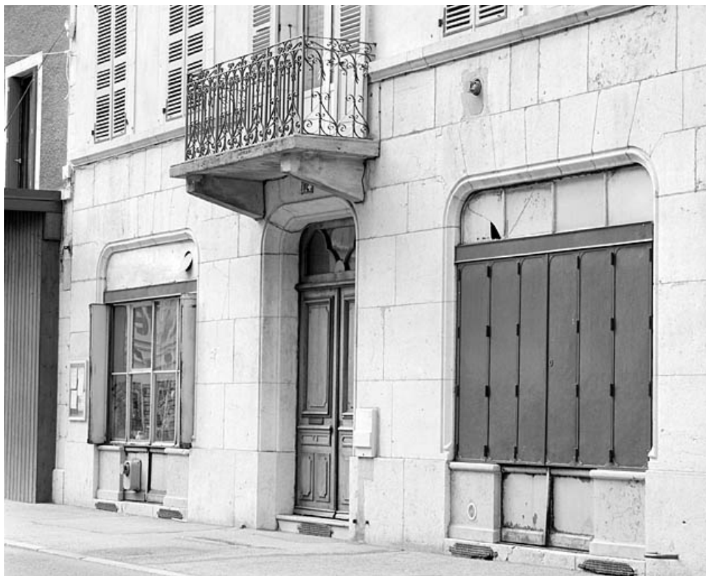
Rez-de-chaussée, de trois quarts droite.