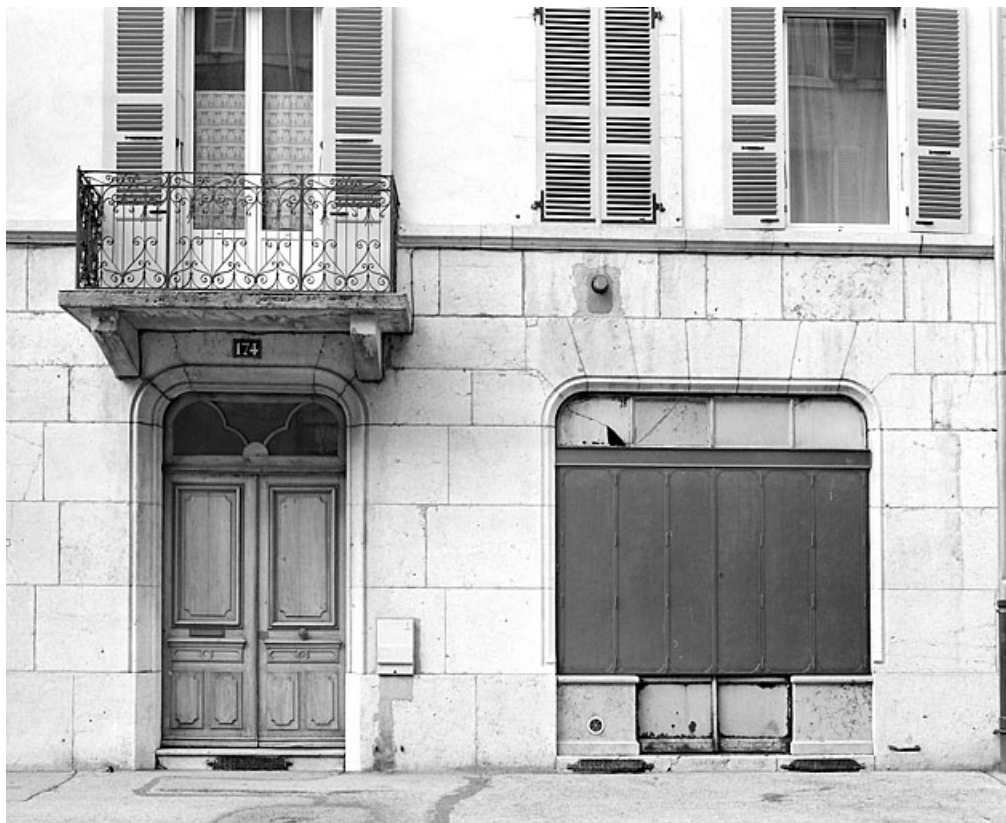
Entrée principale et boutique droite.