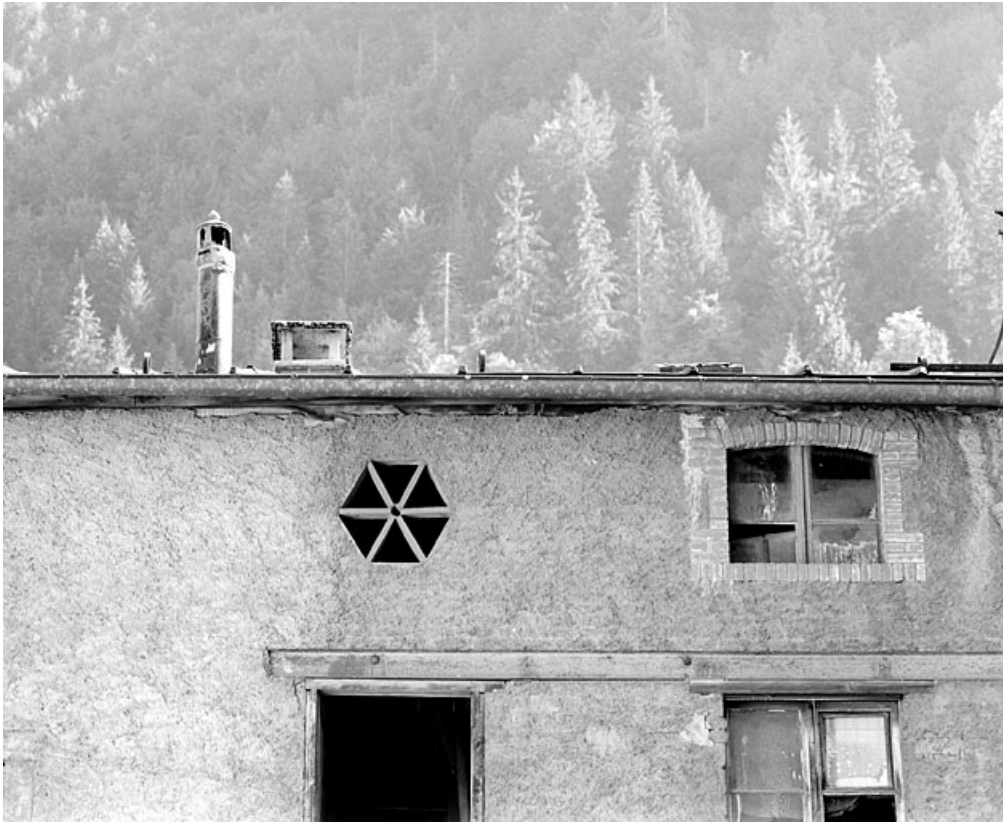
Bâtiment en fond de cour : baies de l'étage en surcroît.

39, Morez, 187, 189 rue de la République