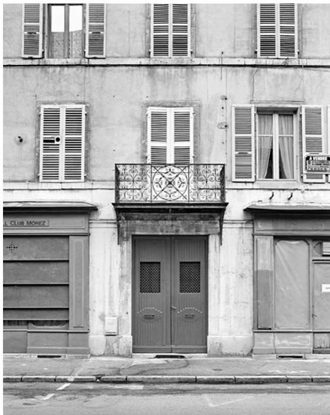
Entrée principale et porte-fenêtre du premier étage.

39, Morez, 187, 189 rue de la République