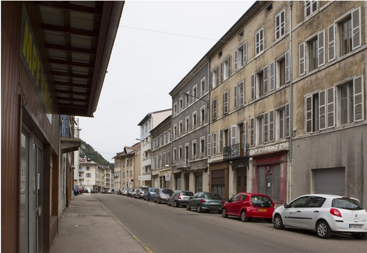
Élévation antérieure, de trois quarts droite.

39, Morez, 187, 189 rue de la République