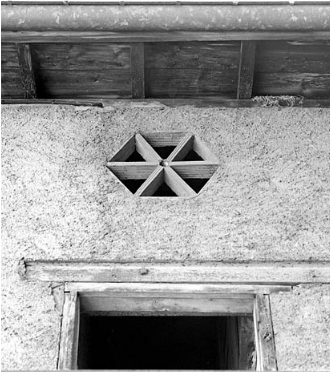
Bâtiment en fond de cour : oculus hexagonal.

39, Morez, 187, 189 rue de la République