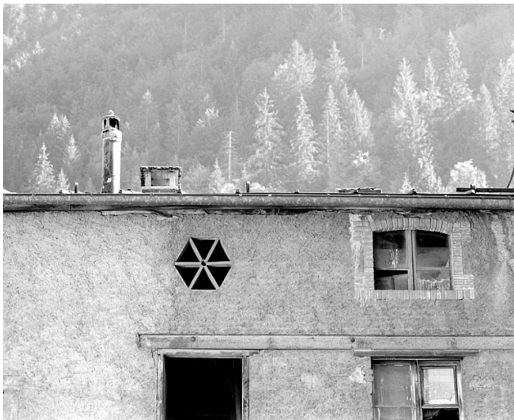
Bâtiment en fond de cour : baies de l'étage en surcroît.

39, Morez, 187, 189 rue de la République