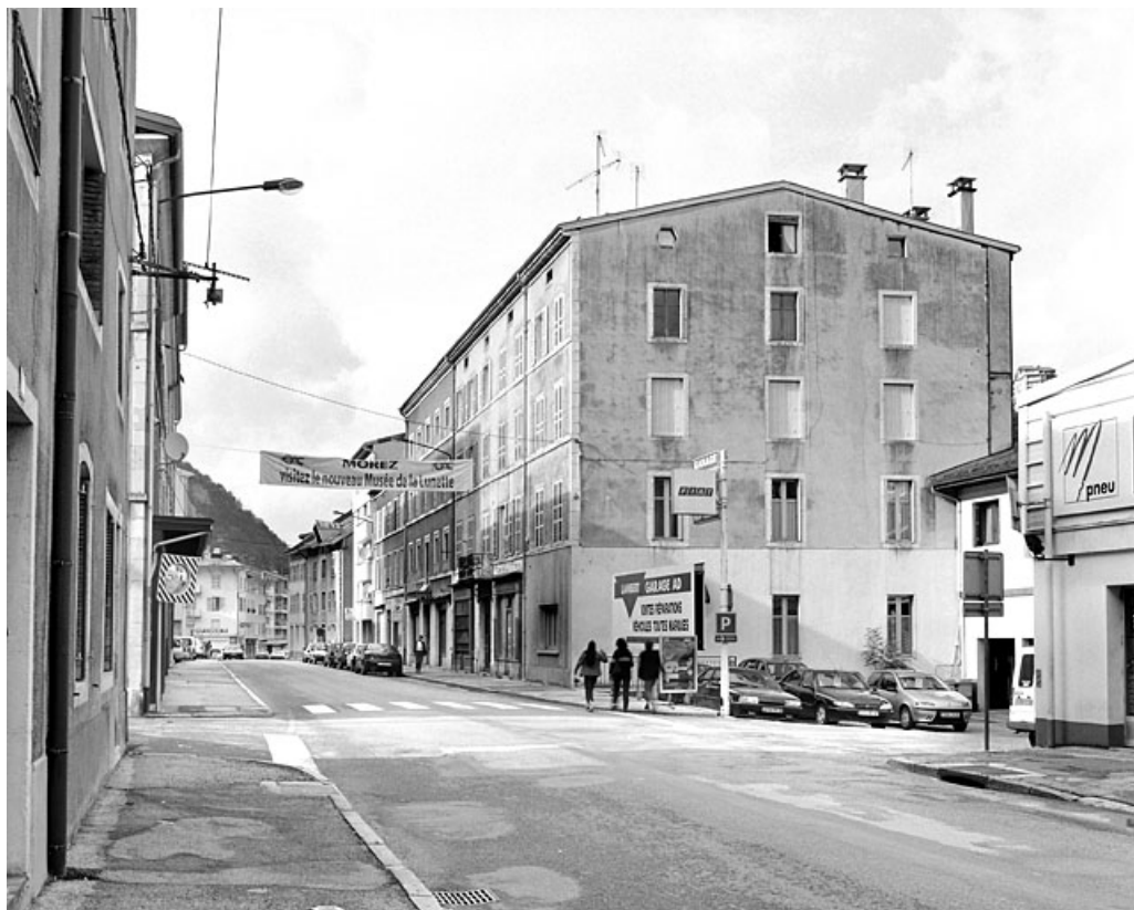
Vue d'ensemble, de trois quarts droite. 39, Morez, 187, 189 rue de la République