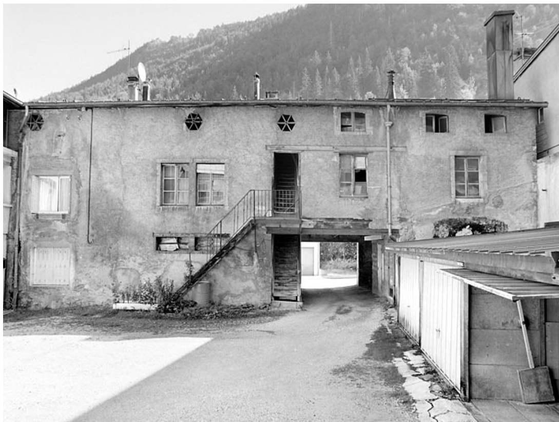
Bâtiment en fond de cour.

39, Morez, 187, 189 rue de la République