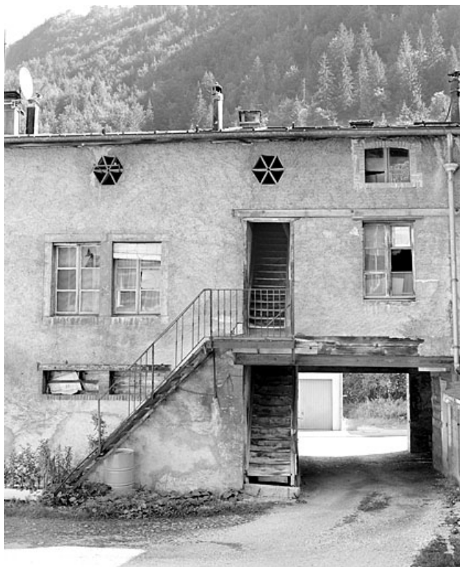
Bâtiment en fond de cour : passage couvert et escaliers.

39, Morez, 187, 189 rue de la République