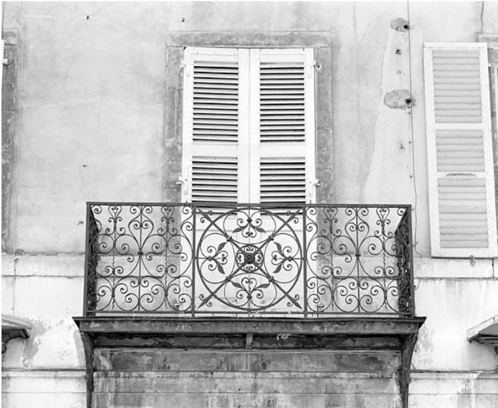
Porte-fenêtre du premier étage et balcon.

39, Morez, 187, 189 rue de la République