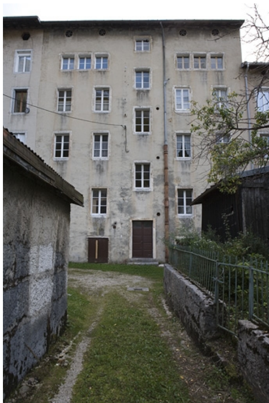
Vue d'ensemble depuis la rue Hyacinthe Caseaux.