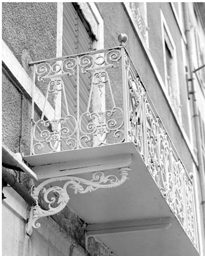
Balcon du premier étage : garde-corps et console.