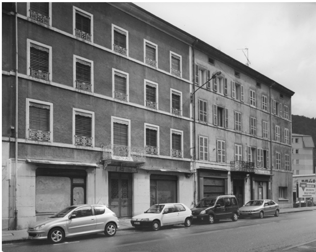
Vue d'ensemble des immeubles n° 185 à 189 rue de la République.