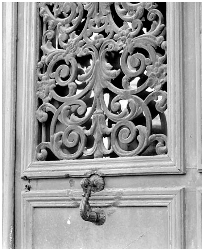
Entrée principale : détail de la grille d'un vantail.