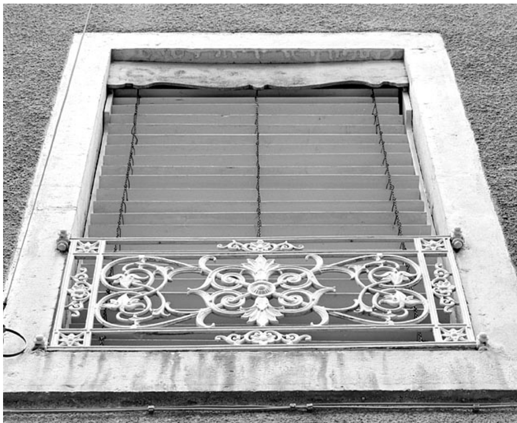
Fenêtre du premier étage et son garde-corps.