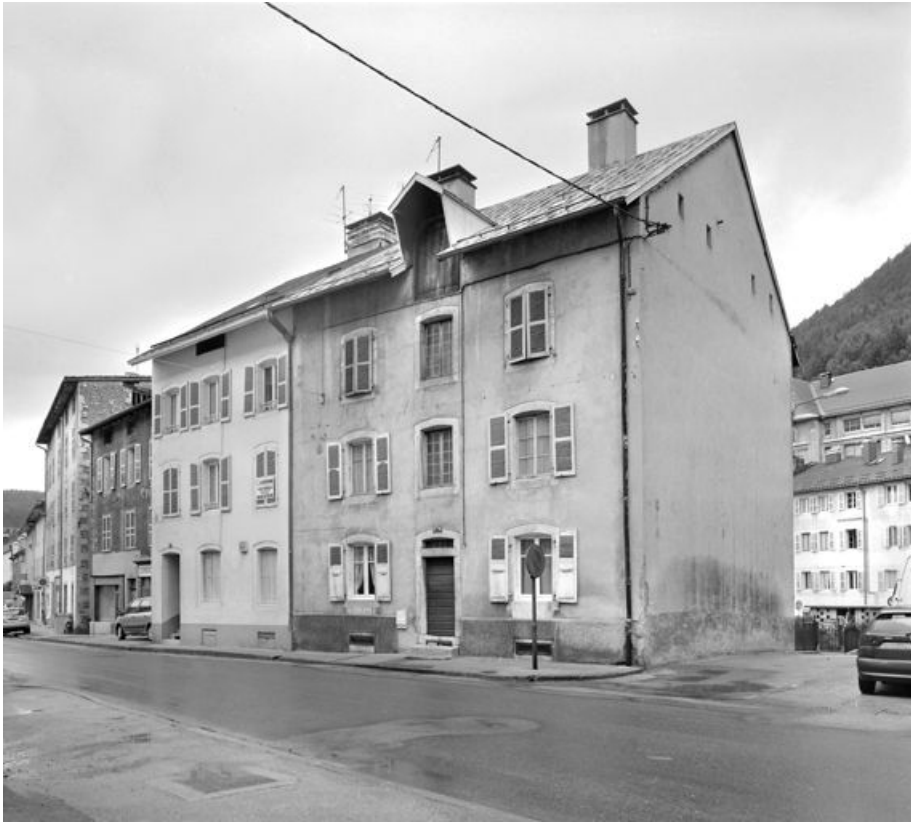
Maisons (18e siècle) aux n° 177 et 179 rue de la République.