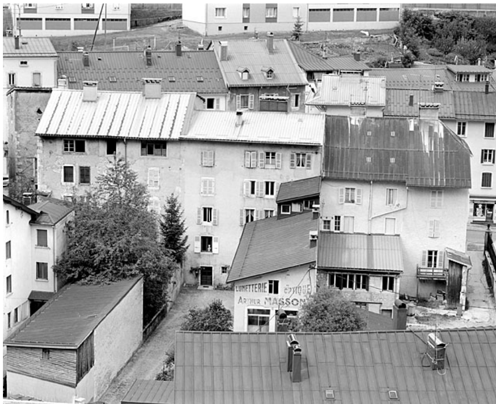
Vue plongeante sur la façade postérieure.