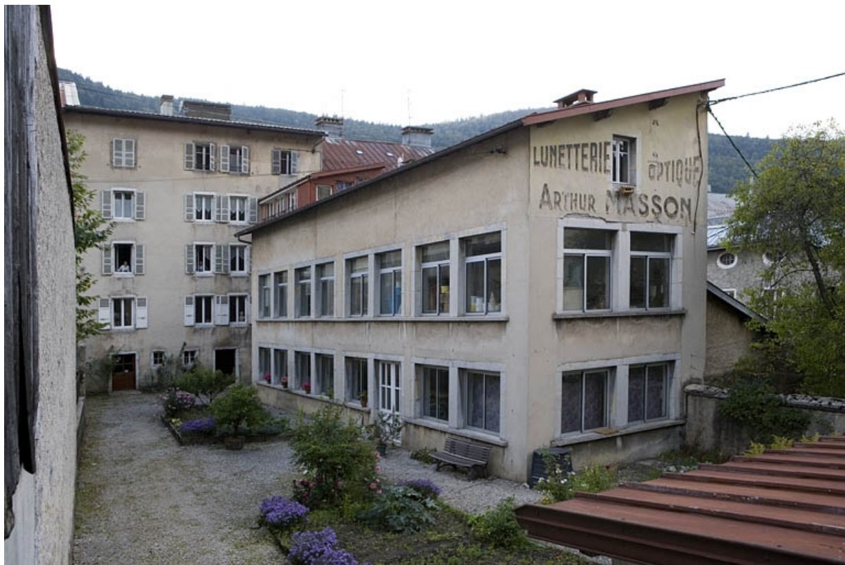
Cour et ateliers.