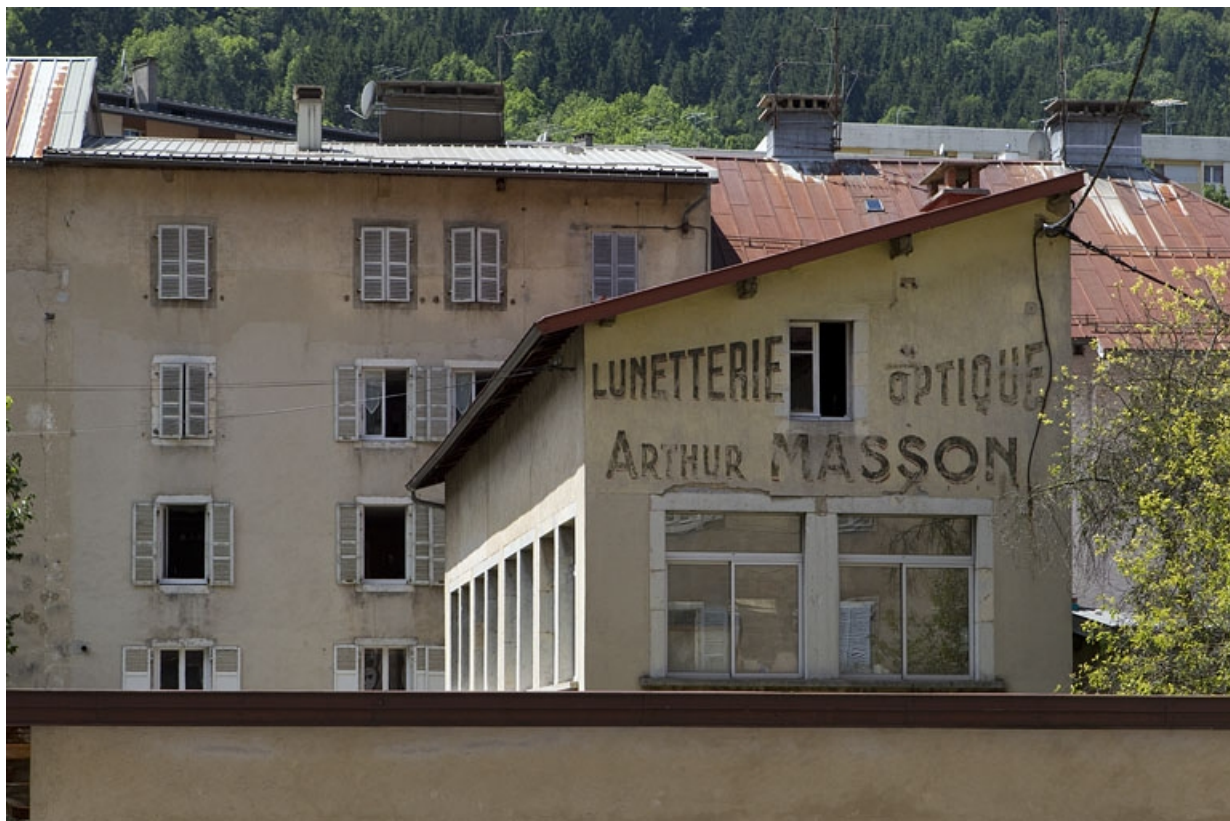
Ateliers : mur pignon oriental.