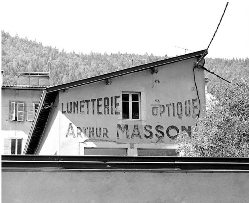
Ateliers : inscription sur le mur pignon oriental.