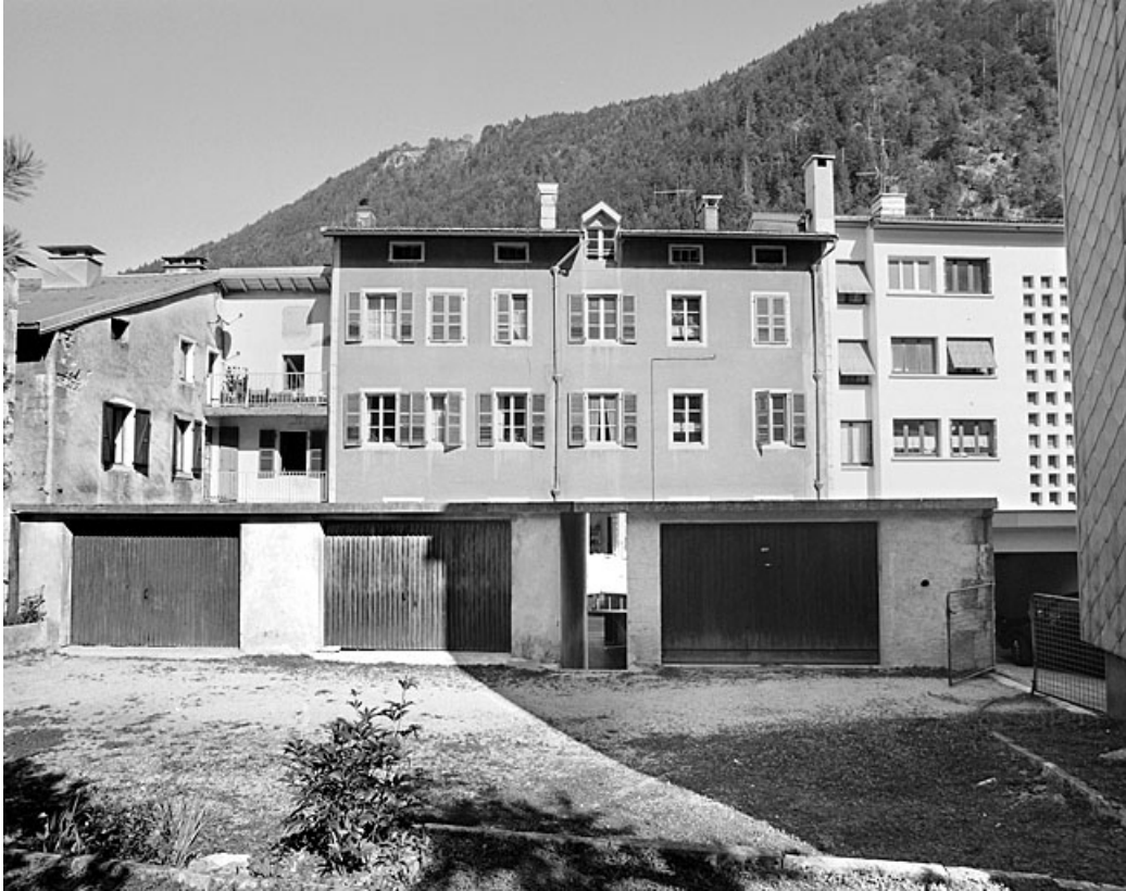
Elévation postérieure et garages.