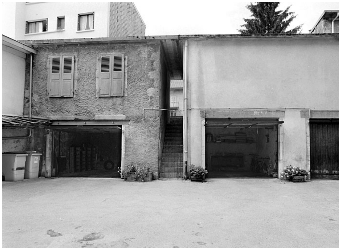
Elévation antérieure des garages.