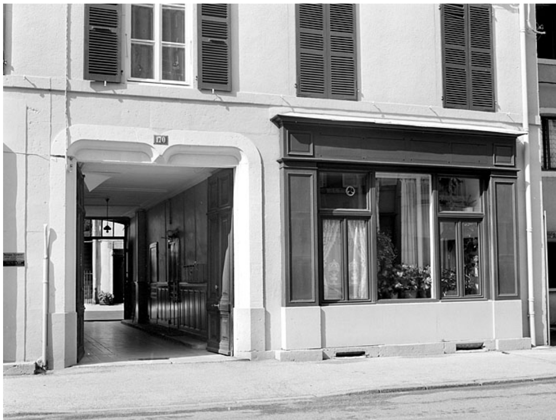
Entrée principale (passage couvert) et devanture d'une ancienne boutique. 39, Morez, 170 rue de la République