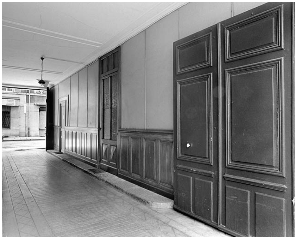
Intérieur du passage couvert, depuis la cour.