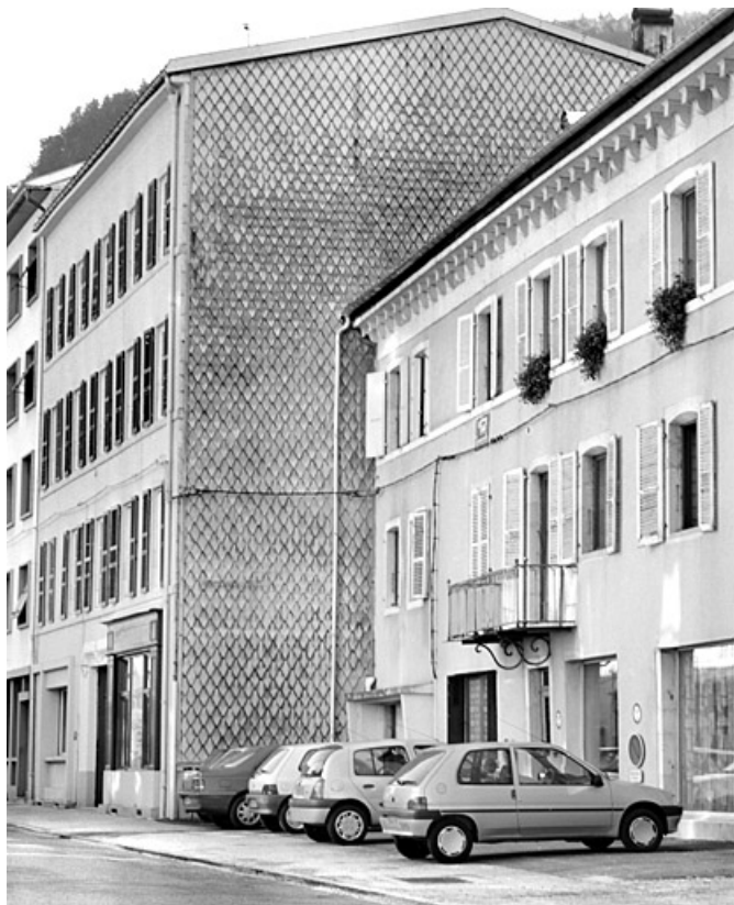
Elévations antérieure et latérale droite (nord).