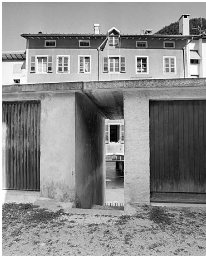
La cour vue depuis le haut de l'escalier des garages.