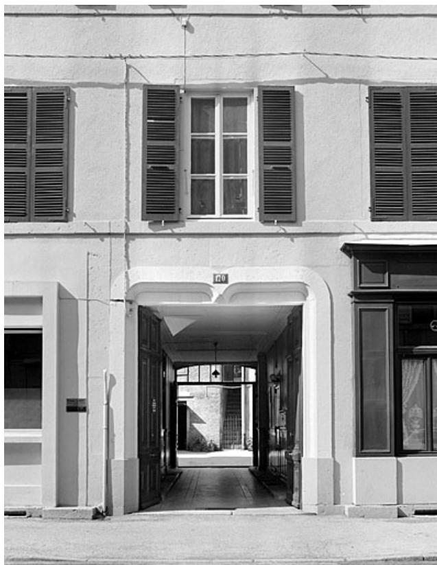
Entrée principale (passage couvert) et fenêtre du premier étage.