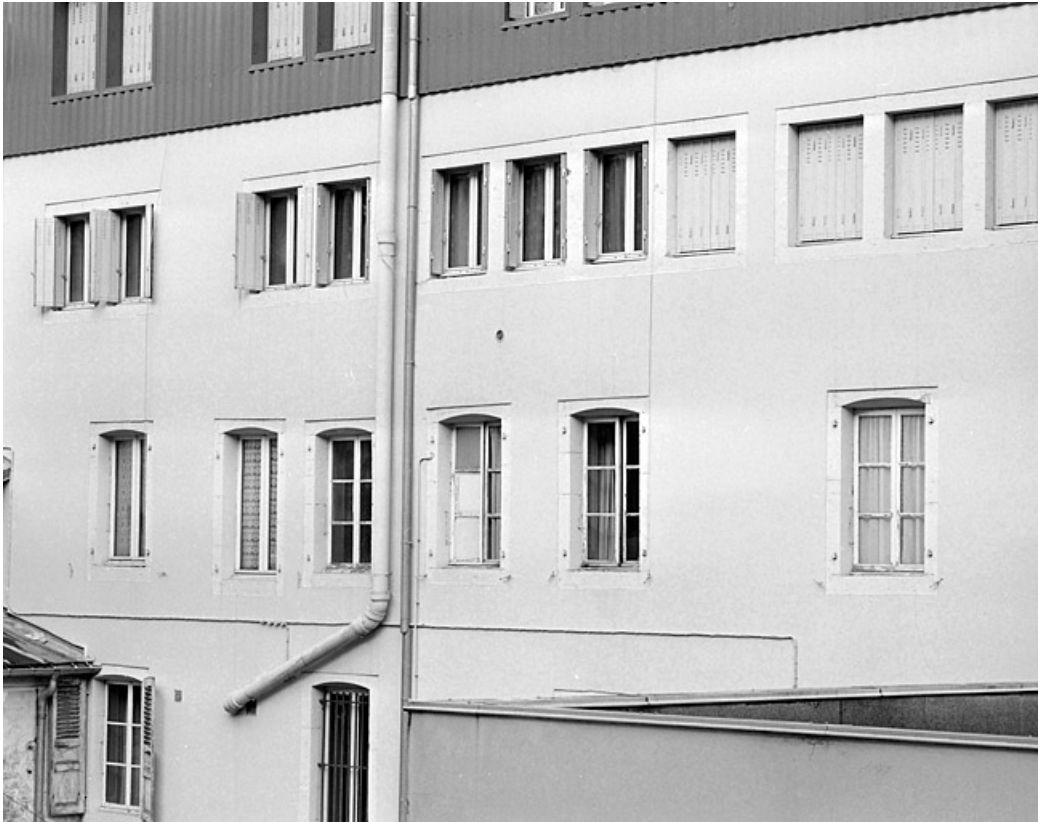
Elévation postérieure : fenêtres à linteau délardé en arc segmentaire du premier étage et fenêtres lunetières du deuxième. 39, Morez, 152 rue de la République