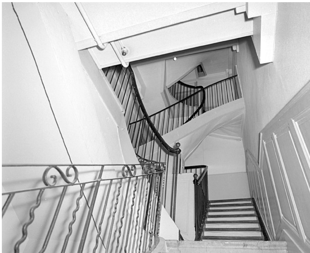
Escalier vu en contre-plongée vers le troisième étage.