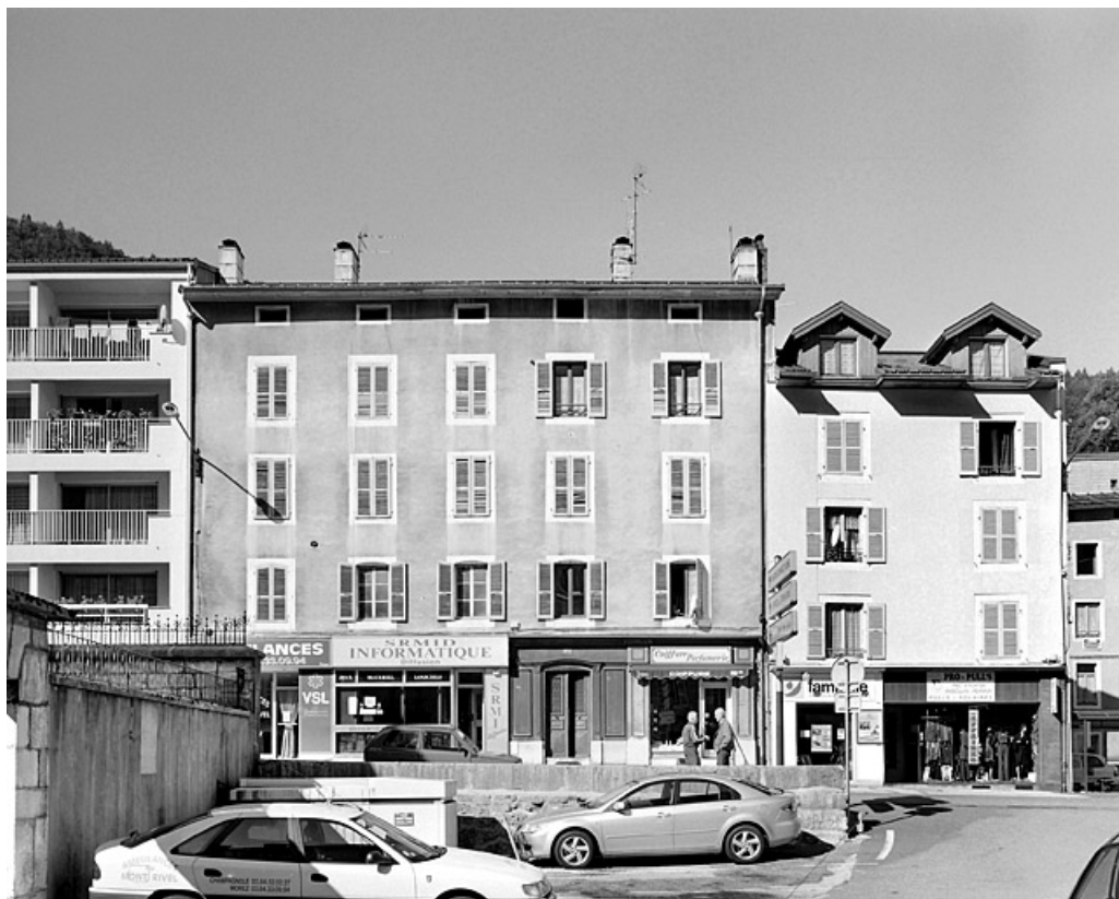
Vue d'ensemble de l'élévation antérieure.