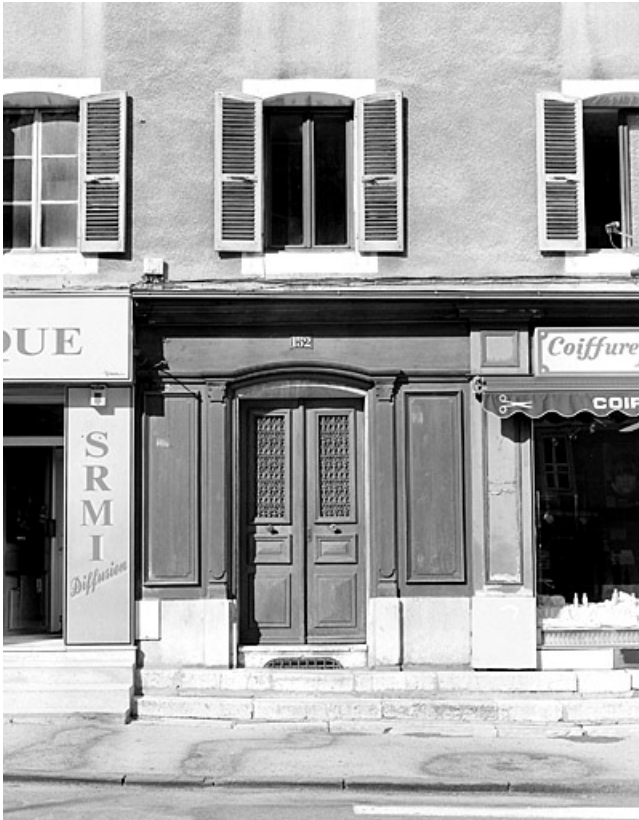
Élévation antérieure : porte principale et fenêtre du premier étage. Ces baies ont un linteau délardé en arc segmentaire. 39, Morez, 152 rue de la République