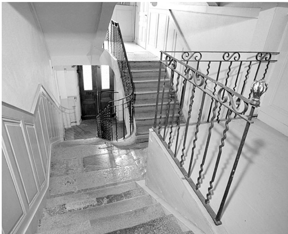
Escalier vu en plongée depuis le premier palier.