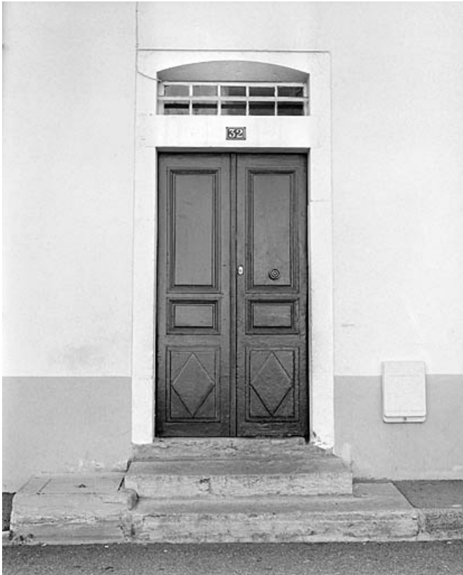
Maison au n° 32 : entrée principale.