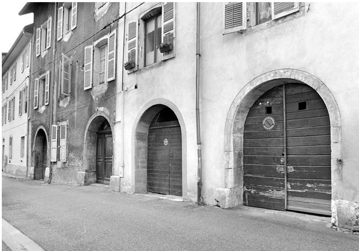
Maison au n° 30 : baies du rez-de-chaussée.