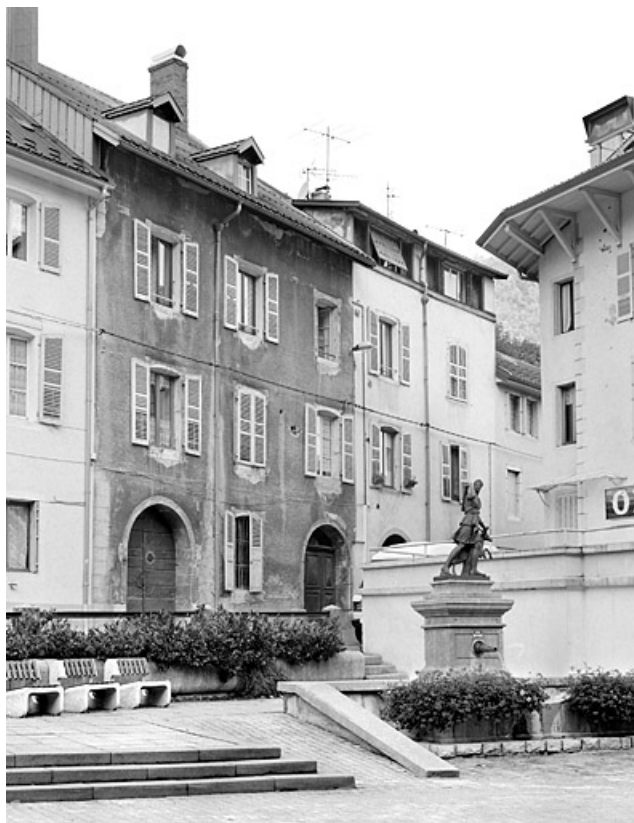
Maison au n° 30 : élévation antérieure, de trois quarts gauche. L'étage en surcroît est visible sur la partie droite du bâtiment (façade blanche).