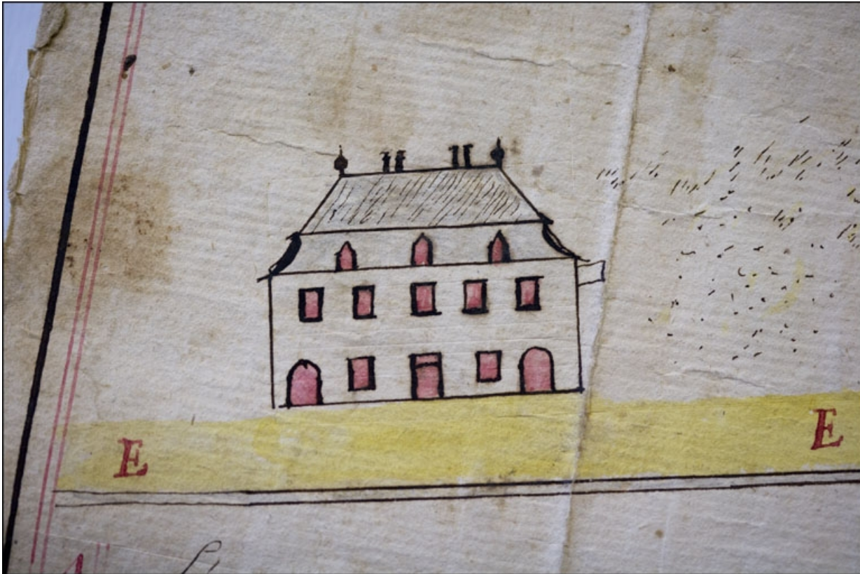
Plan d'un chemin qui conduit à l'Eglise de Morez contester par les Srs Couchet du mame lieux [... Détail], 1777. 39, Morez, 30, 32 rue Victor Hugo