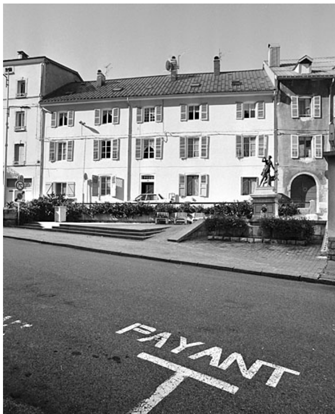
Maison au n° 32 : façade antérieure.