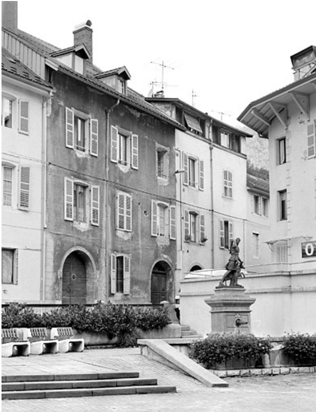
Maison au n° 30 : élévation antérieure, de trois quarts gauche. L'étage en surcroît est visible sur la partie droite du bâtiment (façade blanche).