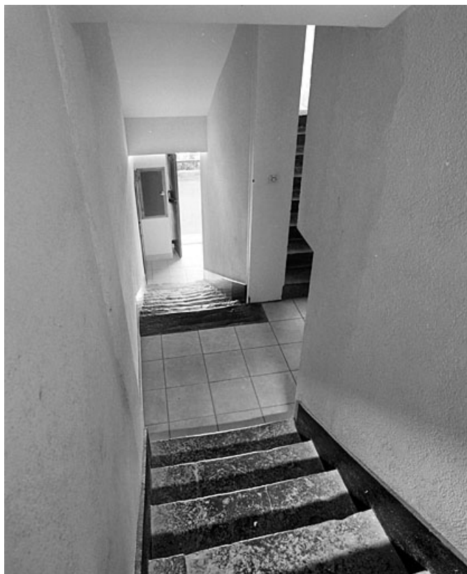
Maison au n° 32 : escalier.