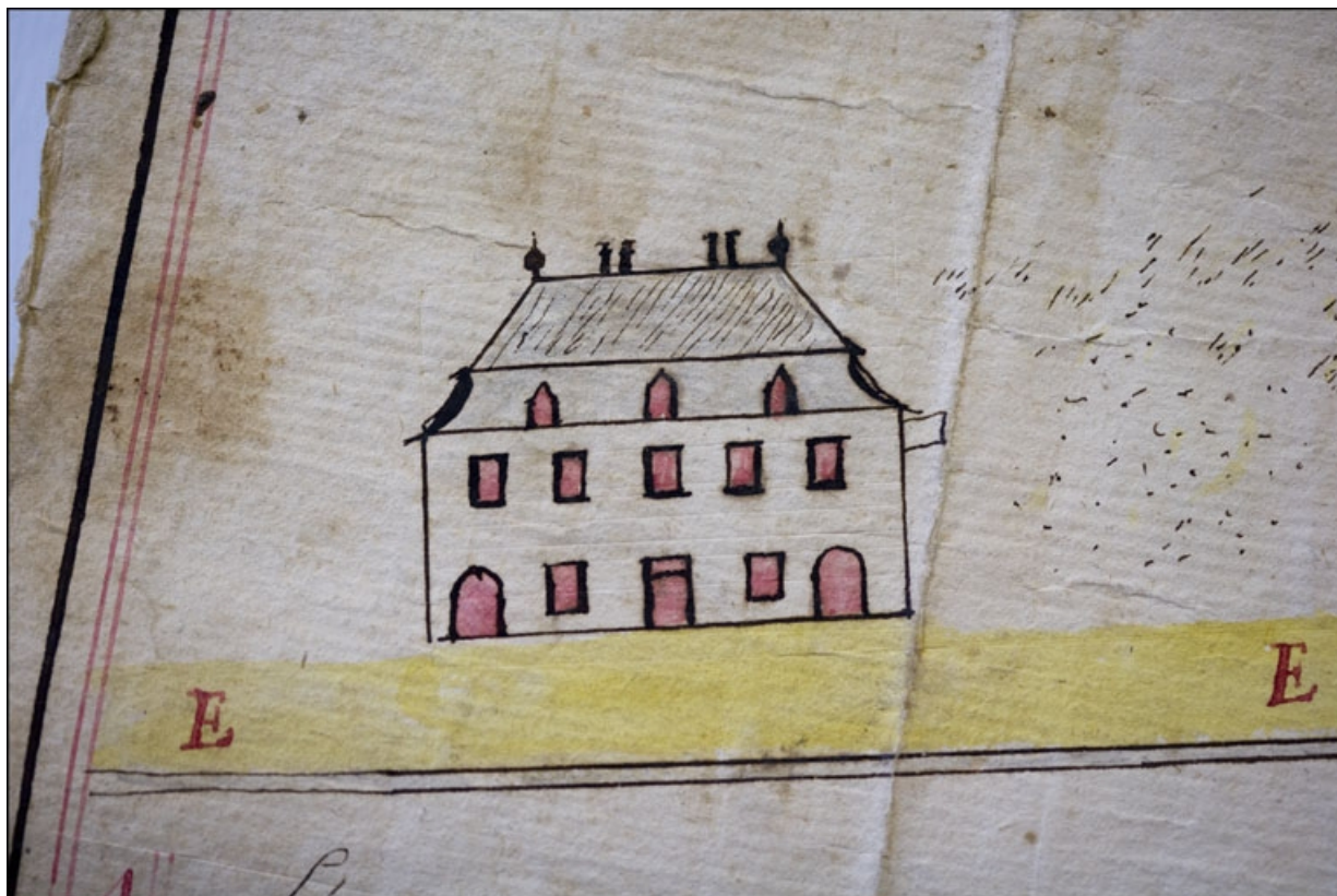
Plan d'un chemin qui conduit à l'Eglise de Morez contester par les Srs Couchet du maimie lieux [... Détail], 1777. 39, Morez, 30, 32 rue Victor Hugo