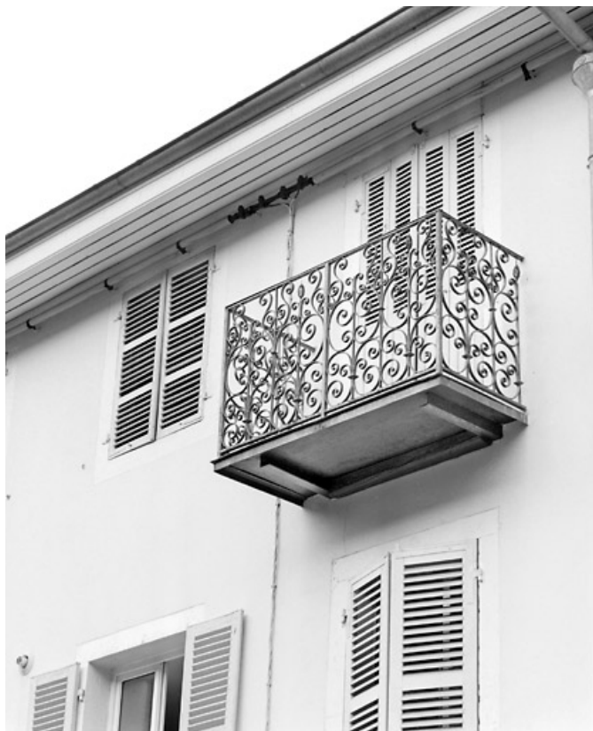
Façade antérieure : balcon du deuxième étage, de trois quarts. 39, Morez, 5 rue Pasteur