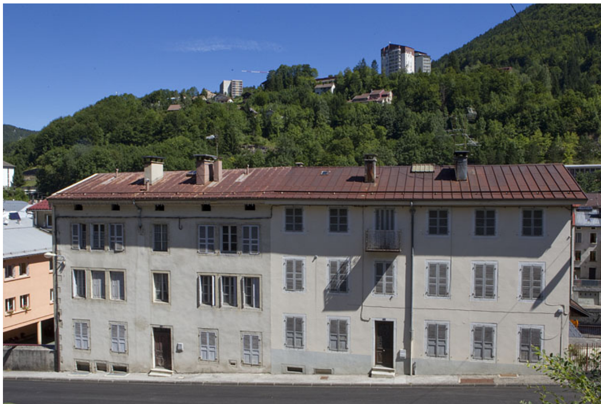
Façade antérieure. Le n° 5 rue Pasteur est à droite (et le n° 3 à gauche). 39, Morez, 5 rue Pasteur