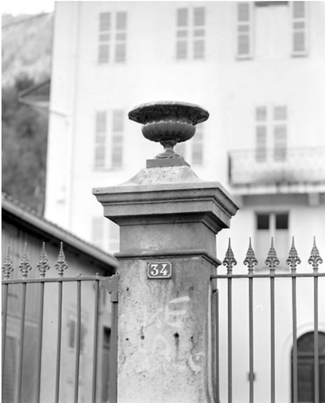
Clôture sur le quai Jobez : pilier droit et vase.