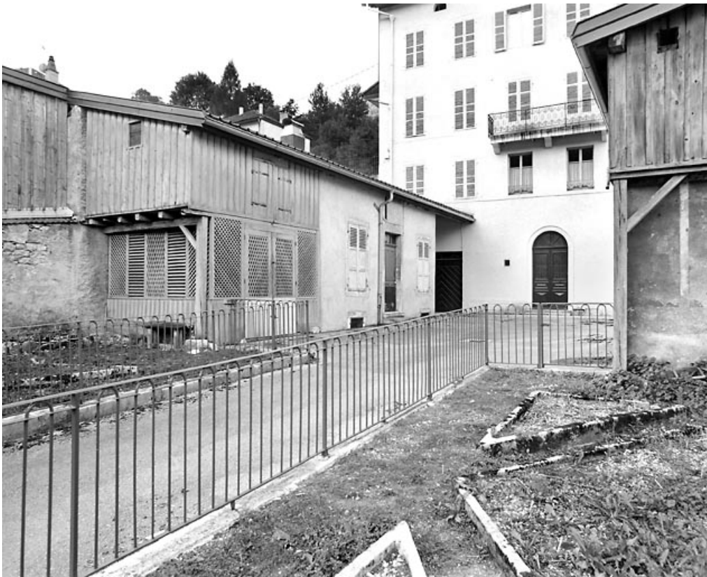
Jardin, cour et bâtiment sud.