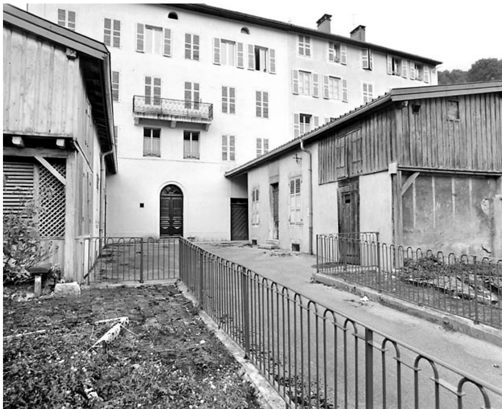
Jardin, cour et bâtiment nord.