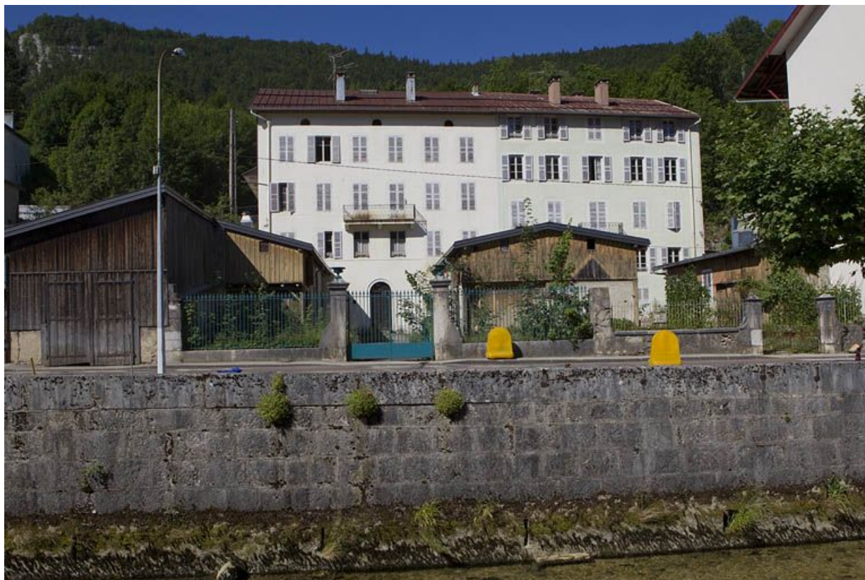
Immeubles (19e siècle) aux n° 3 et 5 rue Pasteur : élévation postérieure (donnant sur les n° 30 à 34 quai Jobez). Immeubles (AI 20 et 21) bâtis vers 1875. Celui de droite (au n° 3) comptait un atelier.