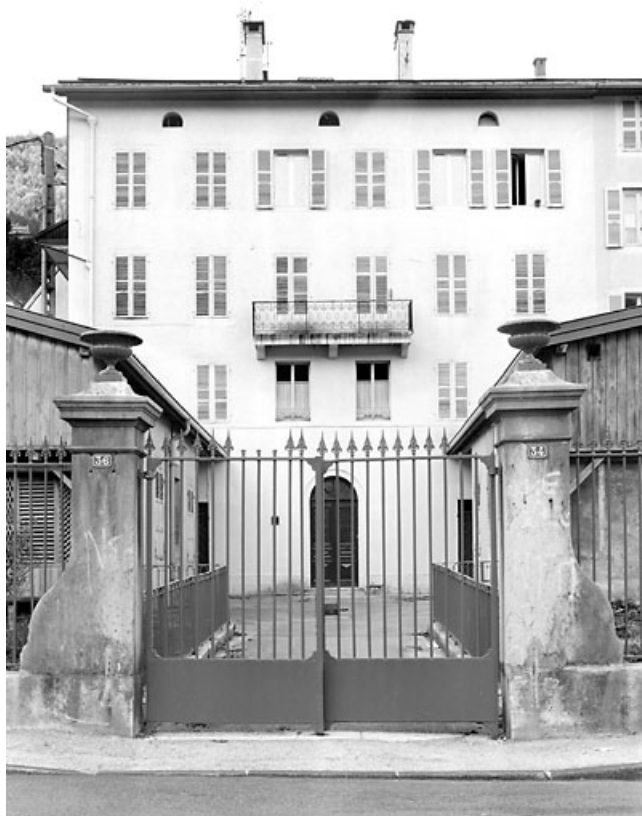
Façade postérieure (vue verticale).