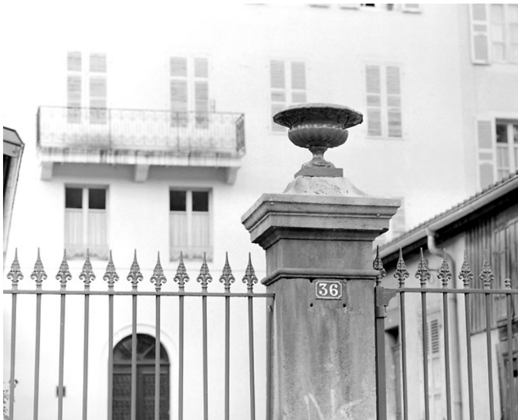
Clôture sur le quai Jobez : pilier gauche et vase.