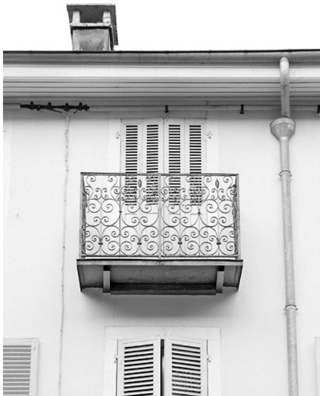
Façade antérieure : balcon du deuxième étage.