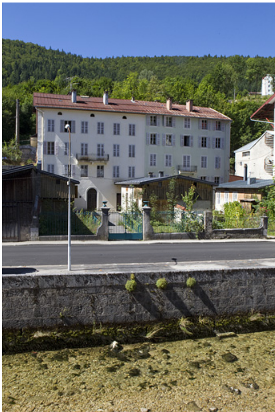
Vue d'ensemble, depuis l'est. Le n° 5 rue Pasteur est à gauche (et le n° 3 à droite). 39, Morez, 5 rue Pasteur