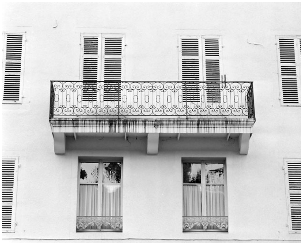
Façade postérieure : balcon.