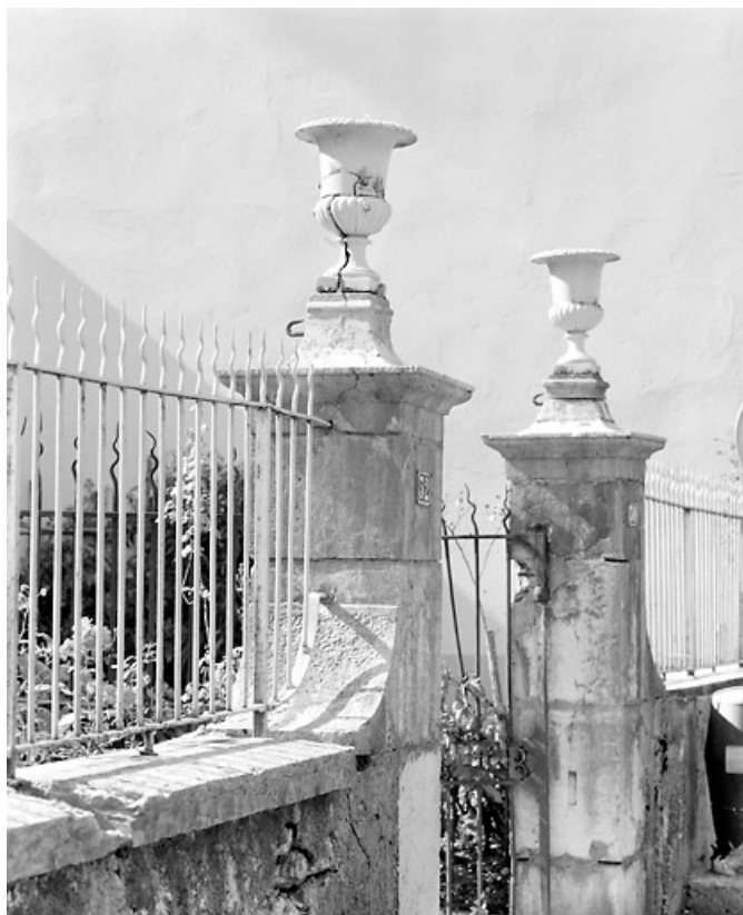
Clôture sur le quai Jobez : piliers et vases.