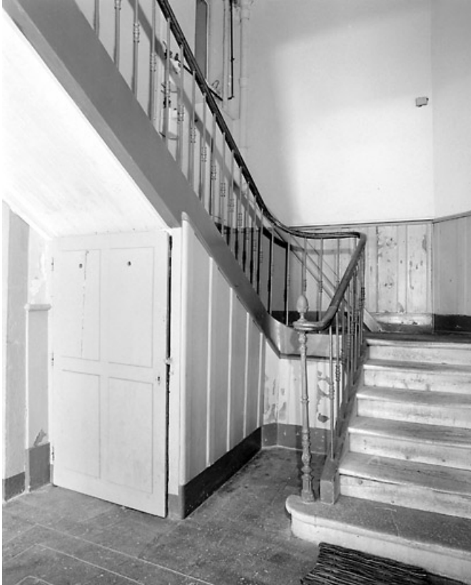
Départ de l'escalier au deuxième étage de soubassement.