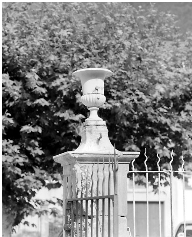
Clôture sur le quai Jobez : un vase.