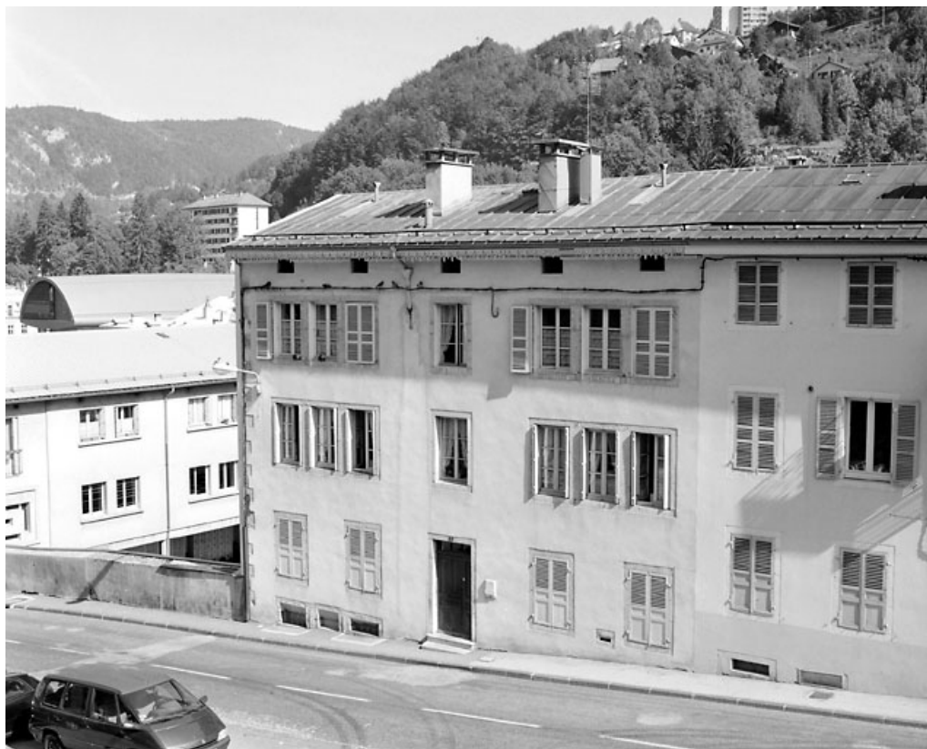
Façade antérieure, de trois quarts droite.