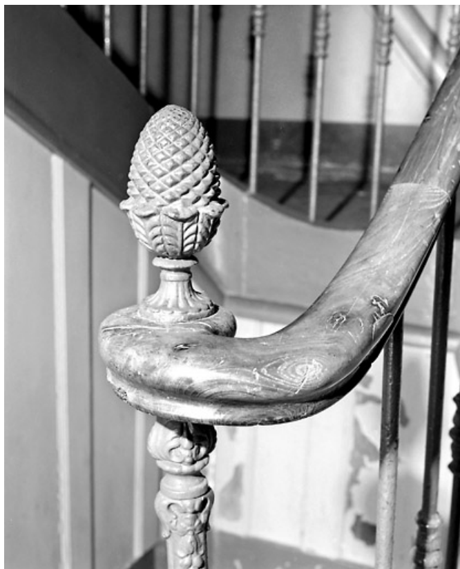
Rampe d'escalier : motif en forme de pomme de pin.