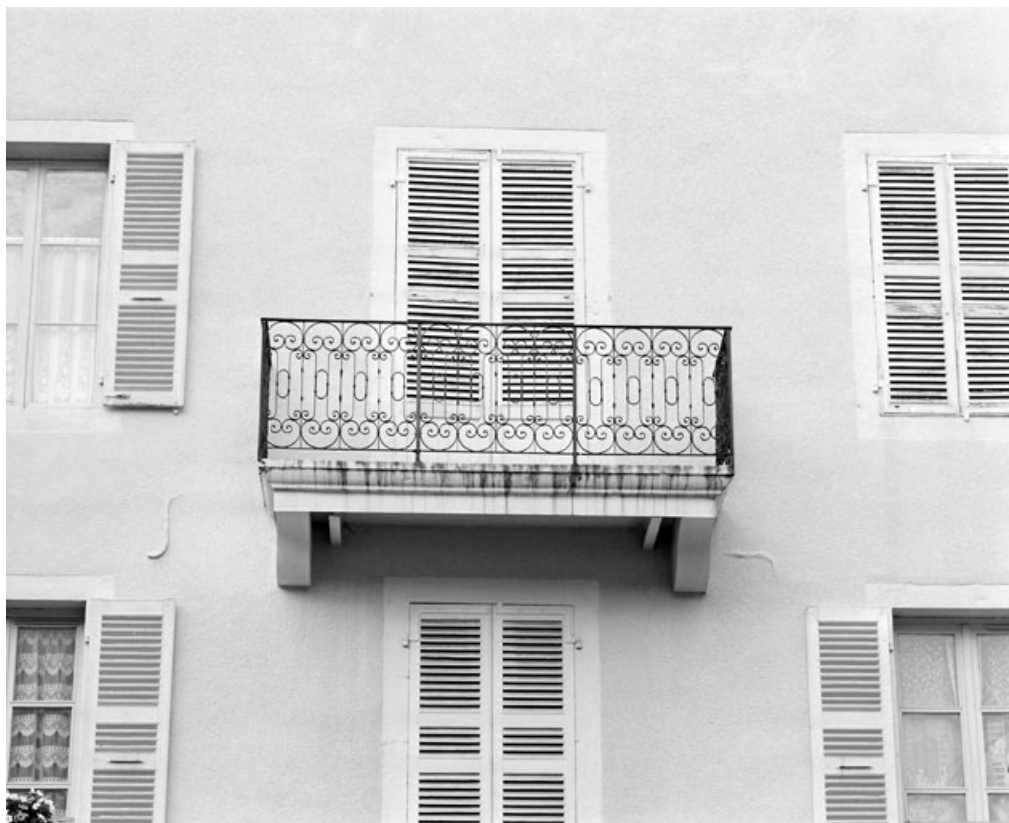
Façade postérieure : balcon. Correspond au rez-de-chaussée sur la rue Pasteur. 39, Morez, 3 rue Pasteur