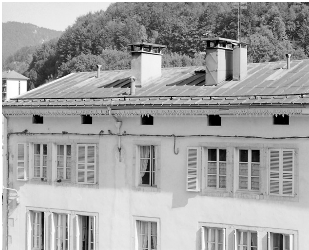
Façade antérieure : fenêtres jumelées aux étages.