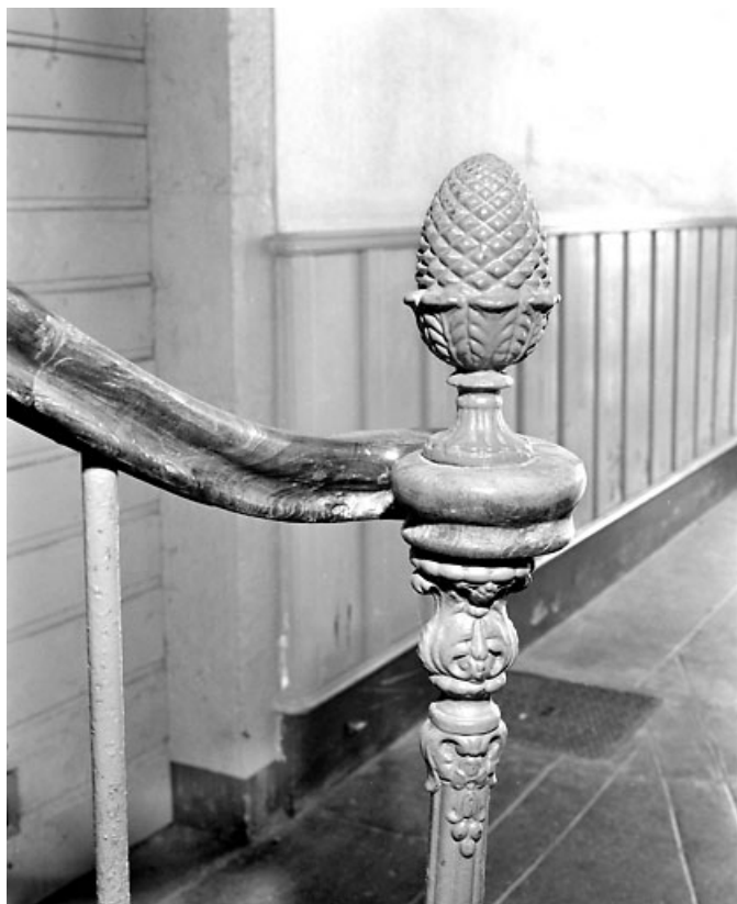
Rampe d'escalier : motif en forme de pomme de pin.