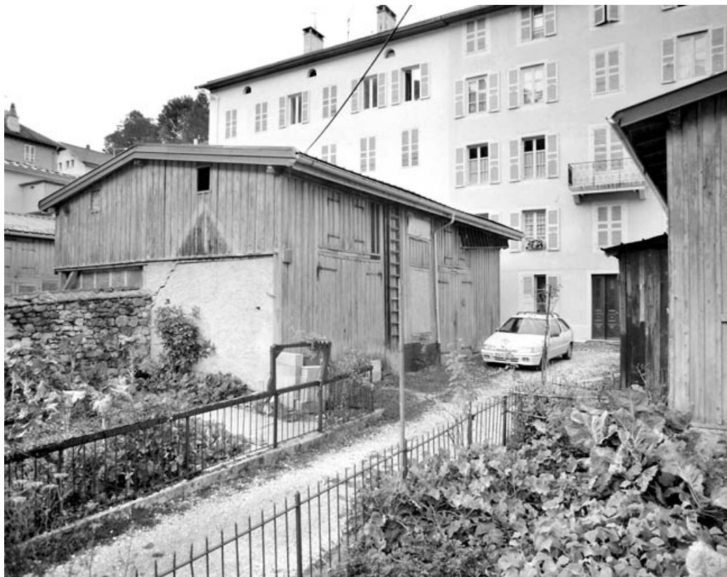
Bâtiment sud : bûcher et garage.