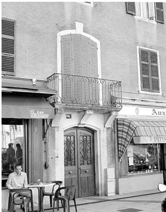
Porte principale et porte-fenêtre du premier étage, de trois quarts gauche.