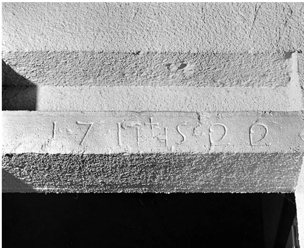
Date sur le linteau d'une porte de l'élévation postérieure.