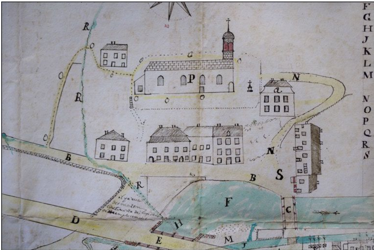
Plan [du moulin Chavin et du quartier de la place du Marché] fait par Pierre Augustin Roche de Morez [détail], 1782. 39, Morez, 4 place Henri Lissac