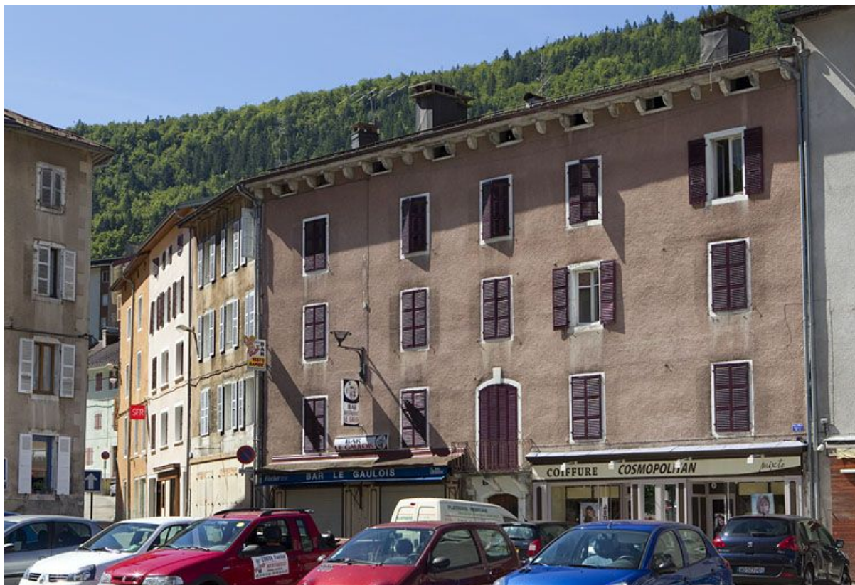
Vue d'ensemble, de trois quarts droite.