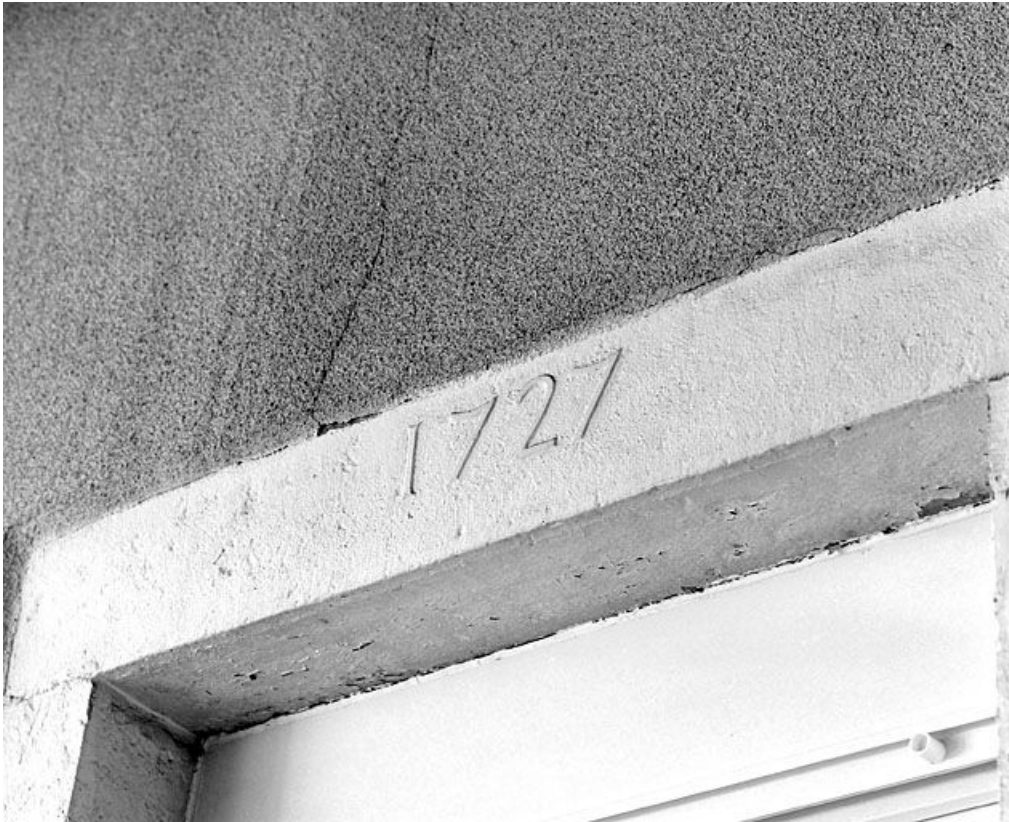
Date portée sur le linteau d'une fenêtre du second étage.