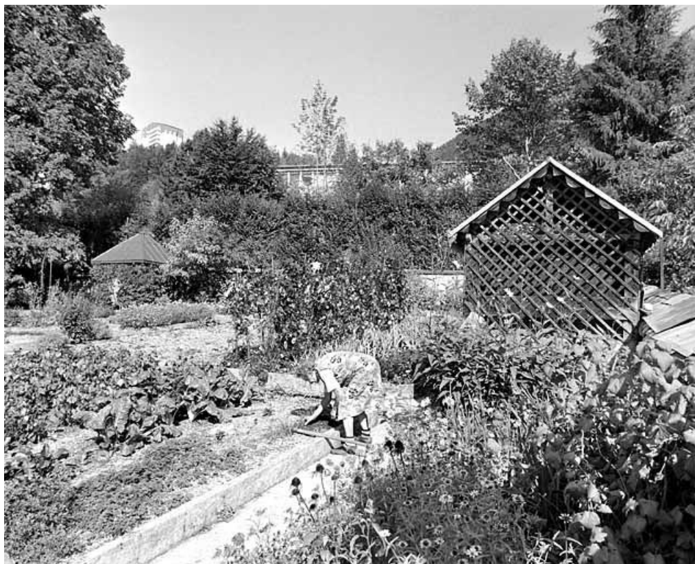
Jardin et fabrique de treillage.