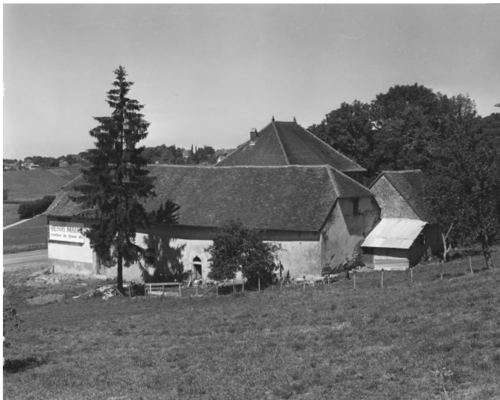
Vue générale depuis le sud.