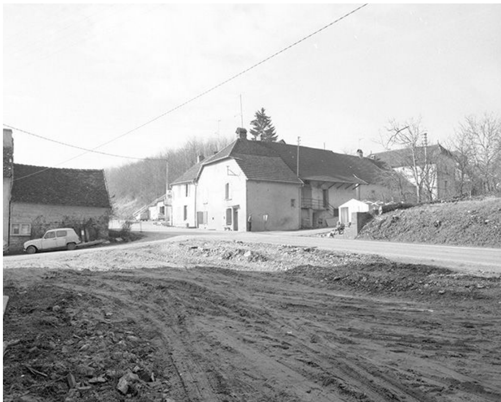
Lieudit Montchauvrot : vue prise au cours des travaux routiers de l'hiver 1974-1975. 39, Mantry