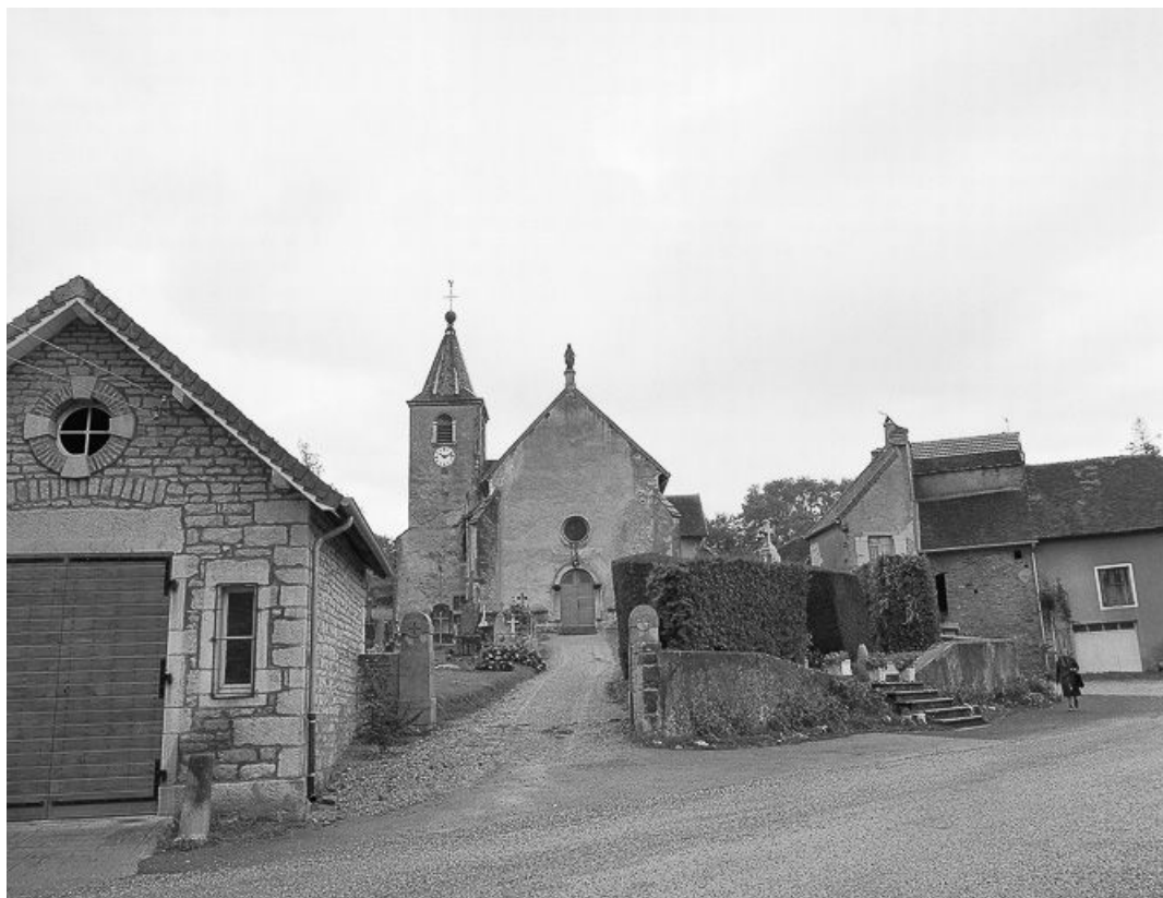
Façade antérieure depuis l'entrée du cimetière. 39, Mantry