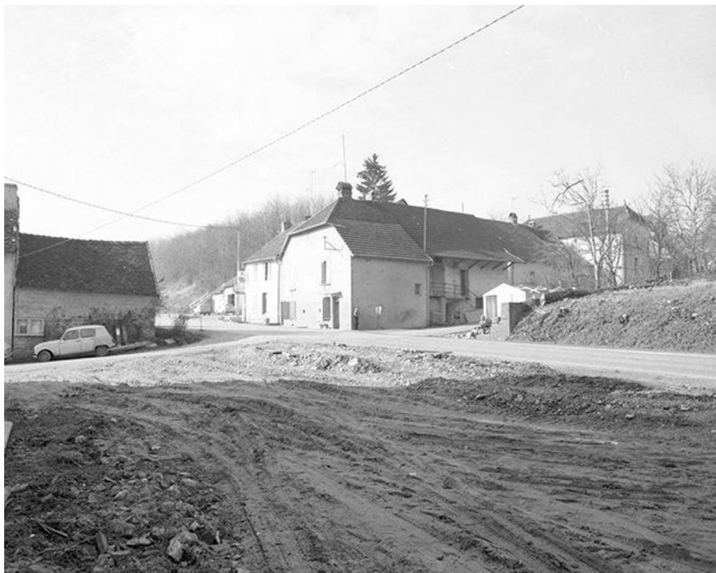
Lieudit Montchauvrot : vue prise au cours des travaux routiers de l'hiver 1974-1975. 39, Mantry