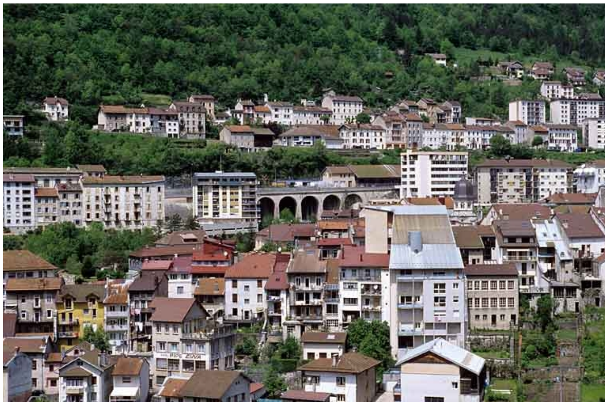
Vue d'ensemble, depuis le sud-est.