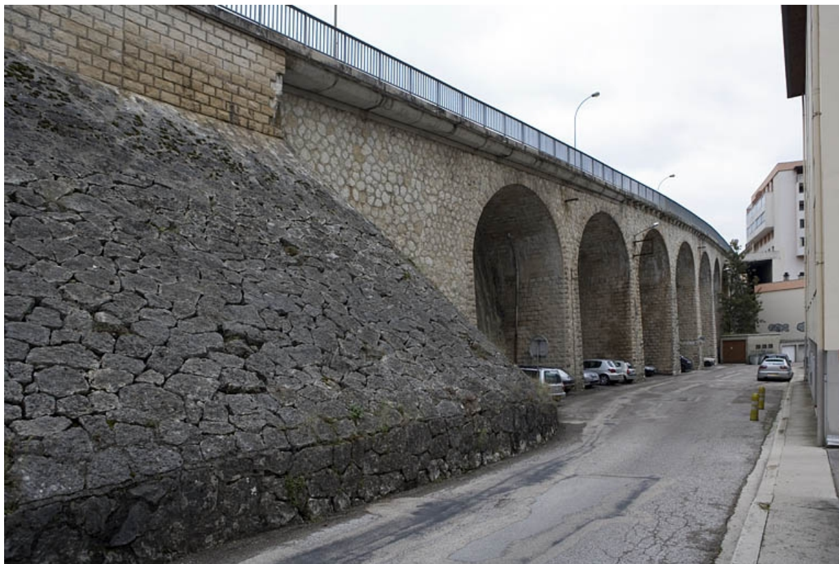
Vue d'ensemble, de trois quarts gauche. 39, Saint-Claude rue du Miroir