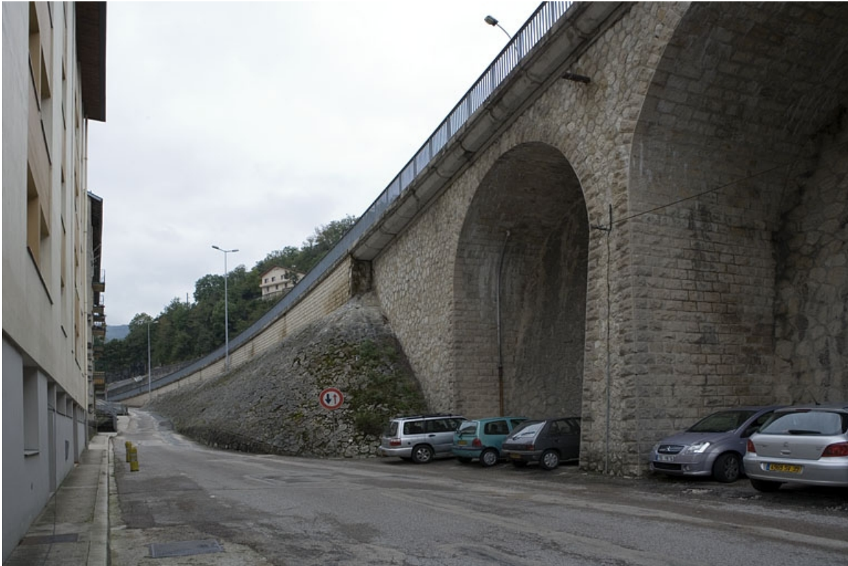
Jonction entre le perré et la première arcade.