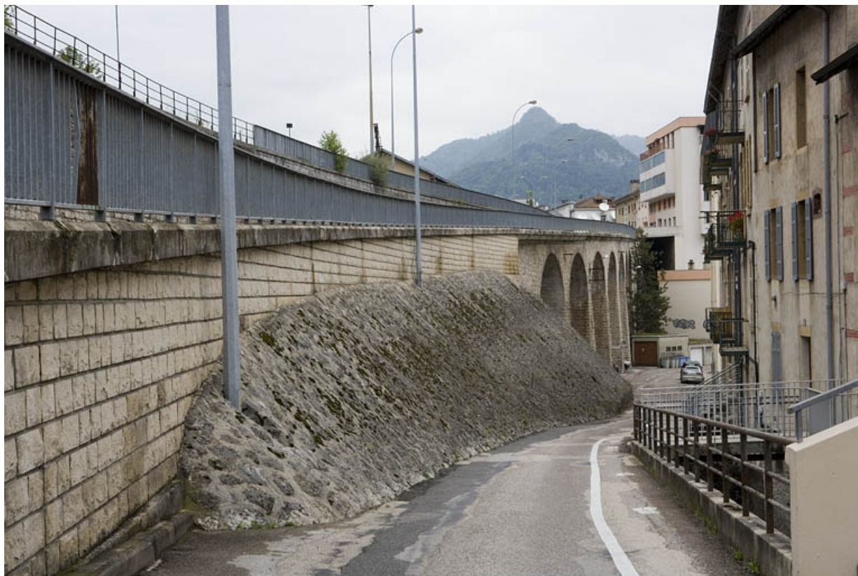
Vue d'ensemble depuis le sud, avec le perré au premier plan.