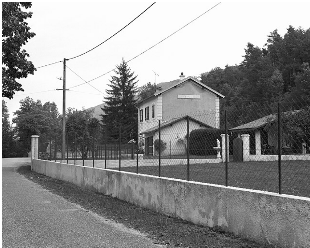
Vue d'ensemble, depuis la route au sud-ouest.

39, Lavancia-Epercy V.C. 3, lieudit : à la Gare