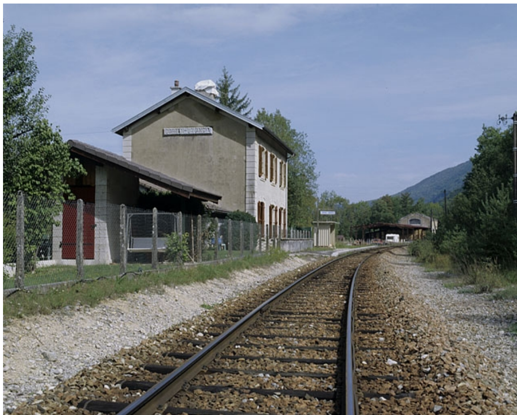
Vue d'ensemble, depuis la voie côté La Cluse (sud).

39, Lavancia-Epercy V.C. 3, lieudit : à la Gare