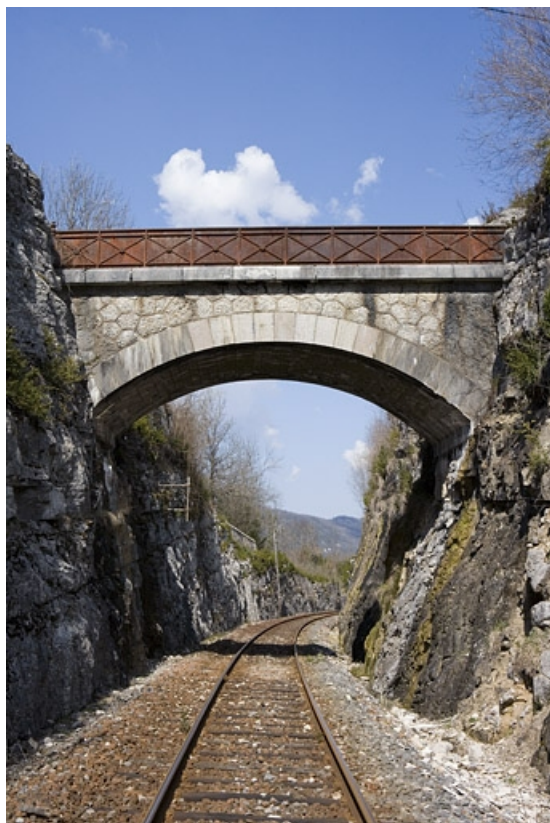
Vue d'ensemble, depuis la voie côté La Cluse (sud). 39, Lavancia-Epercy V.C. 4, lieudit : sur le Rognon