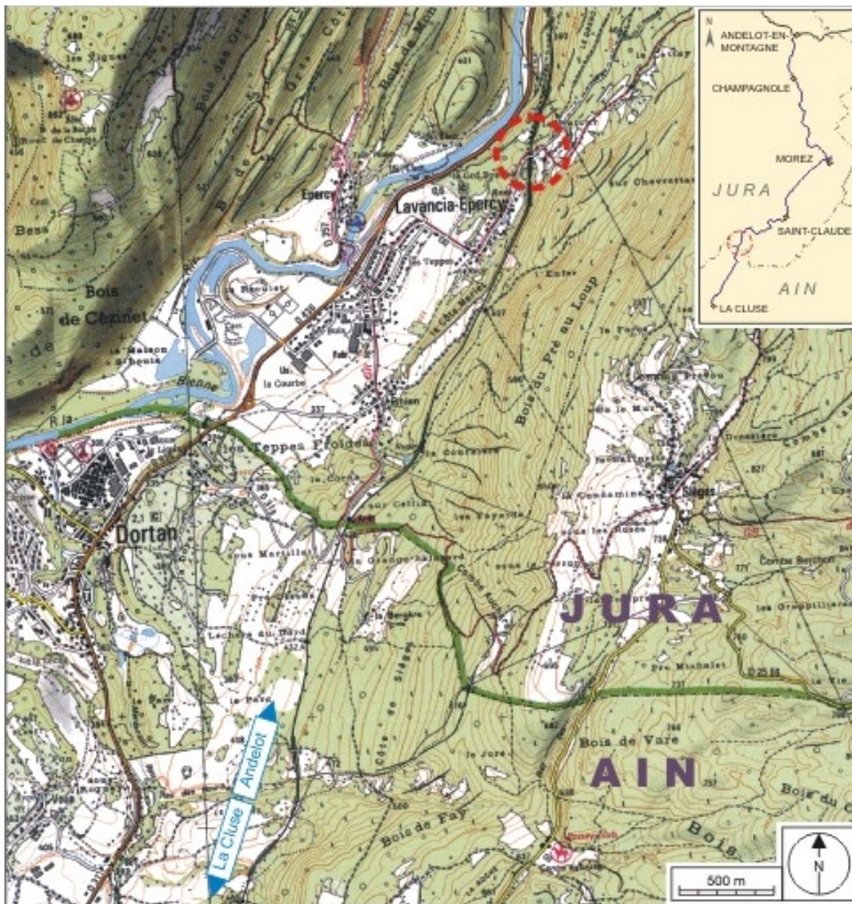
Carte et schéma de localisation. Carte topographique, IGN, 2000, dalle F085_052, échelle 1:25 000. Scan 25, licence n° 2008/CISE/2968.

39, Lavancia-Epercy V.C. 4, lieu-dit : sur le Rognon