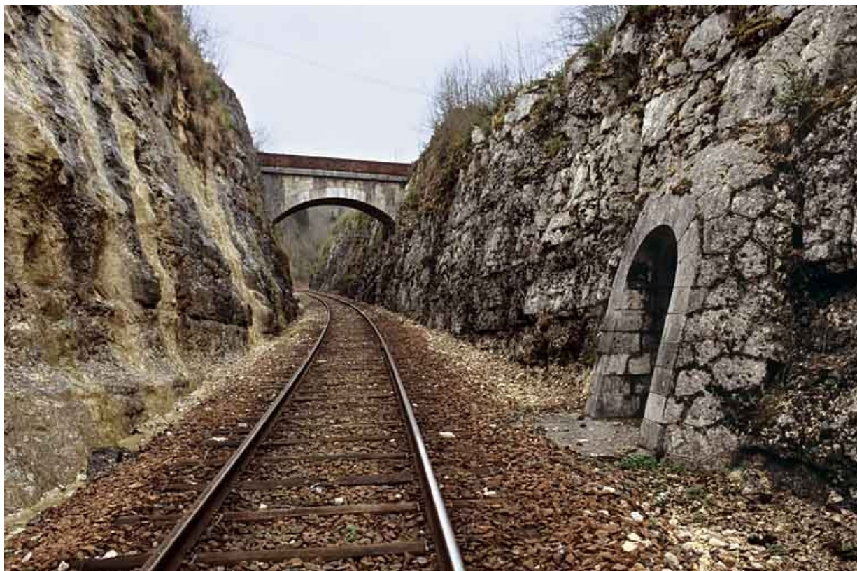
Vue d'ensemble de la tranchée, depuis le côté Andelot-en-Montagne (nord). A droite le deuxième abri, à l'arrière-plan le pont au PK 094.061.

39, Lavancia-Epercy, lieudit : au Champ du Ligneux