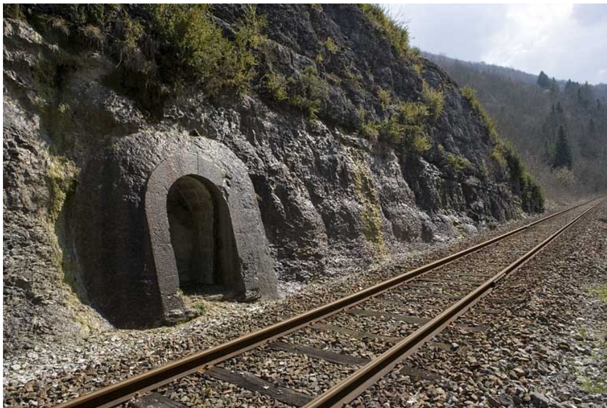
Cinquième abri (à gauche de la voie), de trois quarts gauche.

39, Lavancia-Epercy, lieudit : au Champ du Ligneux