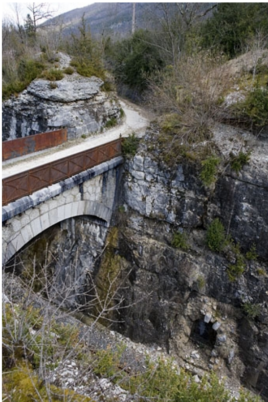
Vue plongeante sur le troisième abri (à gauche de la voie) et sur le pont.

39, Lavancia-Epercy, lieudit : au Champ du Ligneux