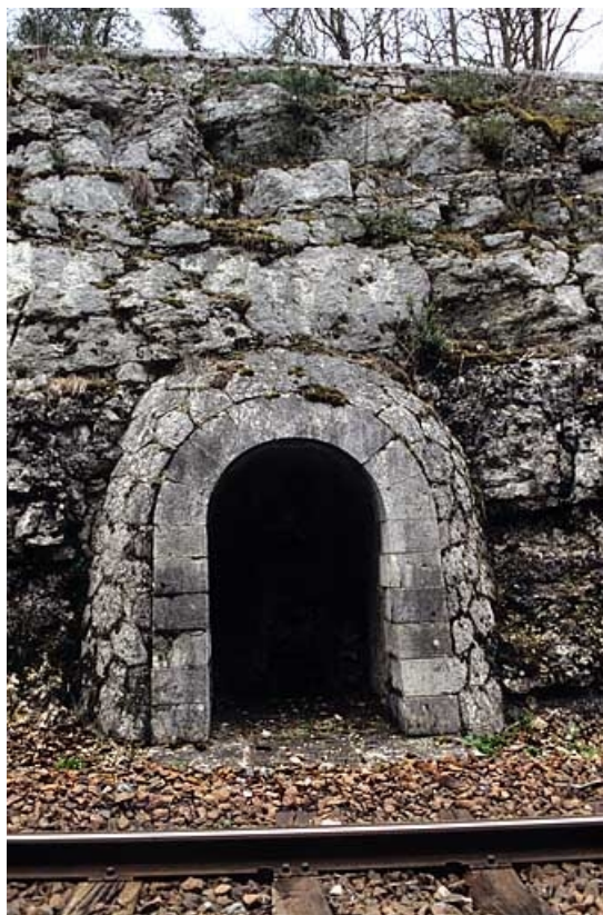
Deuxième abri (à droite de la voie).

39, Lavancia-Epercy, lieudit : au Champ du Ligneux