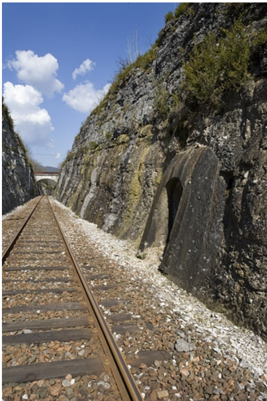
Vue d'ensemble de la tranchée, depuis le côté La Cluse (sud). A droite le cinquième abri. 39, Lavancia-Epercy, lieudit : au Champ du Ligneux