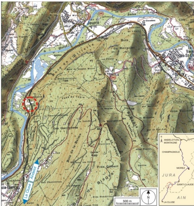
Carte et schéma de localisation. Carte topographique, IGN, 2000, dalles F085_052 et F086_052, échelle 1:25 000. Scan 25, licence n° 2008/CISE/2968.

39, Lavancia-Epercy, lieudit : la Brasselette