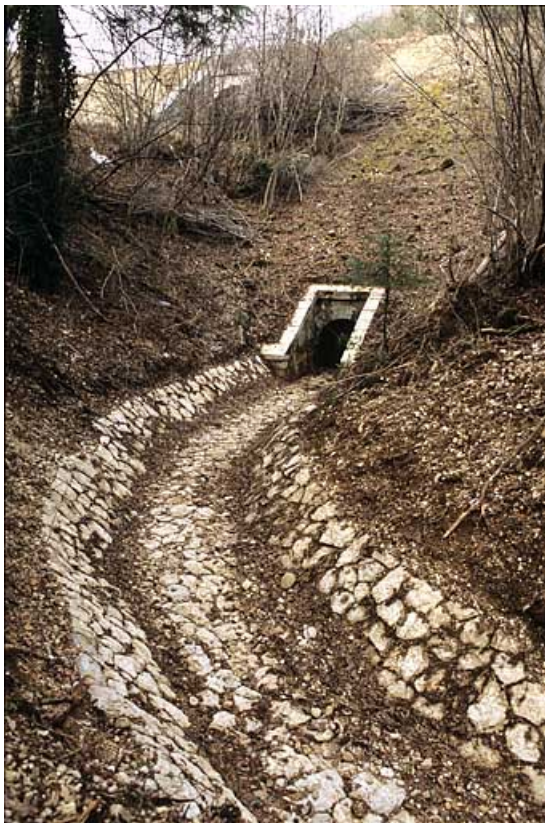
Aqueduc : tête aval (ouest) et rigole.

39, Lavancia-Epercy, lieudit : la Brasselette