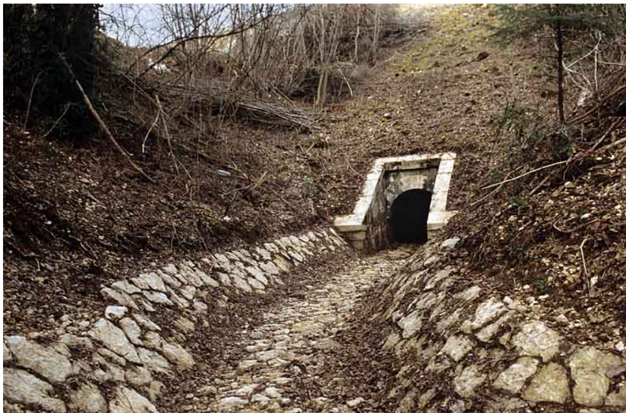
Aqueduc : tête aval et rigole (cadrage horizontal).

39, Lavancia-Epercy, lieudit : la Brasselette