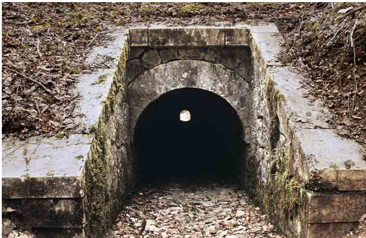
Aqueduc : tête amont (est).

39, Lavancia-Epercy, lieudit : la Brasselette