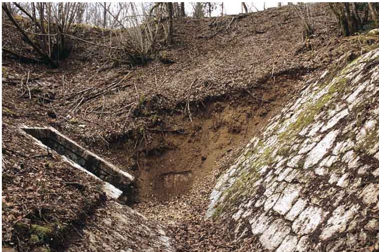
Aqueduc : " canal " et tête amont.

39, Lavancia-Epercy, lieudit : la Brasselette