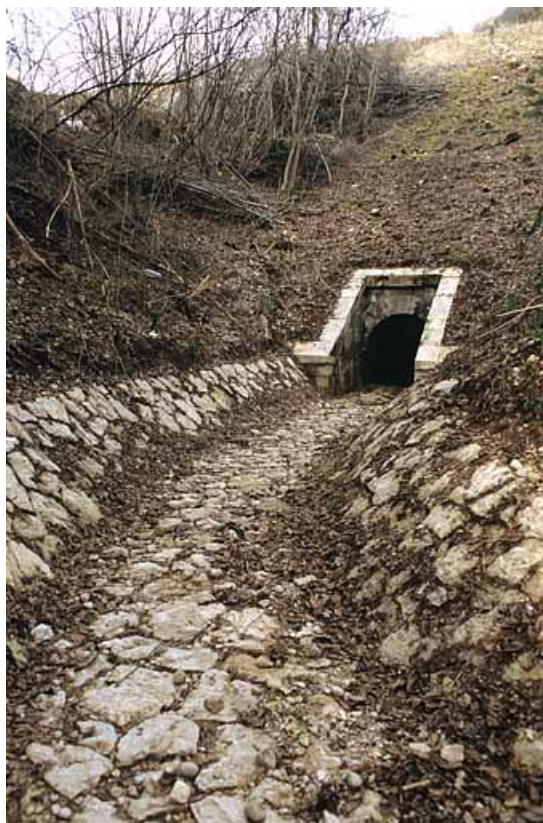
Aqueduc : tête aval (ouest) et rigole (cadrage vertical).

39, Lavancia-Epercy, lieudit : la Brasselette