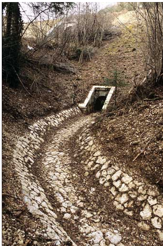
Aqueduc : tête aval (ouest) et rigole.

39, Lavancia-Epercy, lieudit : la Brasselette