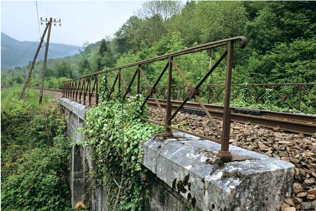
Garde-corps vu en enfilade, depuis le côté La Cluse (ouest). 39, Jeurre chemin de desserte de l' Oeillette, lieudit : chez Gatier