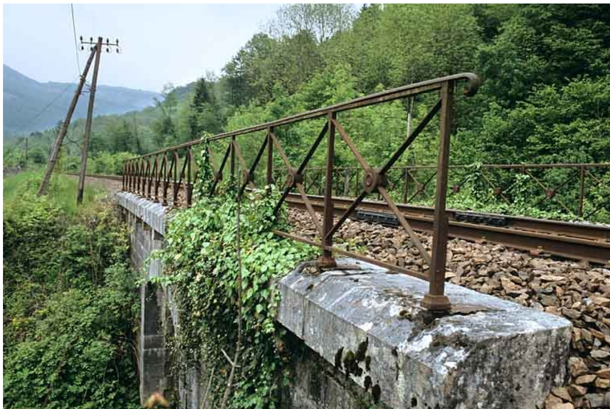
Garde-corps vu en enfilade, depuis le côté La Cluse (ouest). 39, Jeurre chemin de desserte de l' Oeillette, lieudit : chez Gatier