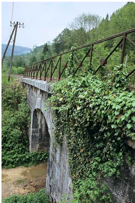
Vue en enfilade, depuis le côté La Cluse (ouest).

39, Jeurre chemin de desserte de l' Oeillette, lieudit : chez Gatier