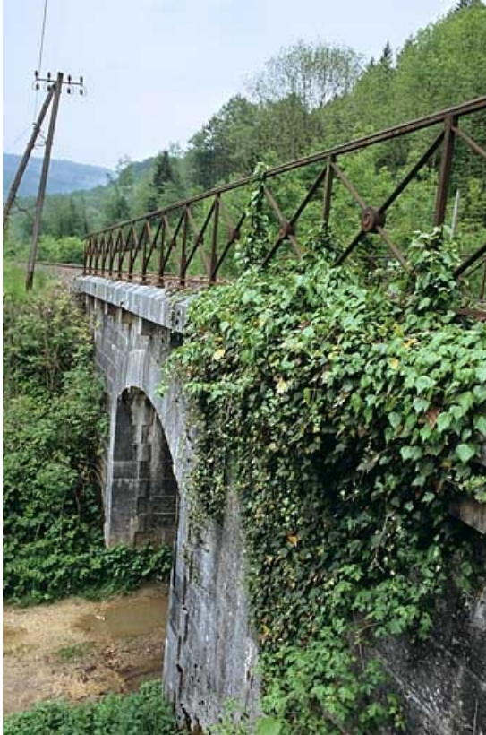
Vue en enfilade, depuis le côté La Cluse (ouest).

39, Jeurre chemin de desserte de l' Oeillette, lieudit : chez Gatier