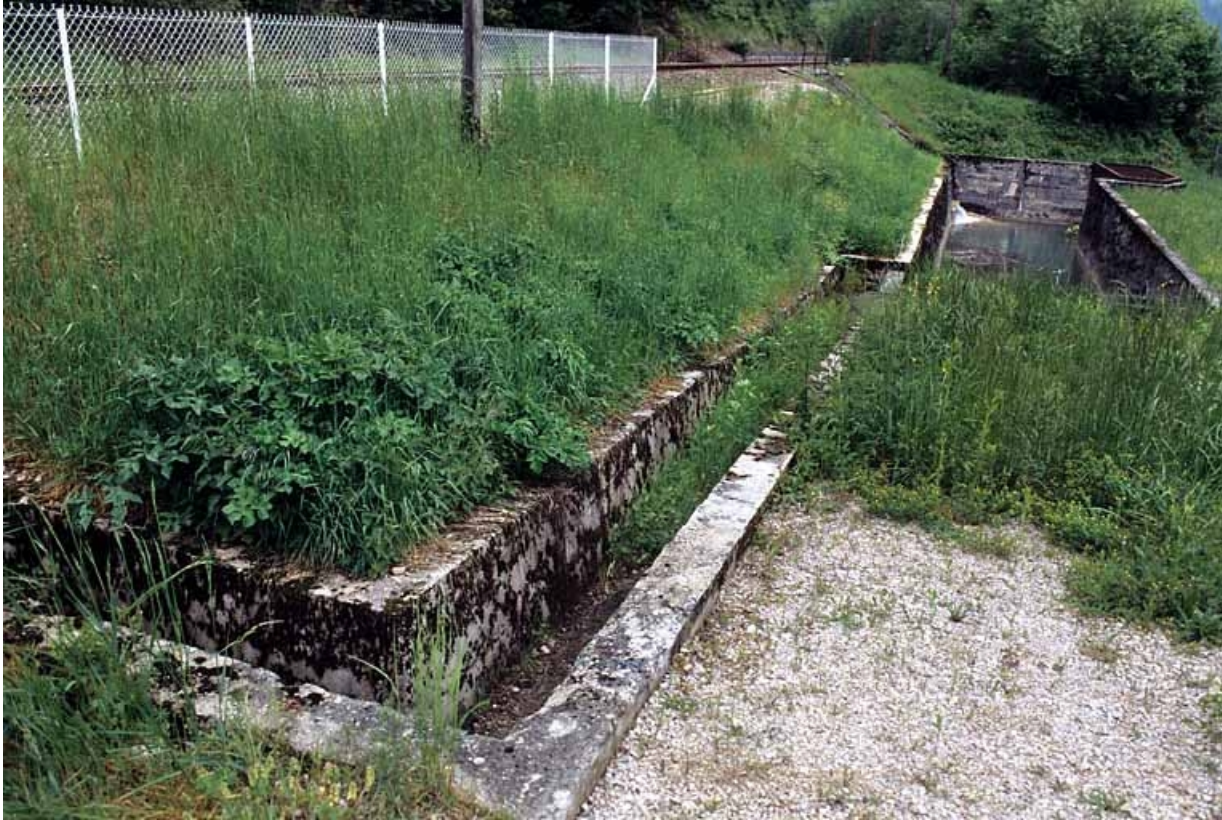
Canal reliant l'aqueduc au réservoir.

39, Vaux-lès-Saint-Claude V.C. 3 dite rue des Montaines, lieudit : au Commun