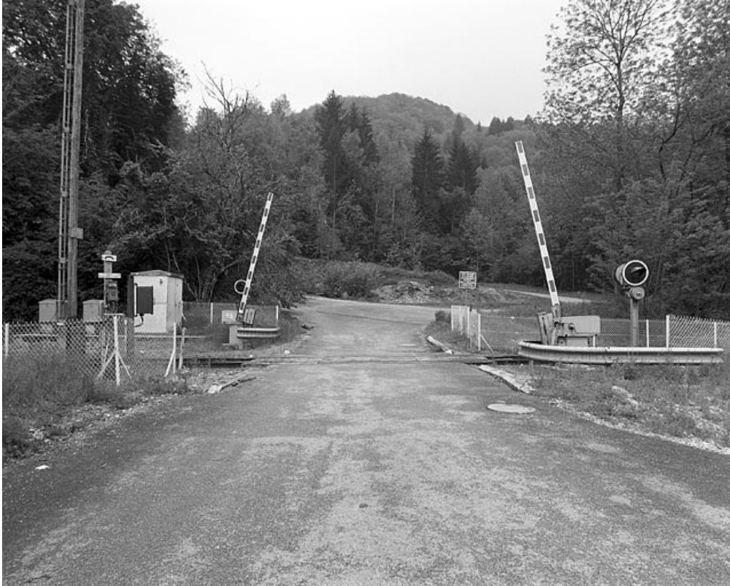
Passage à niveau, vu depuis l'est.

39, Vaux-lès-Saint-Claude V.C. 3 dite rue des Montaines, lieudit : au Commun