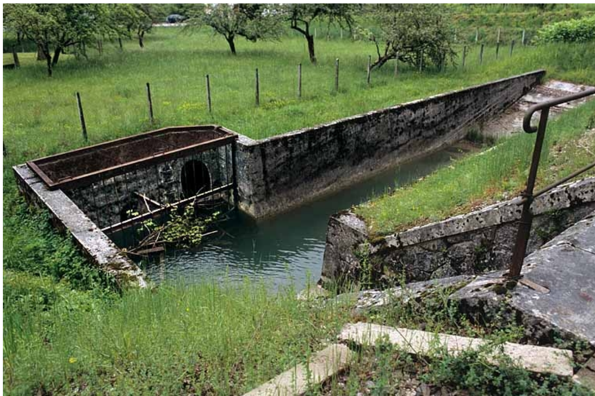
Extrémité du pont et réservoir, depuis la voie.

39, Vaux-lès-Saint-Claude V.C. 3 dite rue des Montaines, lieudit : au Commun