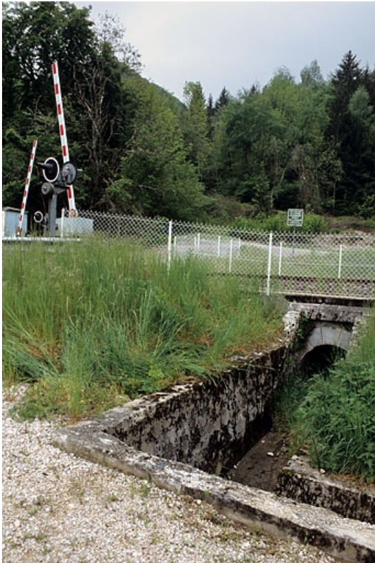
Tête aval (est) de l'aqueduc.

39, Vaux-lès-Saint-Claude V.C. 3 dite rue des Montaines, lieudit : au Commun