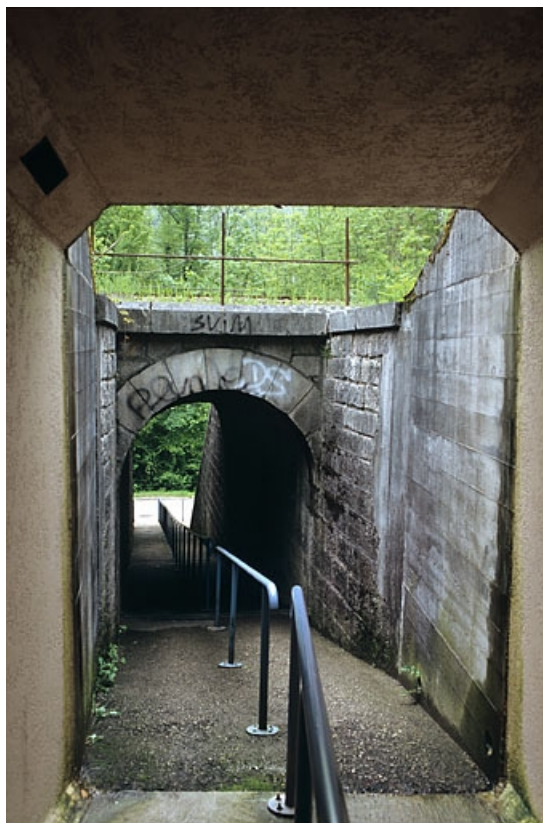
Tête amont (sud), depuis le passage sous la route de Lyon. 39, Molinges chemin du Lary