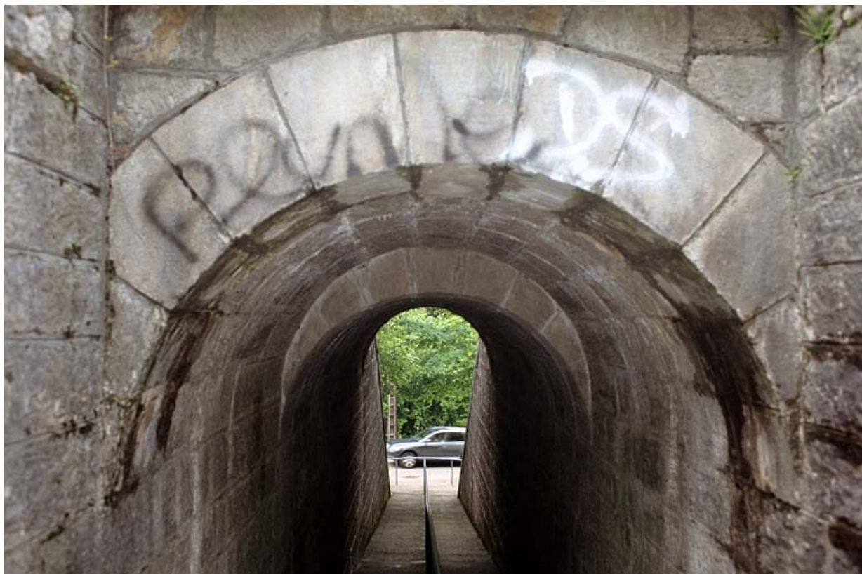
Voûte appareillée en rouleaux à ressauts, depuis l'amont (sud). 39, Molinges chemin du Lary