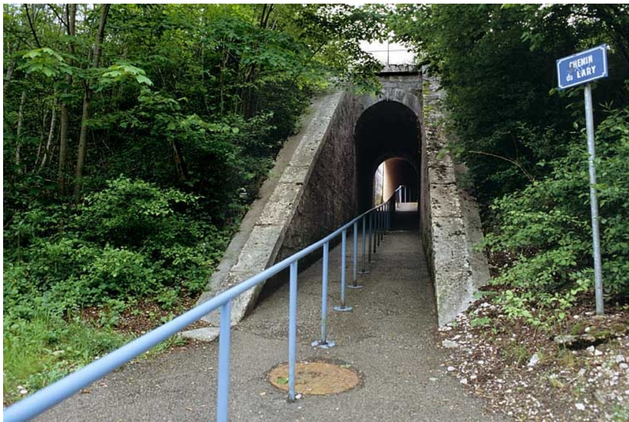
Vue d'ensemble de la tête aval (nord). 39, Molinges chemin du Lary