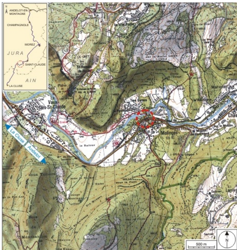
Carte et schéma de localisation. Carte topographique, IGN, 2000, dalle F086_052, échelle 1:25 000. Scan 25, licence n° 2008/CISE/2968.