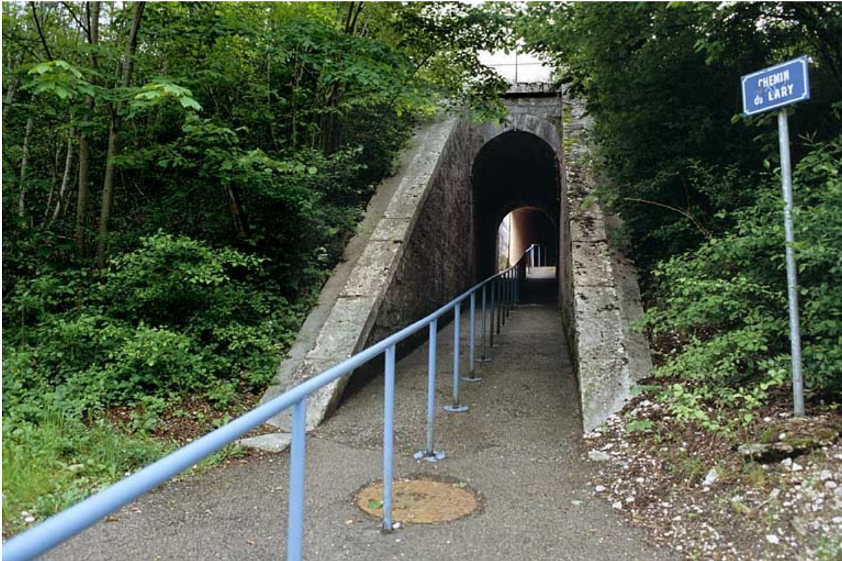
Vue d'ensemble de la tête aval (nord). 39, Molinges chemin du Lary