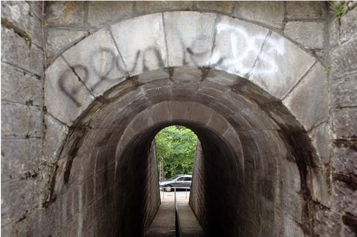
Voûte appareillée en rouleaux à ressauts, depuis l'amont (sud). 39, Molinges chemin du Lary