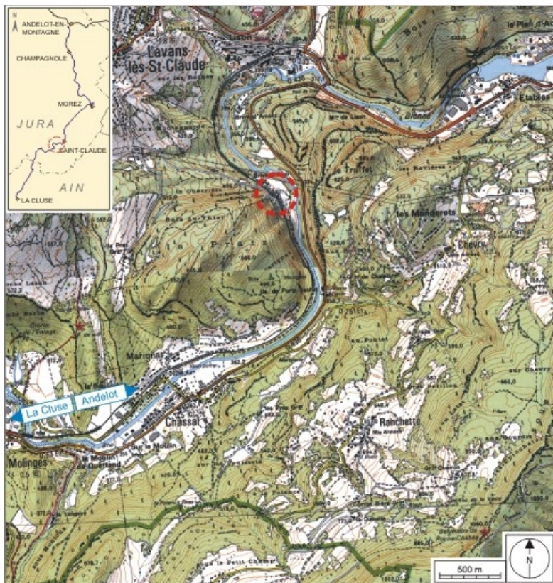
Carte et schéma de localisation. Carte topographique, IGN, 2000, dalle F086_052, échelle 1:25 000. Scan 25, licence n° 2008/CISE/2968.