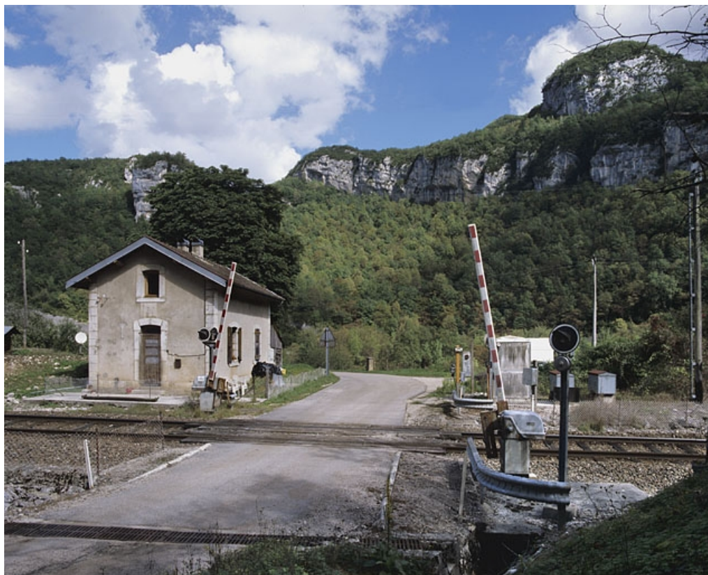
Vue d'ensemble, depuis l'ouest.