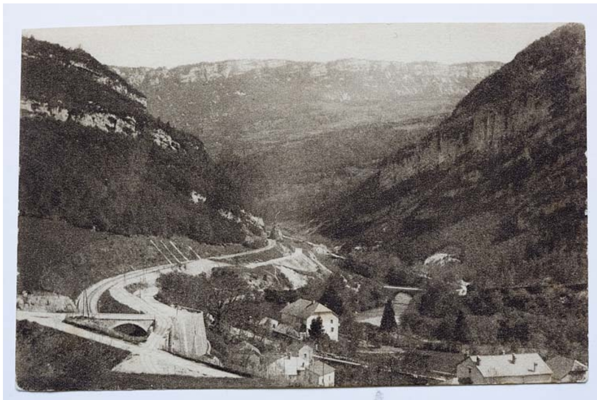
Environs de Saint-Claude - Vallée de la Bienne et du Lizon, 1ère moitié 20e siècle.

39, Lavans-lès-Saint-Claude R.D. 470, lieudit : Lizon