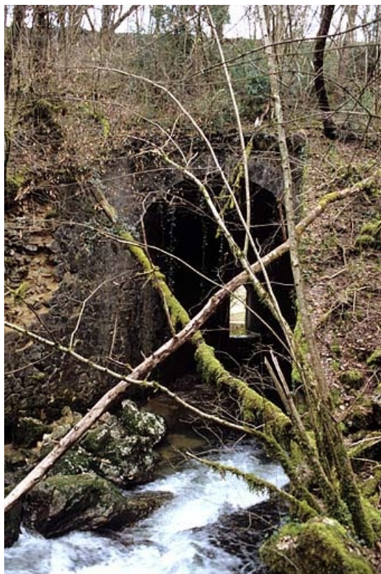
Pont sur le Lizon, depuis l'amont (nord).

39, Lavans-lès-Saint-Claude R.D. 470, lieudit : Lizon