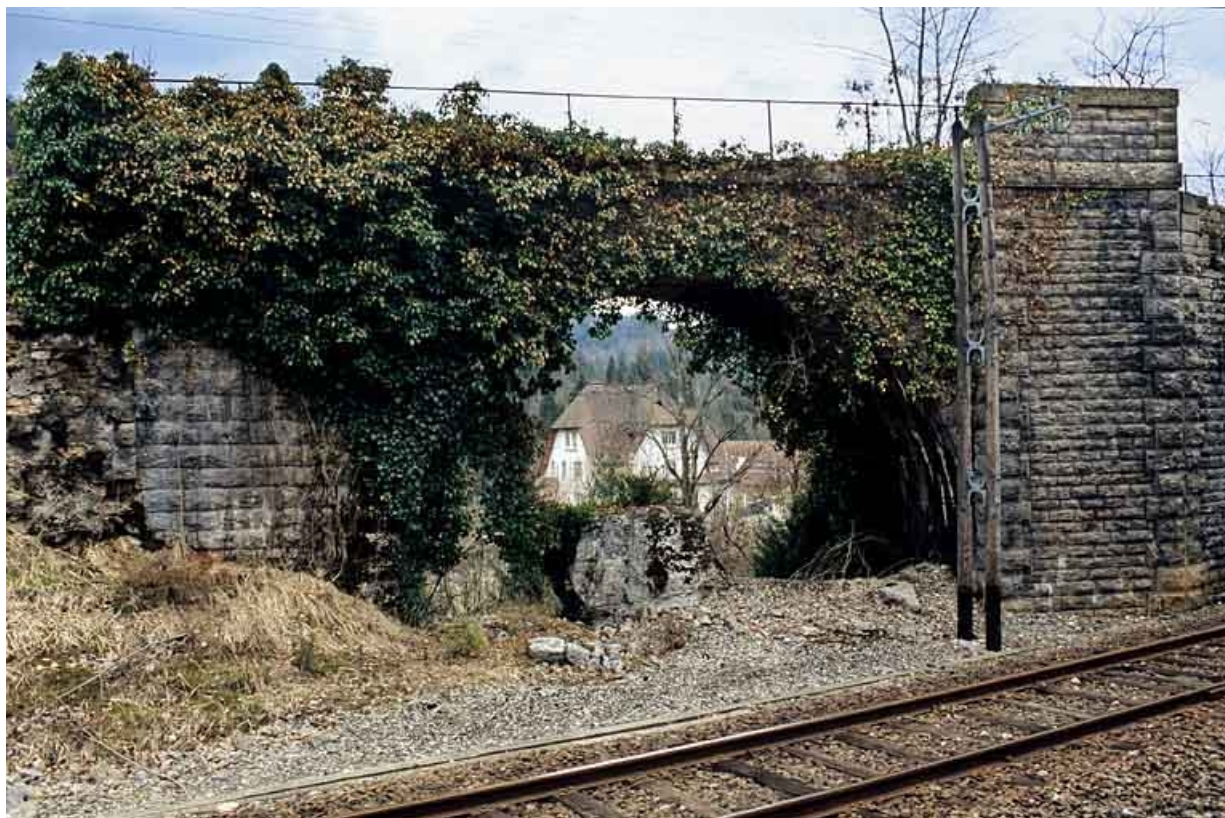
Pont du tacot : arche en plein-cintre et culée gauche.

39, Lavans-lès-Saint-Claude R.D. 470, lieudit : Lizon