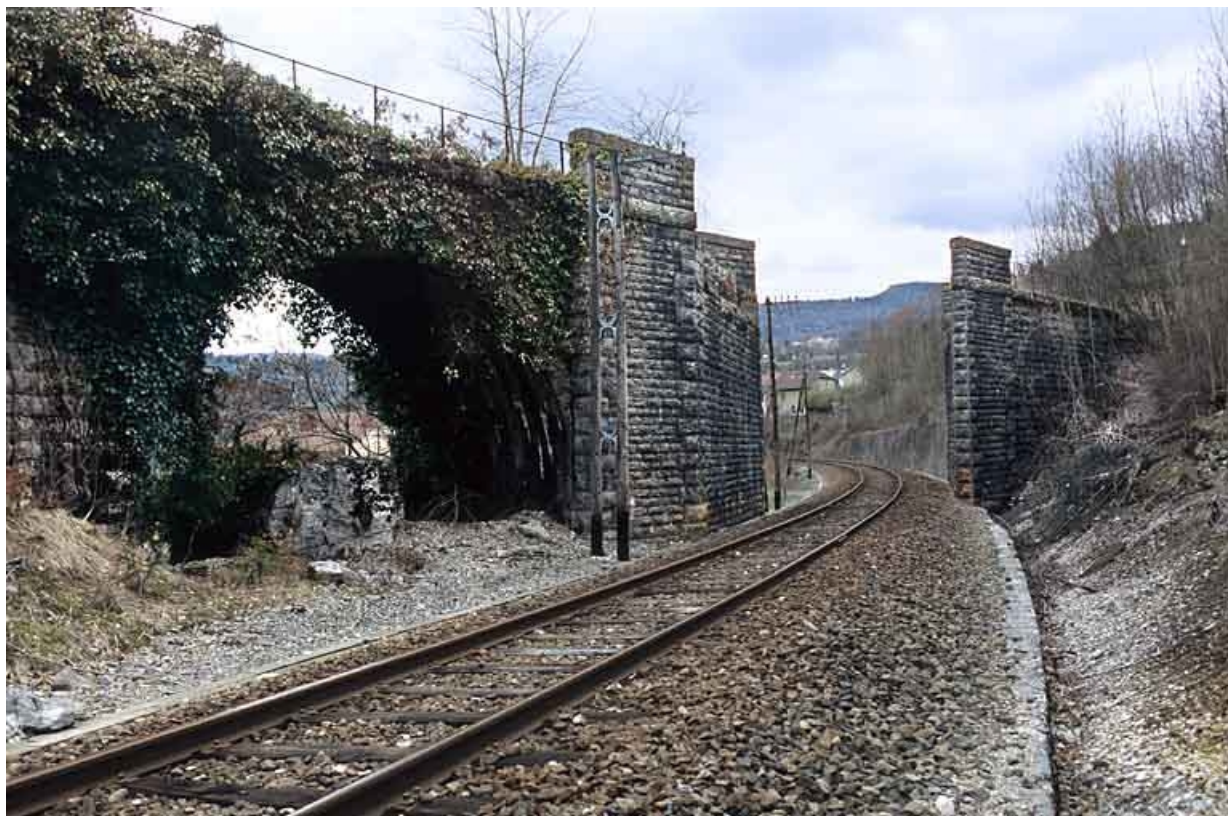
Pont du tacot : vue d'ensemble, depuis le côté Andelot-en-Montagne (est).

39, Lavans-lès-Saint-Claude R.D. 470, lieudit : Lizon