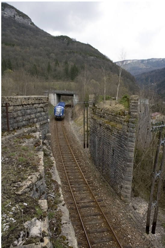
Pont du tacot et pont routier, depuis le côté La Cluse (ouest), avec autorail X 73500. 39, Lavans-lès-Saint-Claude R.D. 470, lieudit : Lizon