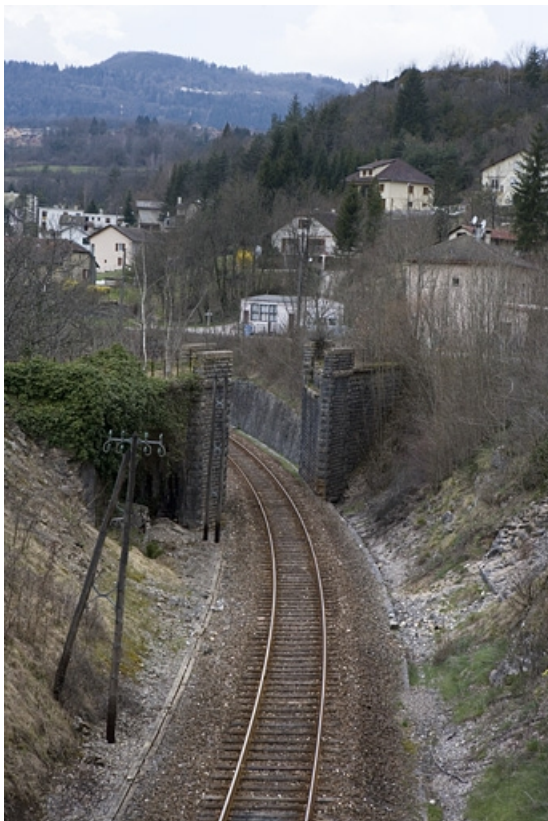
Pont du tacot : vue d'ensemble plongeante, depuis le côté Andelot-en-Montagne (est). 39, Lavans-lès-Saint-Claude R.D. 470, lieudit : Lizon