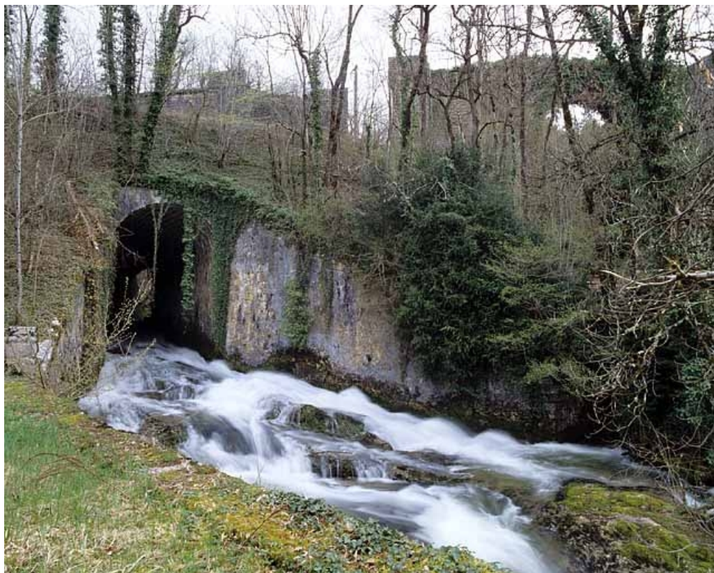
Pont sur le Lizon, depuis l'aval (sud). Pont du tacot à l'arrière-plan.

39, Lavans-lès-Saint-Claude R.D. 470, lieudit : Lizon