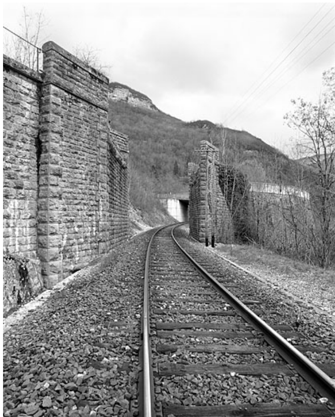
Vue d'ensemble, depuis le côté La Cluse (ouest). 39, Lavans-lès-Saint-Claude R.D. 470, lieudit : Lizon