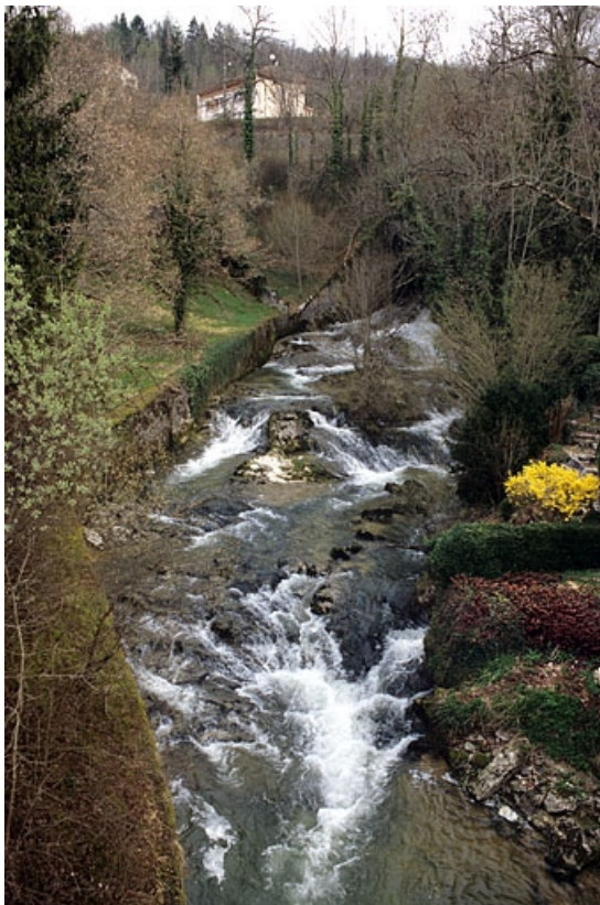
Pont sur le Lizon : le ruisseau, vu depuis l'aval.

39, Lavans-lès-Saint-Claude R.D. 470, lieudit : Lizon