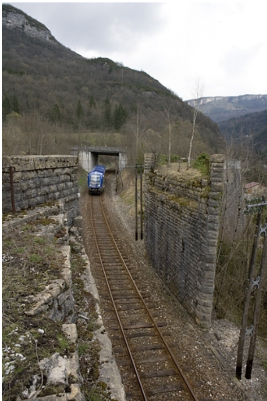
Pont du tacot et pont routier, depuis le côté La Cluse (ouest), avec autorail X 73500. 39, Lavans-lès-Saint-Claude R.D. 470, lieudit : Lizon