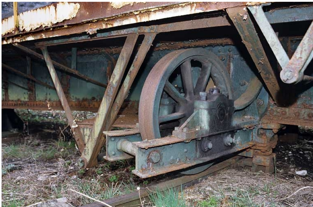
Roue et chemin de roulement.