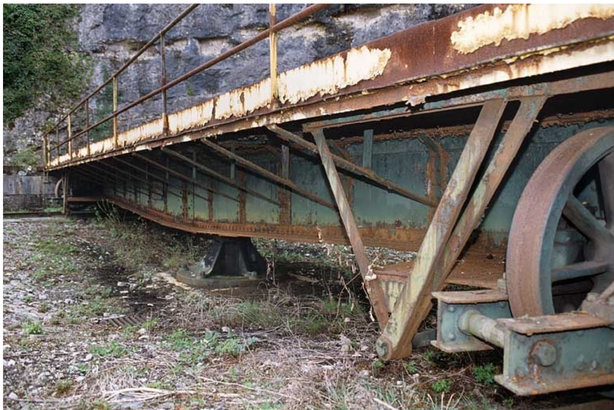
Tablier vu en enfilade.