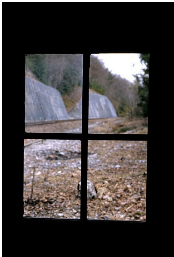
Murs de soutènement à droite de la voie, depuis l'intérieur de l'abri ancien.

39, La Rixouse, lieudit : Bois Joura et Cotats