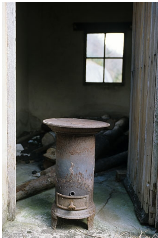
Abri ancien : intérieur et poêle de chauffage.

39, La Rixouse, lieudit : Bois Joura et Cotats