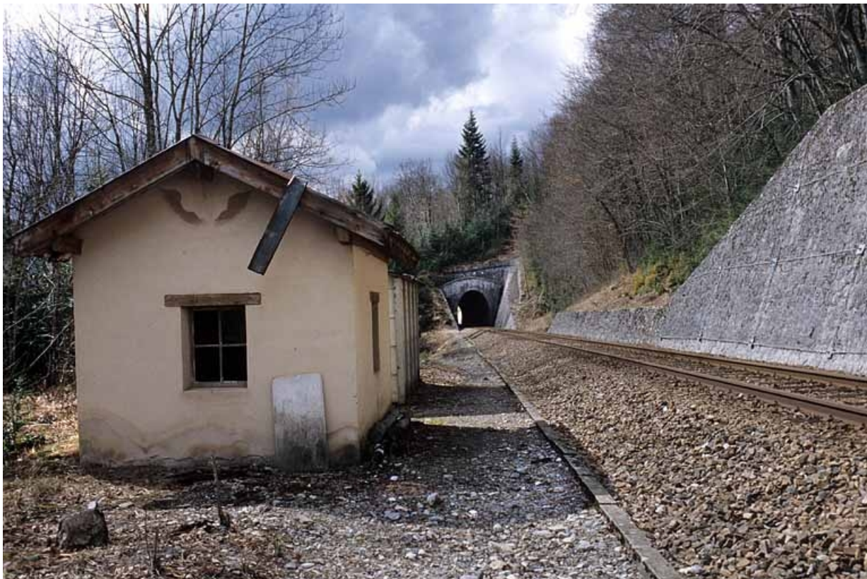
Vue d'ensemble, depuis le nord. Tunnel de Sous la Côte à l'arrière-plan. 39, La Rixouse, lieudit : Bois Joura et Cotats