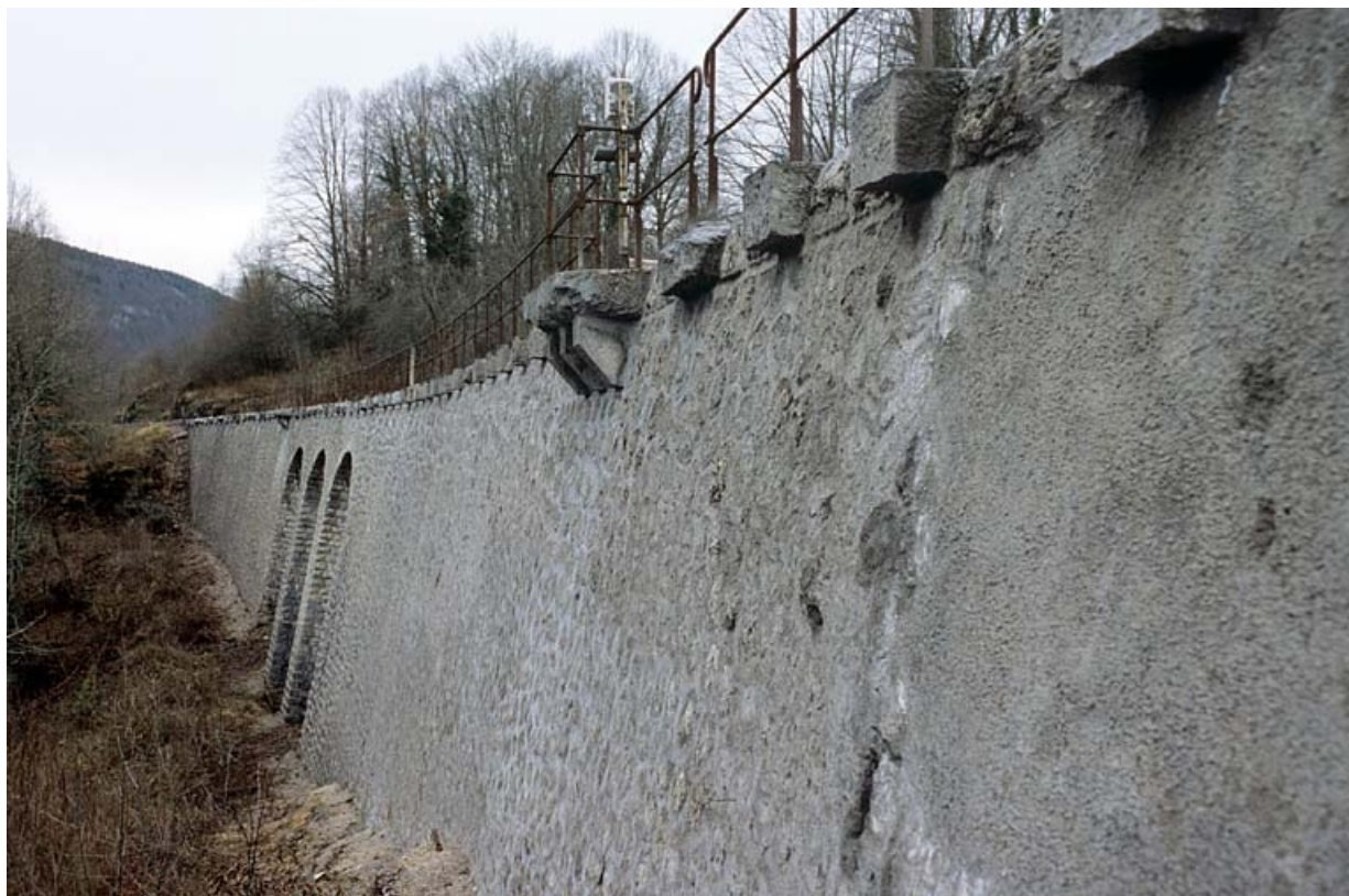
Vue d'ensemble en enfilade, depuis le côté Andelot-en-Montagne (nord)

39, La Rixouse, lieudit : au Bief du Château