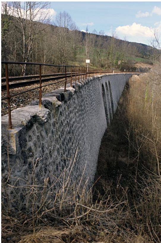
Vue d'ensemble en enfilade, depuis le côté La Cluse (sud).

39, La Rixouse, lieudit : au Bief du Château