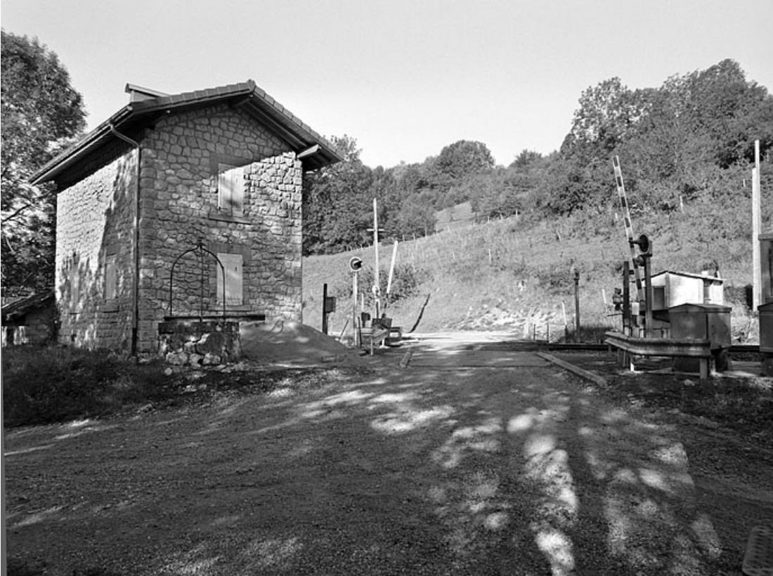
Façades postérieure et latérale gauche, puits et passage à niveau.

39, Villard-sur-Bienne chemin rural de Villard-sur-Bienne à Longchaumois, lieudit : Chavon