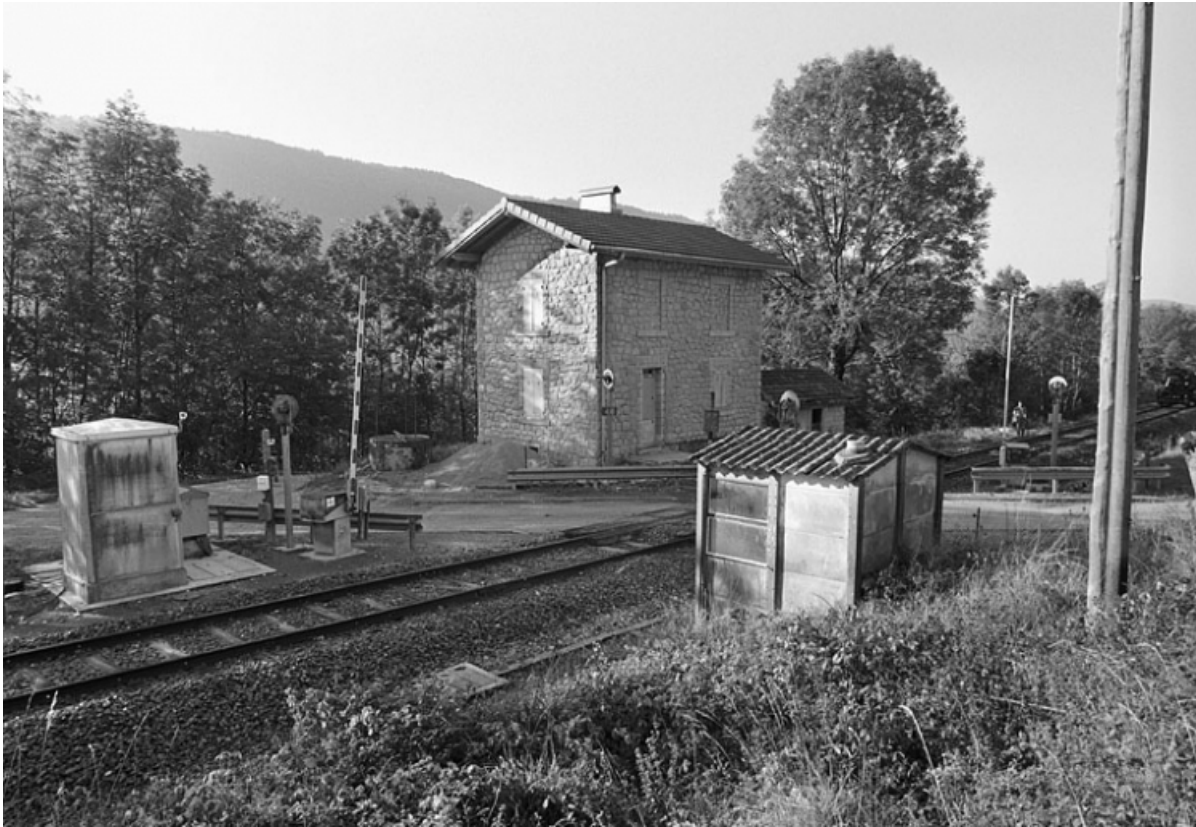
Vue d'ensemble, depuis le nord.

39, Villard-sur-Bienne chemin rural de Villard-sur-Bienne à Longchaumois, lieudit : Chavon