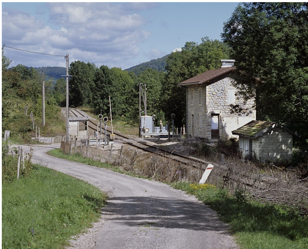
Vue d'ensemble, depuis le sud-ouest.

39, Villard-sur-Bienne chemin rural de Villard-sur-Bienne à Longchaumois, lieudit : Chavon