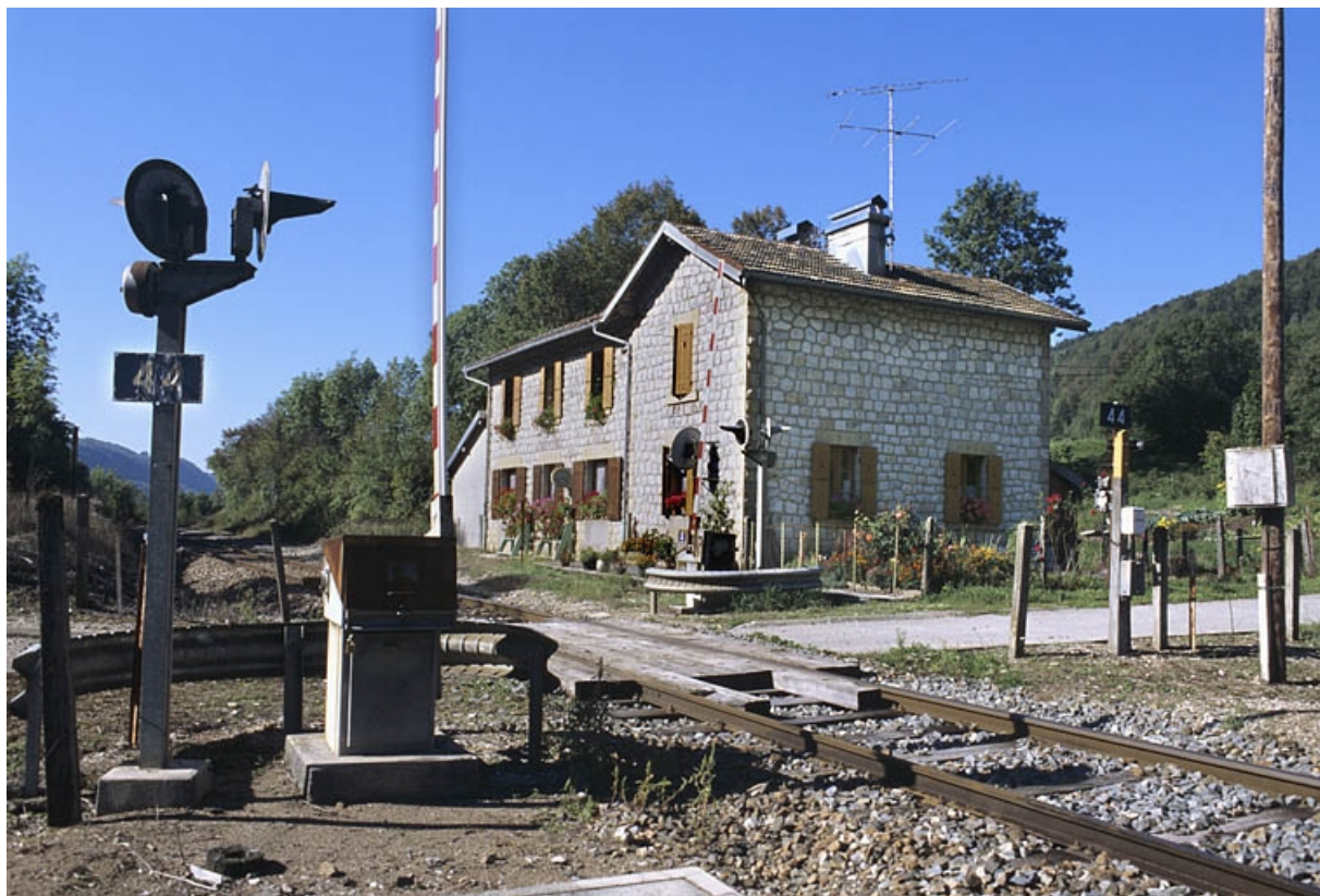
Vue d'ensemble, depuis le nord-est. 39, Lézat rue de la Gare