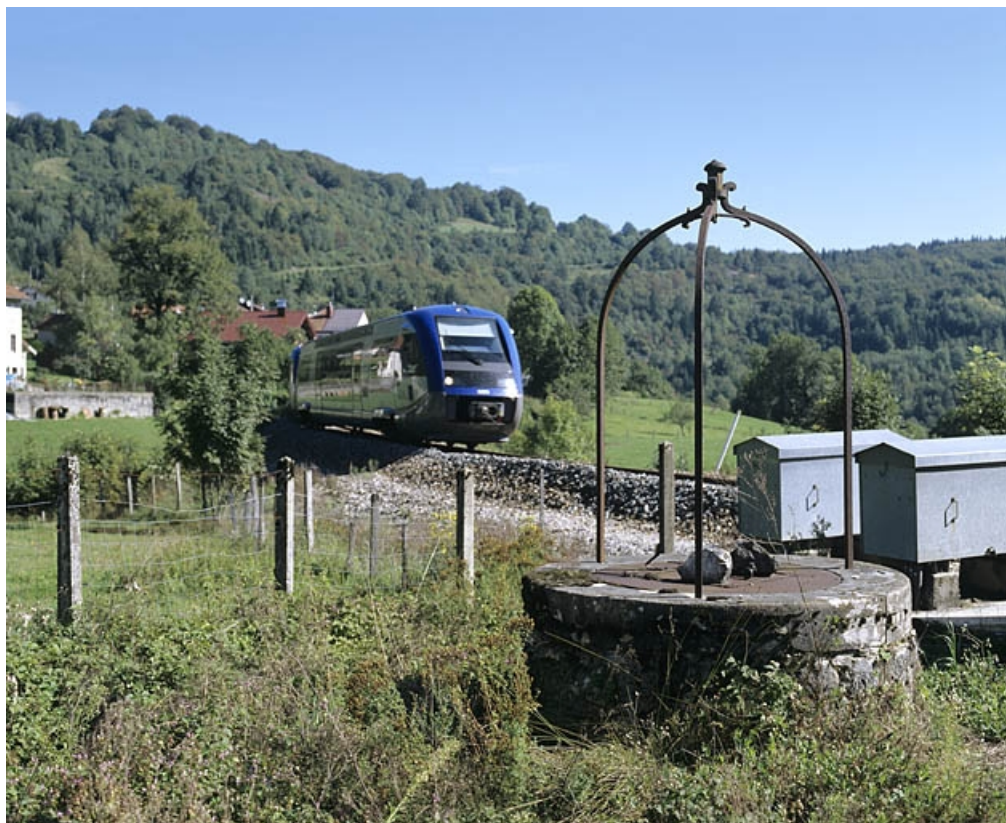
Puits, avec autorail X 73500 (en provenance de Morez) en arrière-plan.