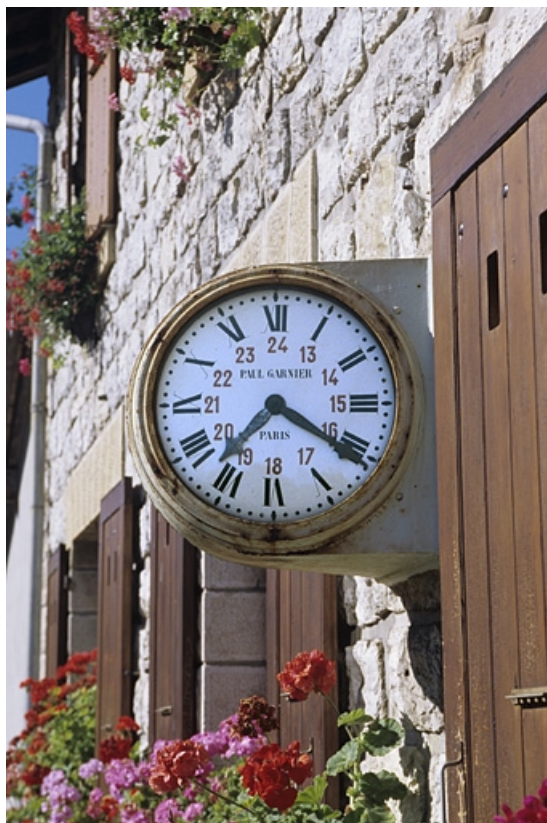
Horloge Garnier (face nord).