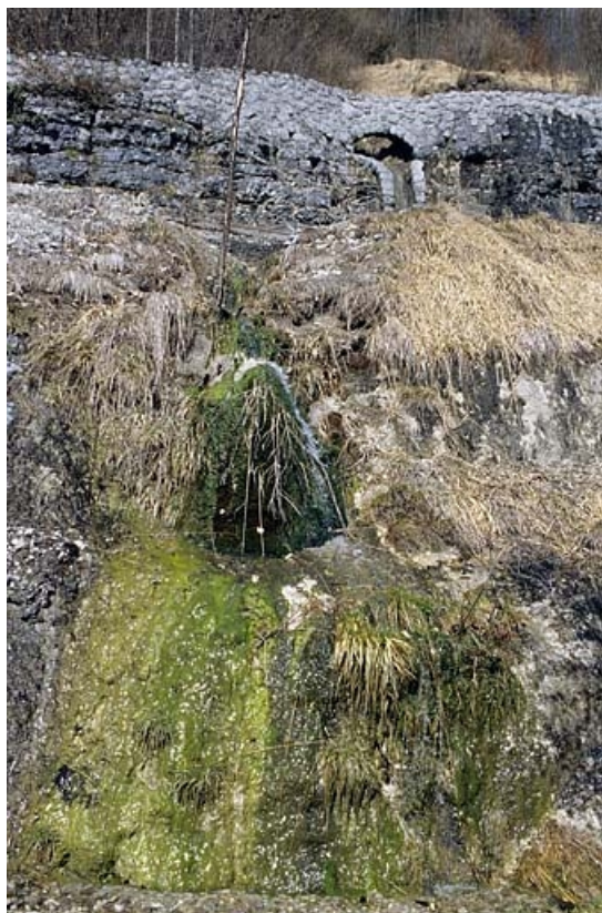
Écoulement à gauche de la voie, à proximité de la descente d'eau.

65, Tancua C.D. 126, lieudit : Champs de la Maisonnette