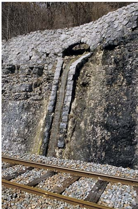
Descente d'eau dans le mur de protection à droite de la voie, de trois quarts droite.

65, Tancua C.D. 126, lieudit : Champs de la Maisonnette