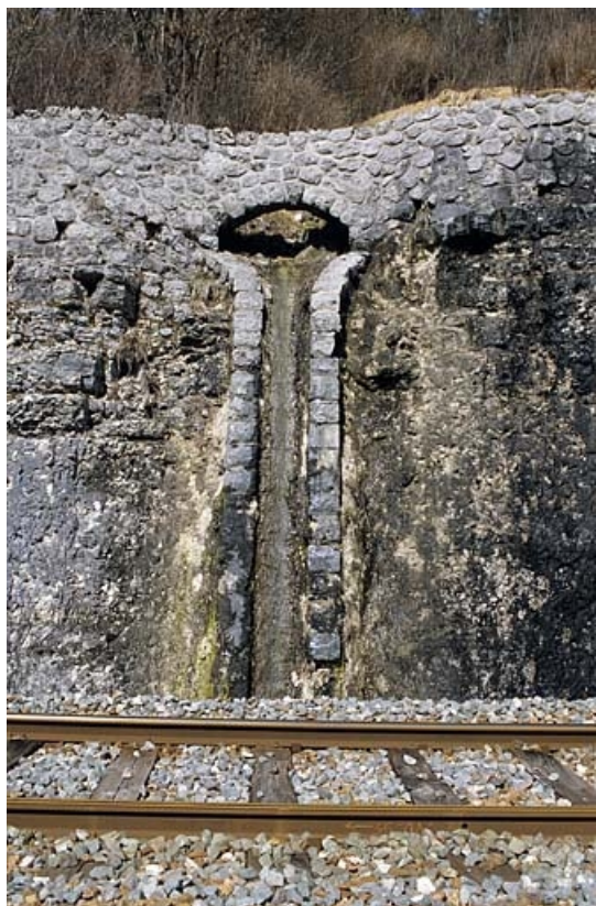
Descente d'eau dans le mur de protection à droite de la voie.

65, Tancua C.D. 126, lieudit : Champs de la Maisonnette