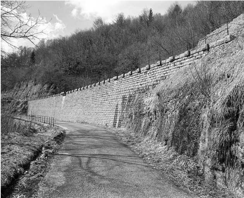
Mur de soutènement de la voie : vue d'ensemble, de trois quarts droite (est). 65, Tancua C.D. 126, lieudit : Champs de la Maisonnette