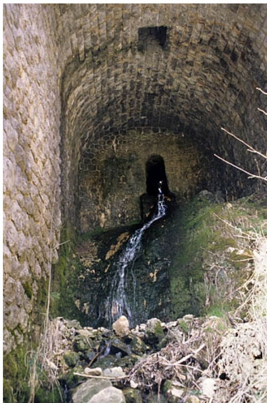
Mur de soutènement de la route : aqueduc, dans l'arche centrale.

65, Tancua C.D. 126, lieudit : Champs de la Maisonnette