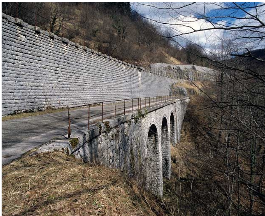
Vue d'ensemble des deux murs de gauche, de trois quarts gauche (ouest). 65, Tancua C.D. 126, lieudit : Champs de la Maisonnette