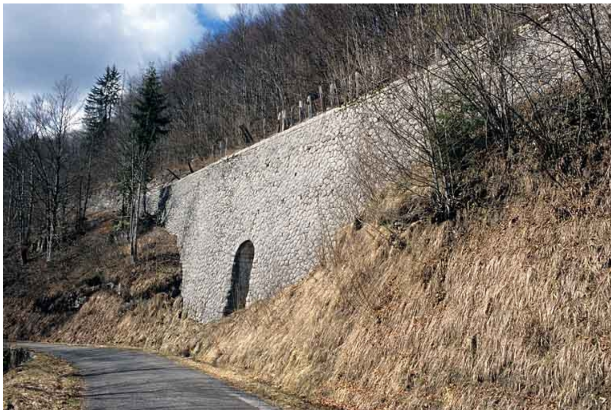
Vue d'ensemble, de trois quarts droite. 65, Tancua C.D. 126, lieudit : Côte de Bandu