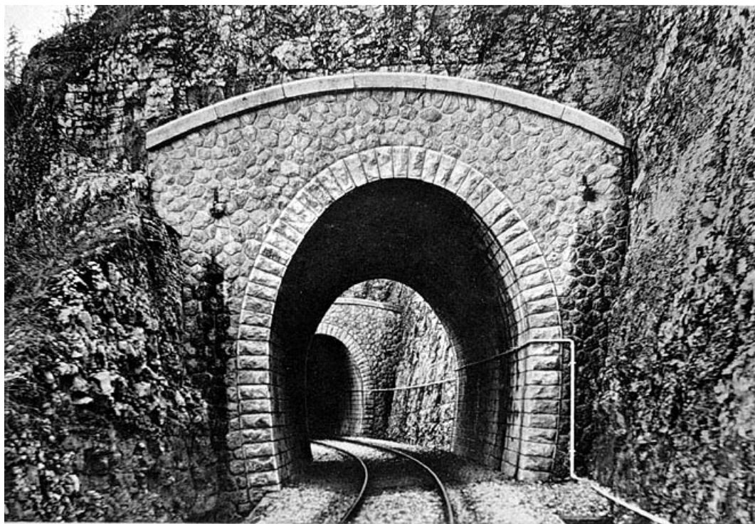
SOUTERRAIN DE LA POINTE.