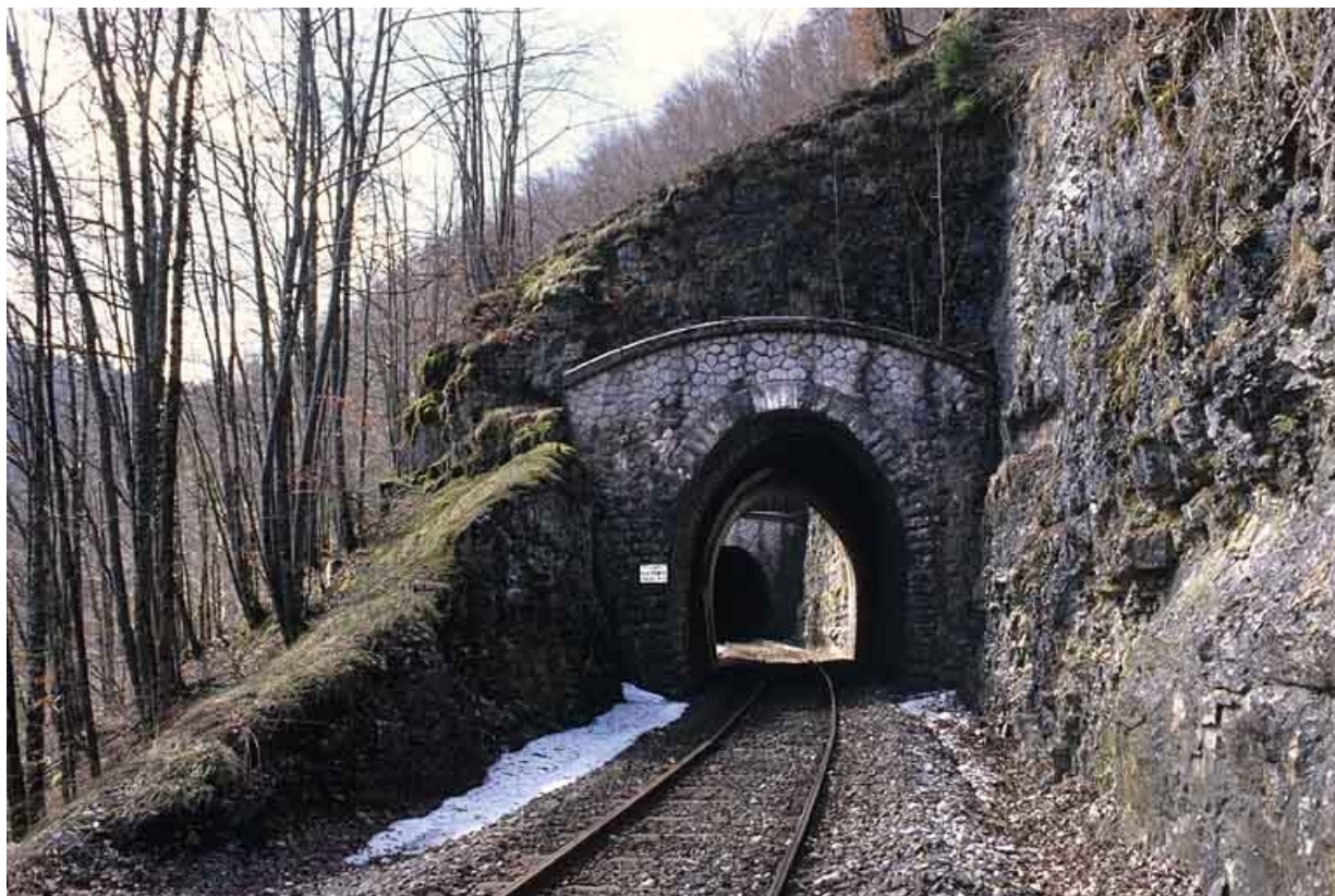
Vue d'ensemble, côté Andelot-en-Montagne (nord). Tunnel du Grépillon à l'arrière-plan. 39, Morbier, lieudit : la Doye de Bienne