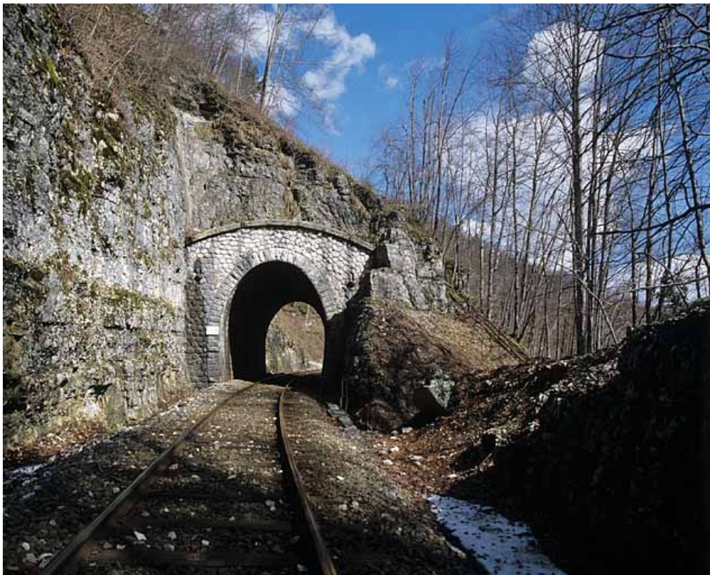
Vue d'ensemble, côté La Cluse (sud). 39, Morbier, lieudit : la Doye de Bienne