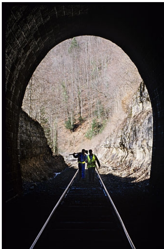
Tunnel des Bataillards : tête côté La Cluse (ouest), depuis l'intérieur. 39, Morbier, lieudit : la Doye de Bienne