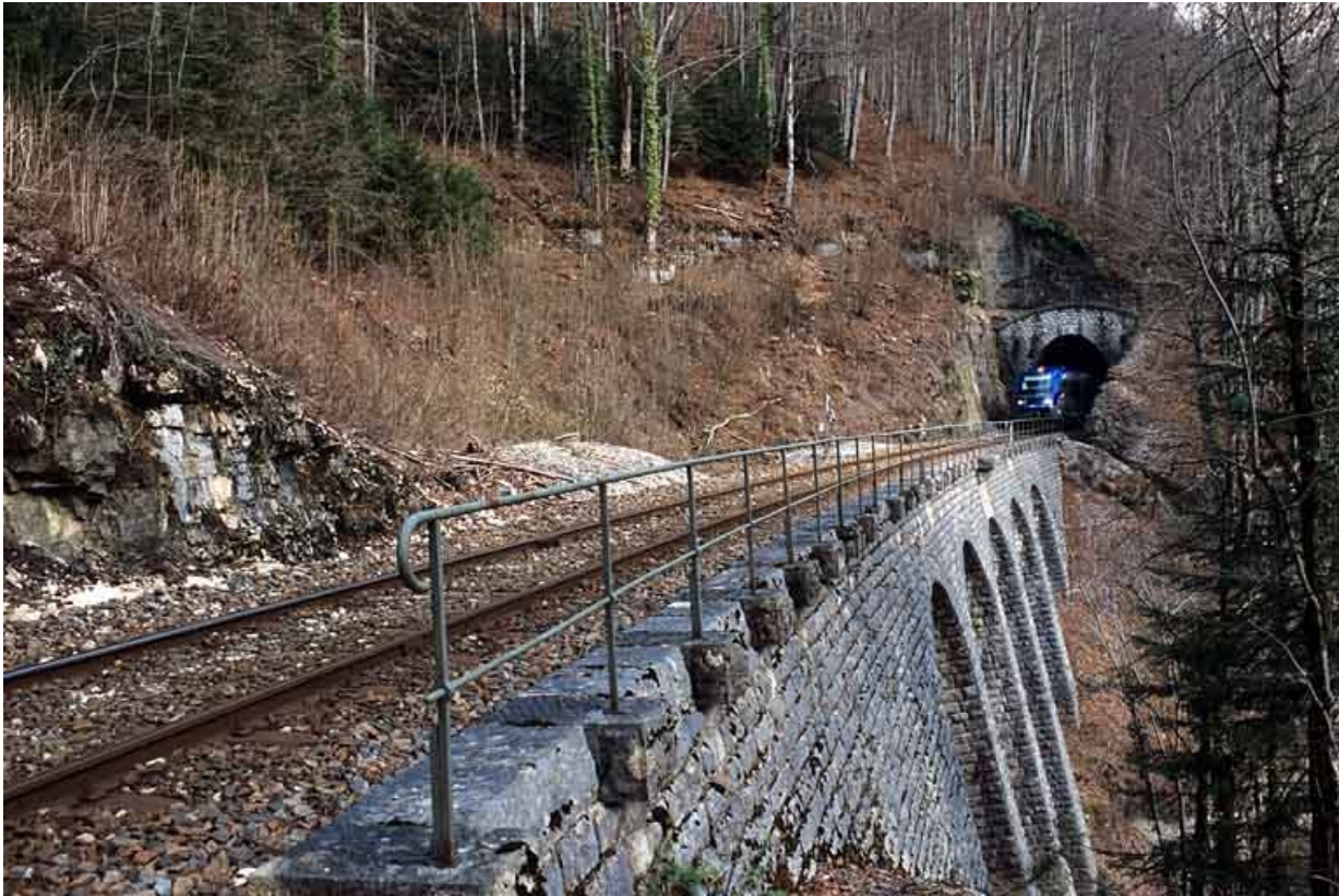
Tunnel de Lézair : tête côté La Cluse (sud-ouest), avec autorail X 73500. Cette tête est suivie d'un mur de soutènement à arcades à gauche de la voie.

39, Morbier, lieudit : la Doye de Bienne