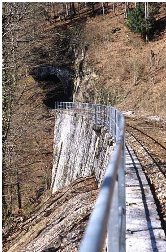
Tunnel de Lézair : tête côté Andelot-en-Montagne (nord-est). Cette tête est précédée par un mur de soutènement à gauche de la voie.

39, Morbier, lieudit : la Doye de Bienne